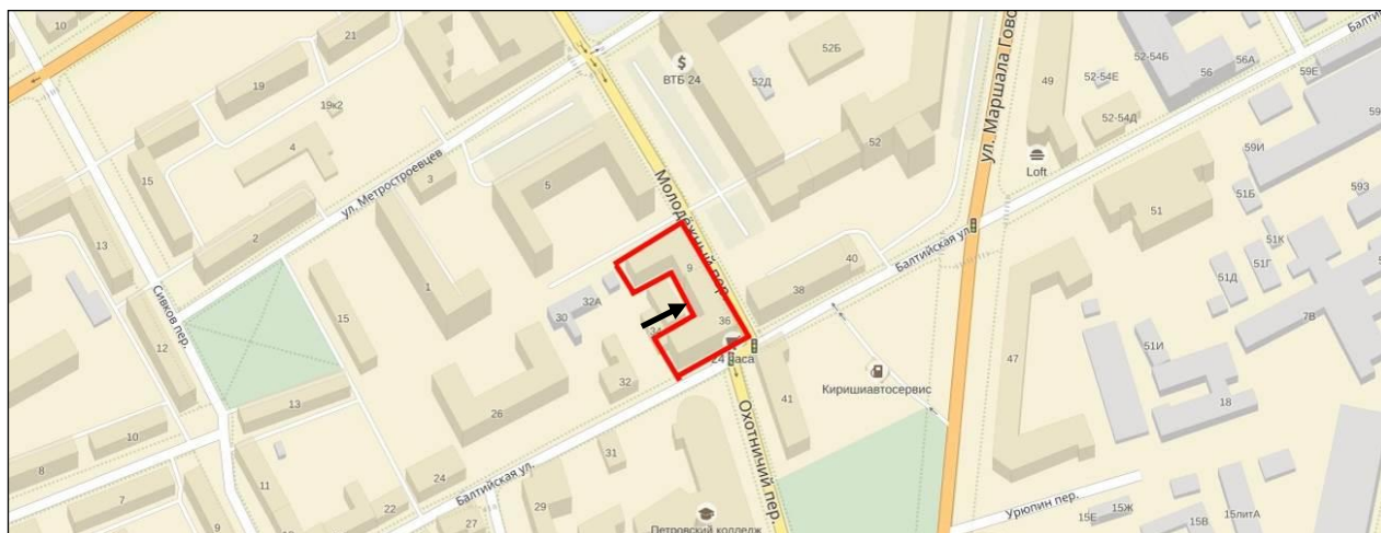
Рисунок 1 Локальное местоположение