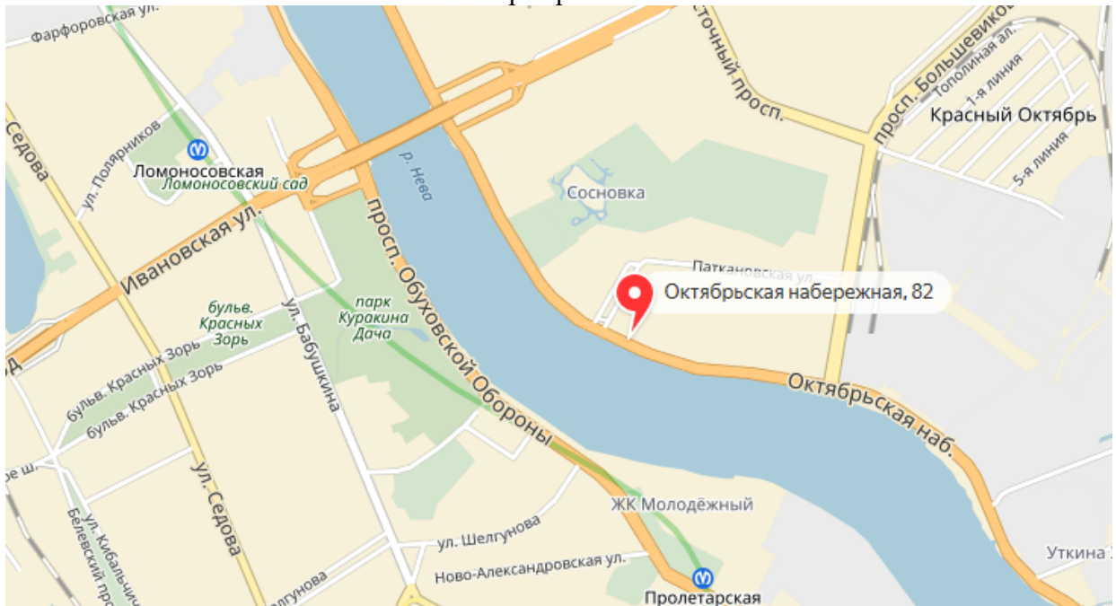
Карта местоположения объекта