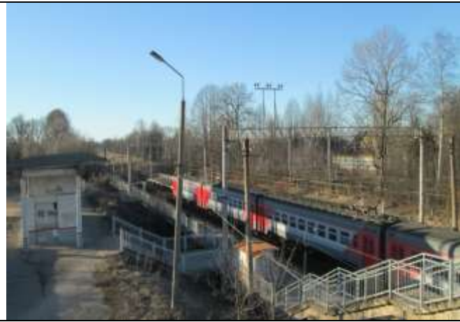
Фото 5. Ближайшее окружение объекта оценки