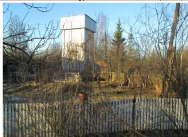
Фото 11. Ближайшее окружение объекта оценки