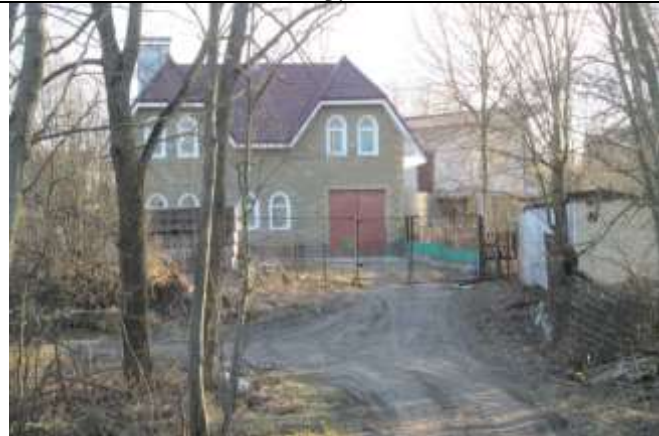
Фото 7. Ближайшее окружение объекта оценки