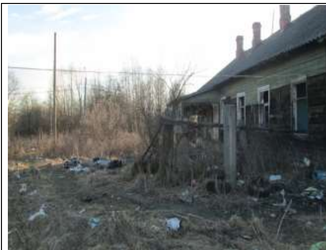
Фото 21. Вид объекта оценки