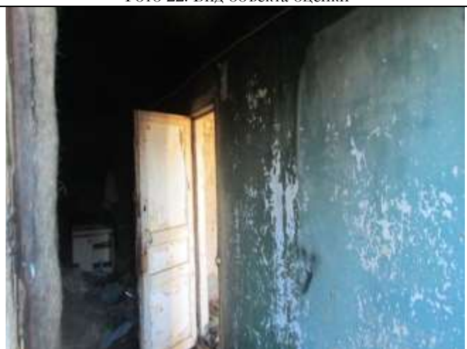
Фото 24. Вид объекта оценки