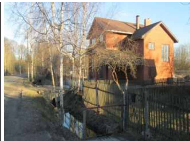
Фото 13. Ближайшее окружение объекта оценки (дом 17)