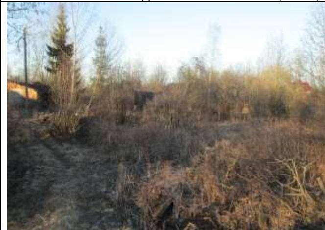
Фото 15. Ближайшее окружение объекта оценки