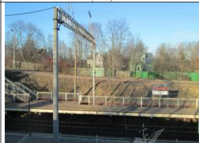
Фото 4. Ближайшее окружение объекта оценки