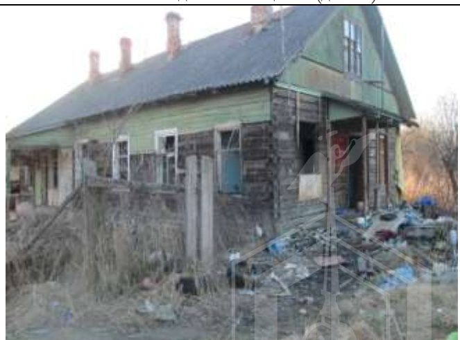
Фото 20. Вид объекта оценки