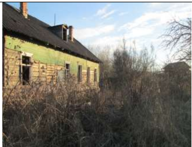
Фото 22. Вид объекта оценки