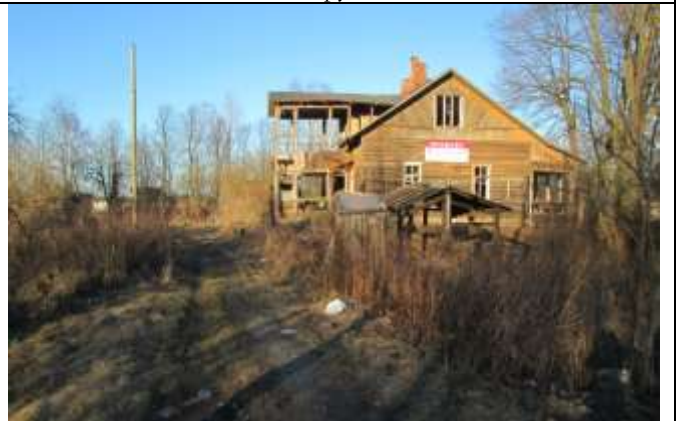
Фото 10. Ближайшее окружение объекта оценки (дом 16)