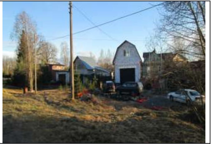
Фото 6. Ближайшее окружение объекта оценки