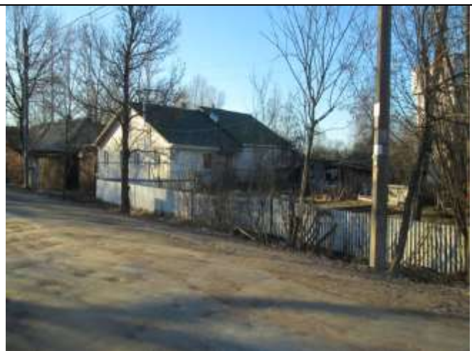
Фото 14. Ближайшее окружение объекта оценки