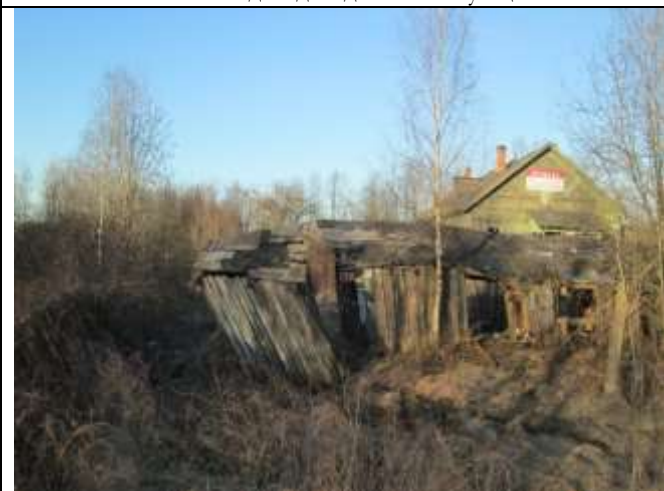
Фото 19. Вид объекта оценки