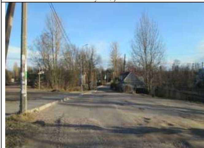
Фото 3. Ближайшее окружение объекта оценки