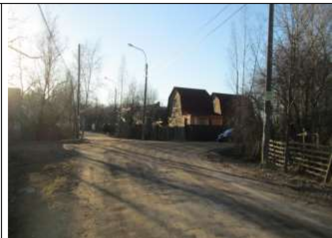
Фото 2. Вид дороги ведущей к объекту оценки (Заводская улица)