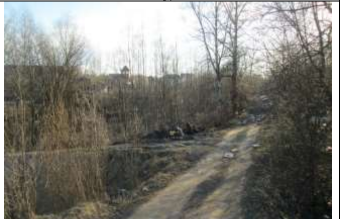
Фото 8. Ближайшее окружение объекта оценки