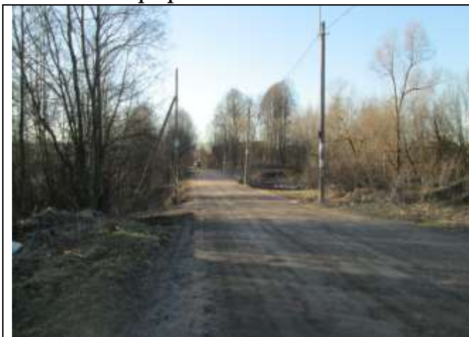
Фото 1. Вид дороги ведущей к объекту оценки (Заводская улица)