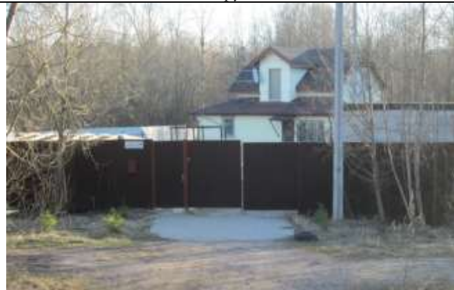
Фото 9. Ближайшее окружение объекта оценки (дом 21)