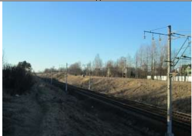
Фото 16. Ближайшее окружение объекта оценки