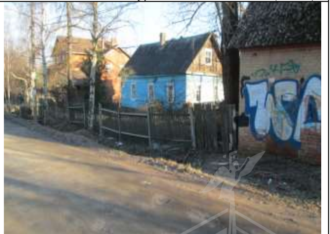
Фото 12. Ближайшее окружение объекта оценки (дом 15)