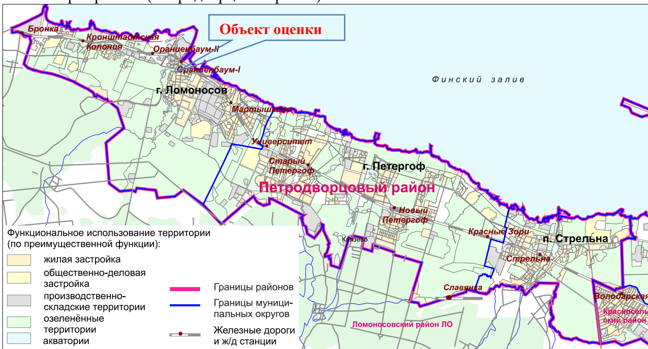
Карта местоположения объекта