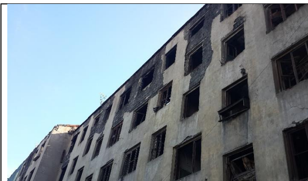
Фото 3. Дворовой фасад здания, в котором расположен Объект оценки