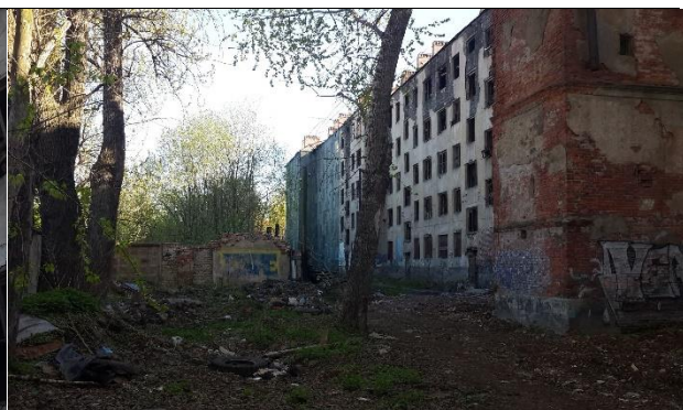
Фото 4. Дворовой фасад здания, в котором расположен Объект оценки