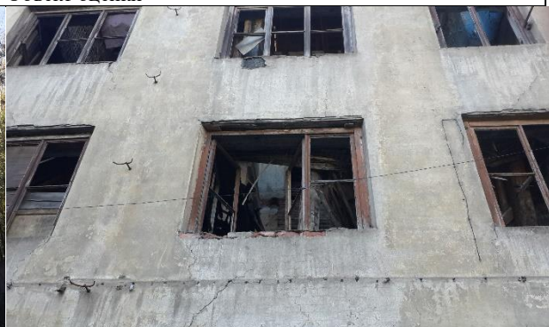
Фото 6. Дворовой фасад здания (в окна видно обрушение перекрытий с пятого по второй этажи)