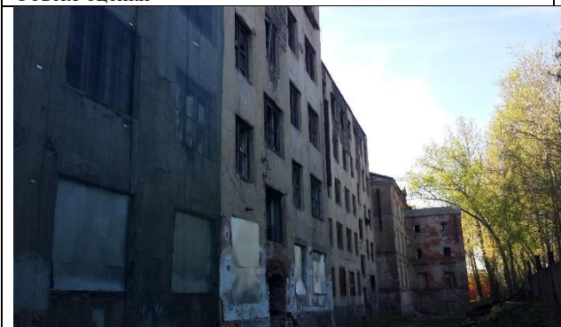
Фото 5. Дворовой фасад здания, в котором расположен Объект оценки