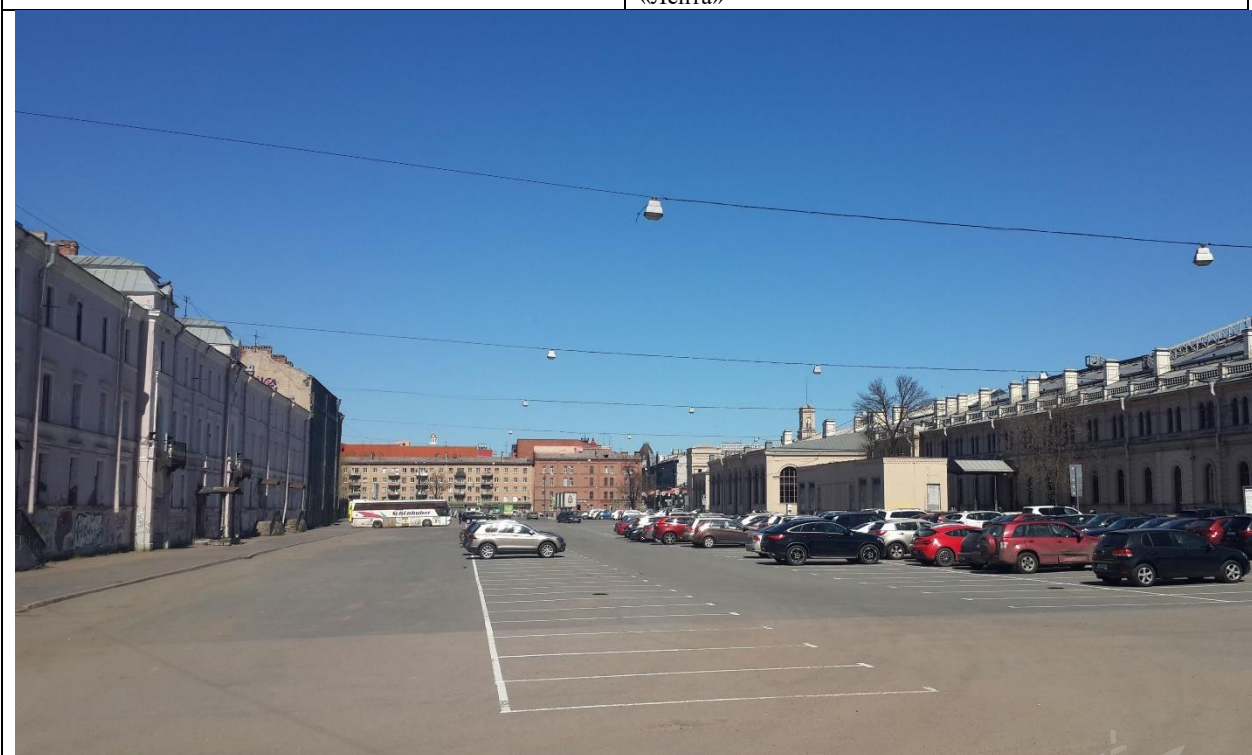
Фото 15. Ближайшее окружение. Варшавская пл. и открытая стоянка ТРК «Варшавский экспресс»