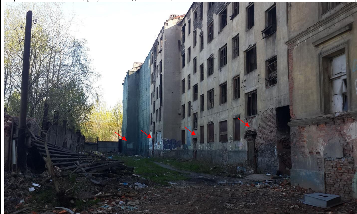
Фото 2. Дворовый фасад здания, в котором расположен Объект оценки. Красными стрелками обозначены входы в подьезды