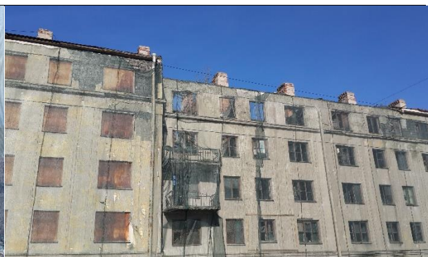
Фото 12. Уличный фасад здания, в котором расположен Объект оценки. Видно обрушение конструкций крыши и кровли