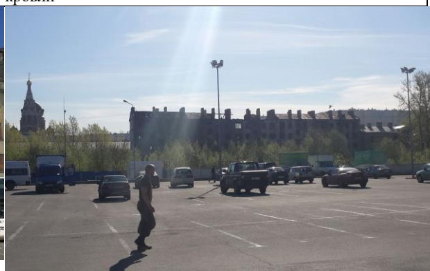
Фото 14. Вид дворового фасада здания, в котором расположен Объект оценки с парковки гипермаркета «Лента»