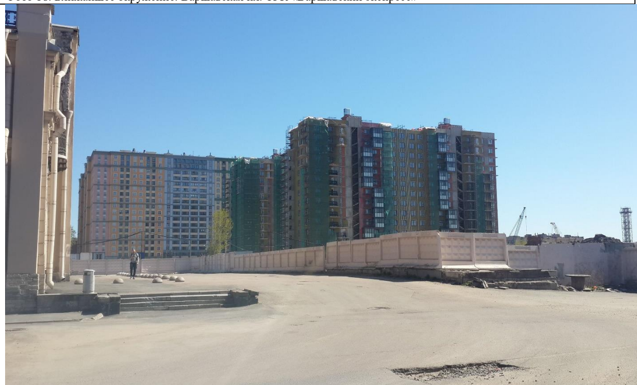
Фото 17. Ближайшее окружение. Застраиваемый Жилой квартал «Галактика» между ул. Парфёновская ул. и Митрофаньевским шос.