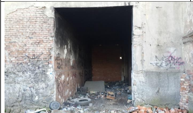
Фото 7. Дворовой фасад здания. Заложенный арочный проезд между литерами А и Б дома 118 по наб. Обводного канала