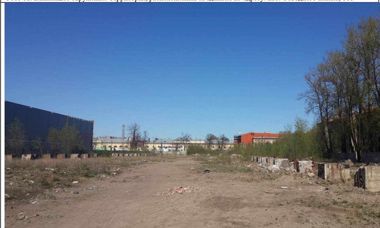
Фото 19. Ближайшее окружение. Территория между зданием по адресу: наб. Обводного канала, 118, лит А и Б и гипермаркетом «Лента», где ранее располагался недостроенный цех №10 Подъемтрансмаша (был демонтирован)