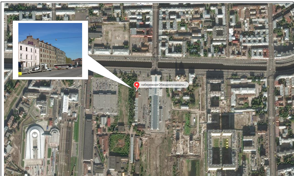
Рис. 3. Локальное местоположение Объекта оценки