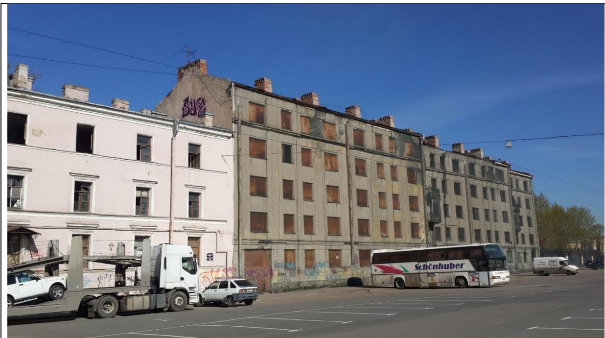
Фото 1. Уличный фасад здания, в котором расположен Объект оценки, выходящий на Варшавскую пл. (слева аварийный жилой дом по адресу: наб. Обводного канала, 1186 лит. А