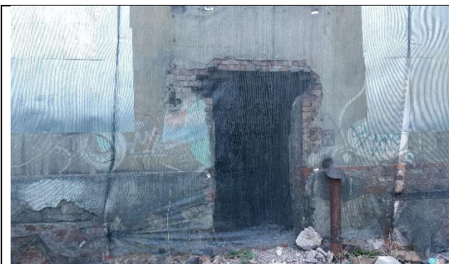
Фото 11. Вид общего входа в Объект оценки со двора