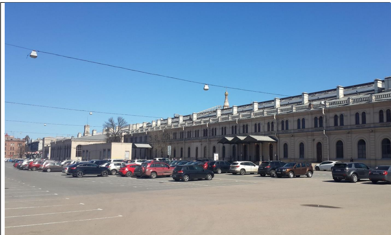
Фото 16. Ближайшее окружение. Варшавская пл. ТРК «Варшавский экспресс»