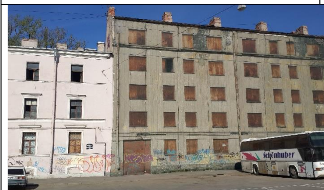
Фото 13. Уличный фасад здания, в котором расположен Объект оценки.