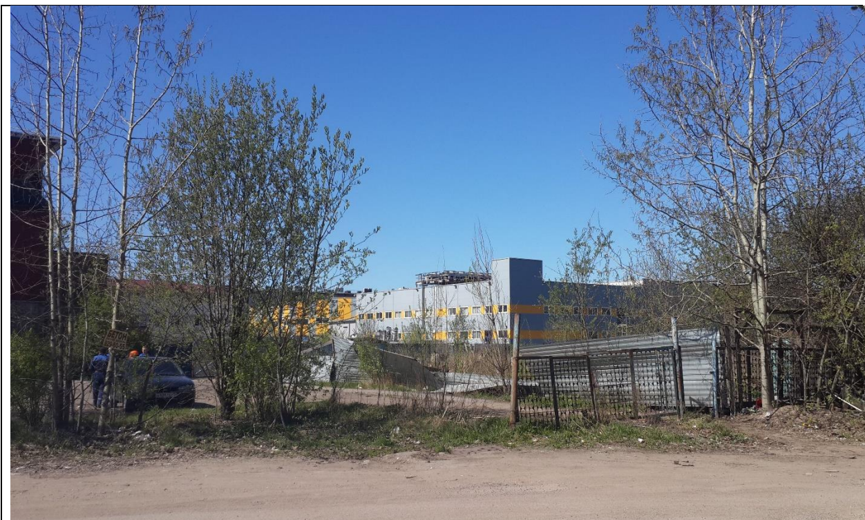
Фото 18. Ближайшее окружение. Территория, расположенная за зданием по адресу: наб. Обводного канала, 118