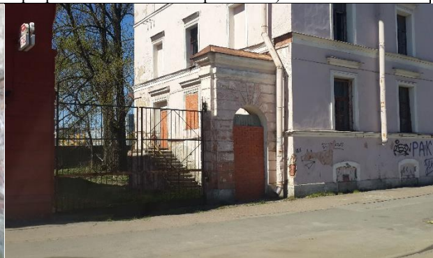
Фото 8. Вход и проезд на территории участка смежного с домом 118б лит. А по наб. Обводного канала с улицы (доступ ограничен)