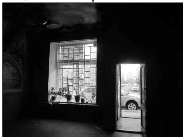
Фото 4. Отдельный вход с улицы и окна – на улицу (вид со стороны помещения)