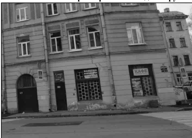
Фото 3. Отдельный вход с улицы и окна – на улицу