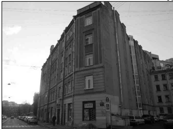
Фото 1. Вид здания, в котором расположен Объект оценки, с улицы

Общий вид здания, в котором расположен Объект оценки, придомовой территории и ближайшего окружения