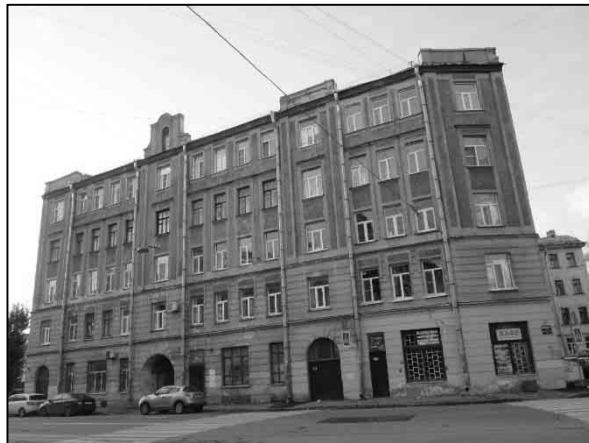
Фото 2. Вид здания, в котором расположен Объект оценки, с улицы, ближайшее окружение