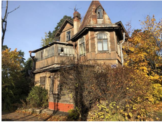
Фото 3. Вид на здание размещения Объекта оценки.