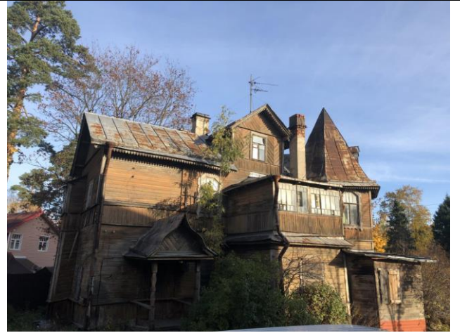
Фото 2. Вид на здание размещения Объекта оценки.