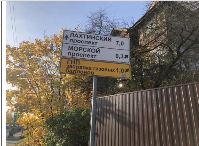
Фото 7. Ближайшее окружение

Описание состояния Объекта оценки составлено исключительно по результатам визуального осмотра. Инженерного обследования строительных конструкций и внутренних инженерных сетей здания не проводилось. Осмотр внутреннего состояния помещений не проводился в виду опасности для жизни.