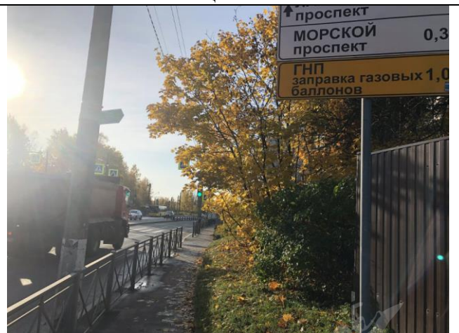
Фото 6. Ближайшее окружение