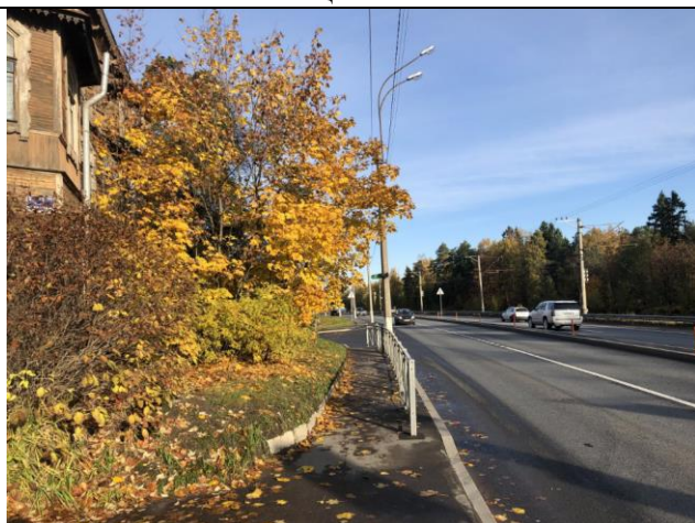
Фото 5. Ближайшее окружение