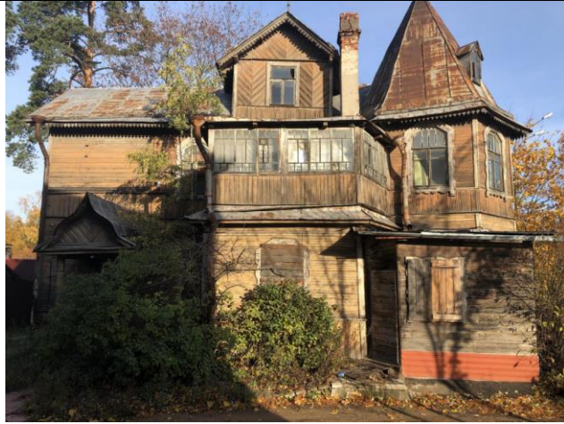
Фото 1. Вид на здание размещения Объекта оценки.