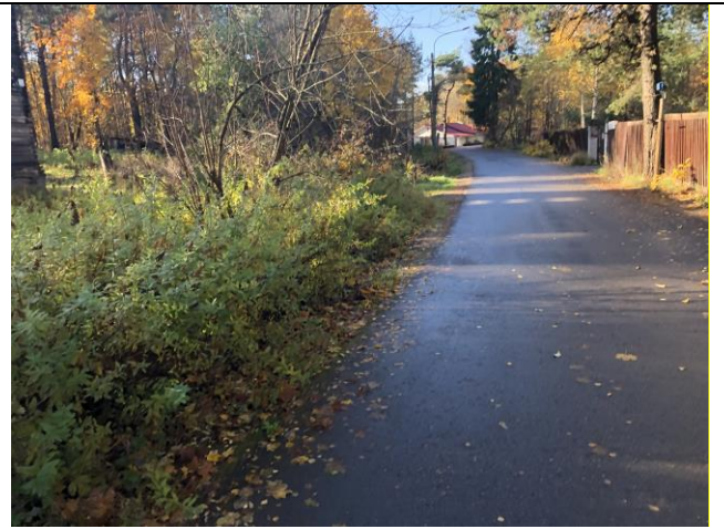
Фото 4. Ближайшее окружение.

Описание состояния Объекта оценки составлено исключительно по результатам визуального осмотра. Инженерного обследования строительных конструкций и внутренних инженерных сетей здания не проводилось. Осмотр внутреннего состояния помещений не проводился в виду опасности для жизни.