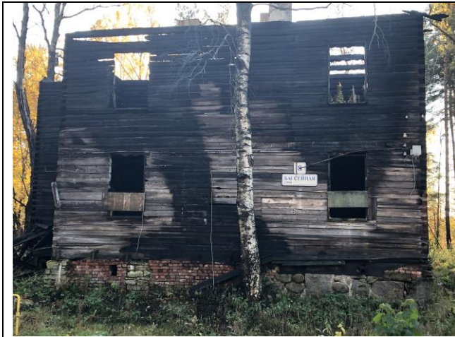
Фото 1. Вид на здание размещения Объекта оценки.