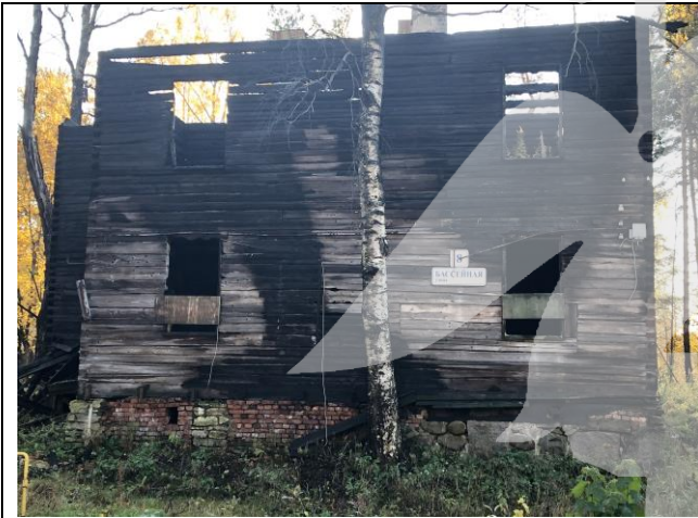
Фото 1. Вид на здание размещения Объекта оценки.