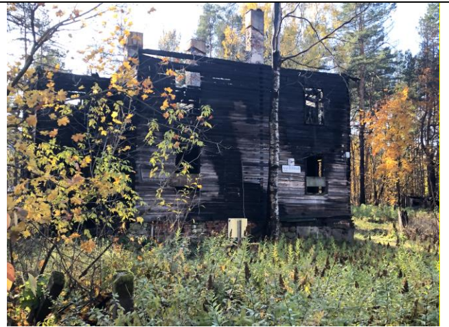
Фото 2. Вид на здание размещения Объекта оценки.