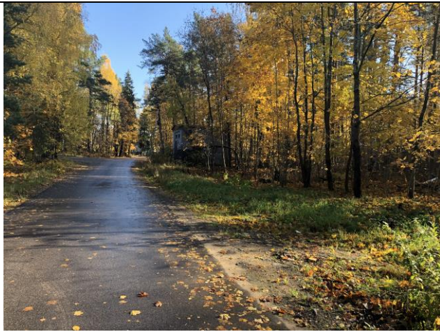
Фото 3. Ближайшее окружение.