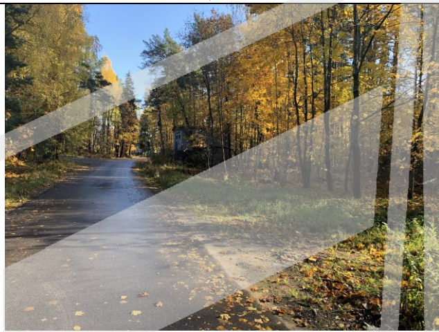
Фото 3. Ближайшее окружение.