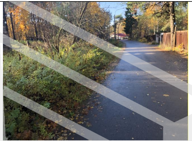
Фото 4. Ближайшее окружение.

Описание состояния Объекта оценки составлено исключительно по результатам визуального осмотра. Инженерного обследования строительных конструкций и внутренних инженерных сетей здания не проводилось. Осмотр внутреннего состояния помещений не проводился в виду опасности для жизни.