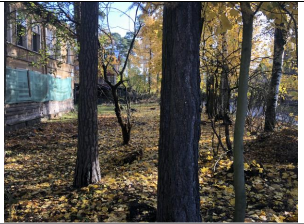
Фото 8. Ближайшее окружение Объекта оценки.