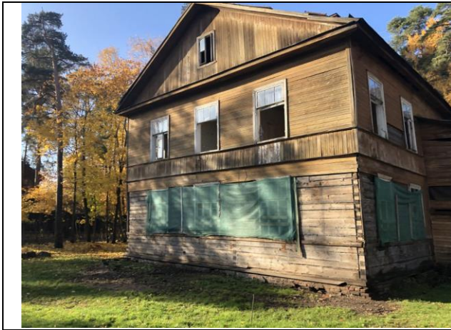
Фото 7. Вид на здание размещения Объекта оценки.