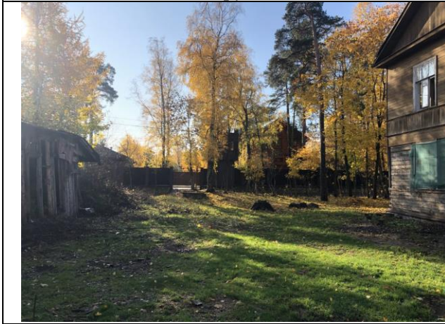
Фото 11. Ближайшее окружение Объекта оценки.

Описание состояния Объекта оценки составлено исключительно по результатам визуального осмотра. Инженерного обследования строительных конструкций и внутренних инженерных сетей здания не проводилось. Осмотр внутреннего состояния помещений не проводился в виду опасности для жизни.