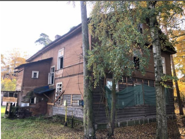
Фото 5. Вид на здание размещения Объекта оценки.