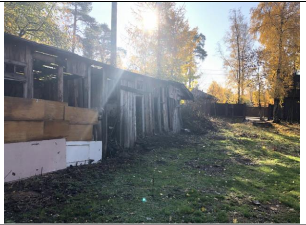
Фото 10. Ближайшее окружение Объекта оценки.