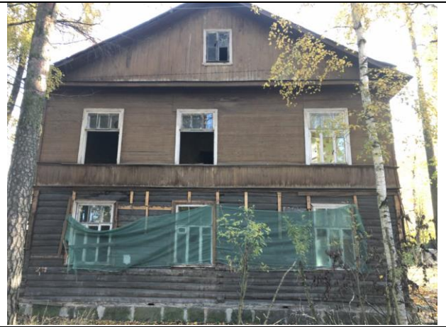
Фото 4. Вид на здание размещения Объекта оценки.