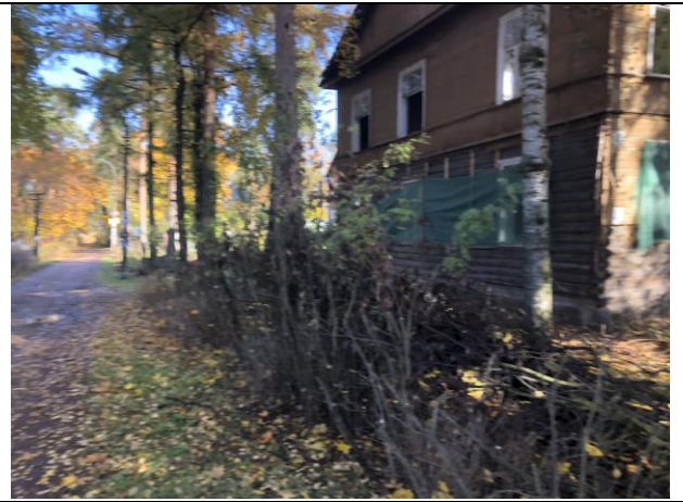
Фото 2. Вид на здание размещения Объекта оценки.