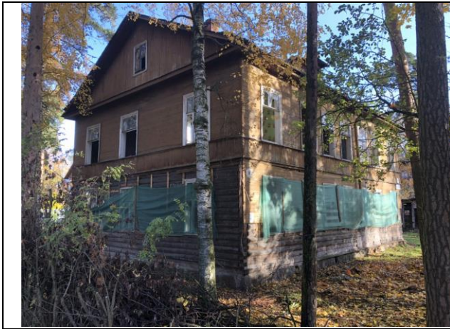
Фото 1. Вид на здание размещения Объекта оценки.