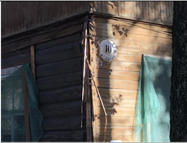
Фото 3. Вид на здание размещения Объекта оценки.