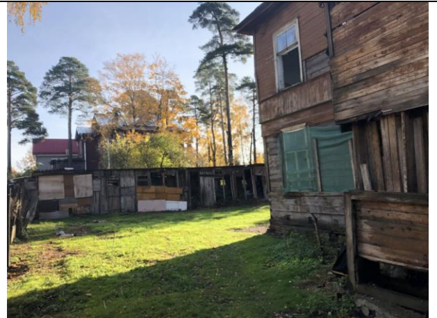
Фото 6. Ближайшее окружение, вид на здание размещения Объекта оценки.