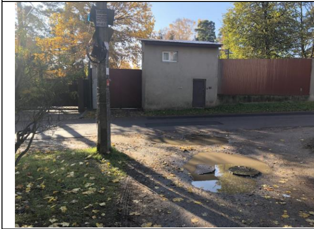
Фото 9. Ближайшее окружение Объекта оценки.