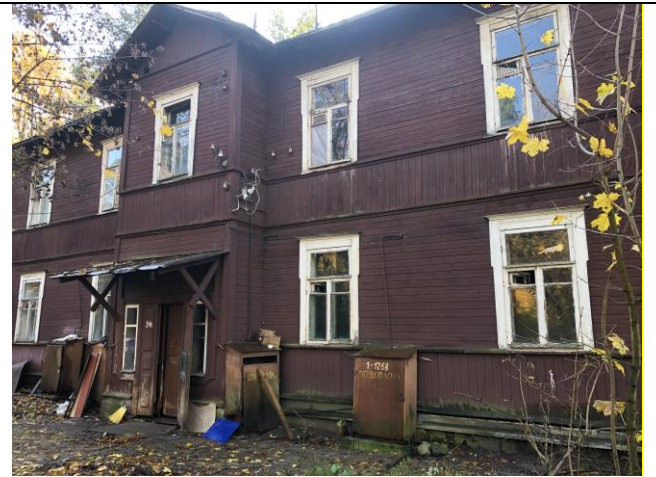
Фото 2. Вид на здание размещения Объекта оценки.