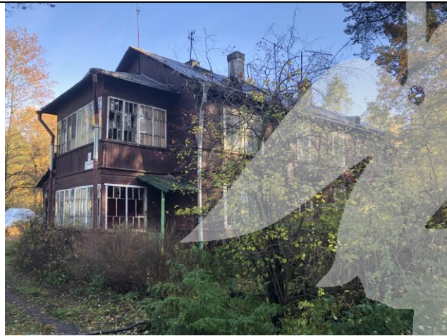
Фото 1. Вид на здание размещения Объекта оценки.