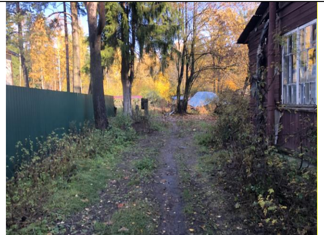
Фото 4. Ближайшее окружение.

Описание состояния Объекта оценки составлено исключительно по результатам визуального осмотра. Инженерного обследования строительных конструкций и внутренних инженерных сетей здания не проводилось. Осмотр внутреннего состояния помещений не проводился в виду опасности для жизни.