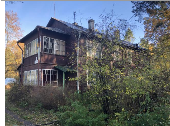
Фото 1. Вид на здание размещения Объекта оценки.