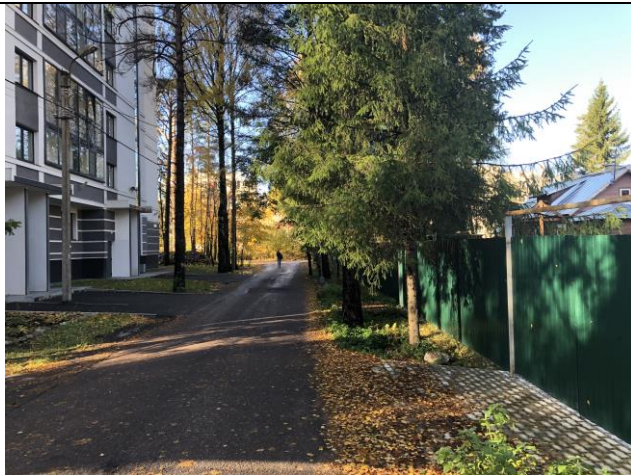
Фото 3. Ближайшее окружение.