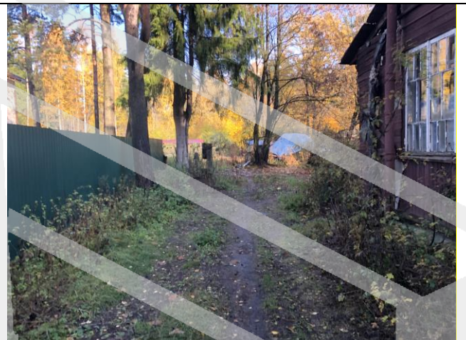
Фото 4. Ближайшее окружение.

Описание состояния Объекта оценки составлено исключительно по результатам визуального осмотра. Инженерного обследования строительных конструкций и внутренних инженерных сетей здания не проводилось. Осмотр внутреннего состояния помещений не проводился в виду опасности для жизни.