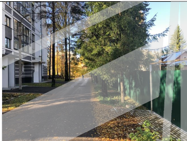
Фото 3. Ближайшее окружение.