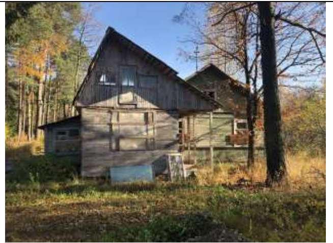
Фото 2. Вид на здание размещения Объекта оценки.