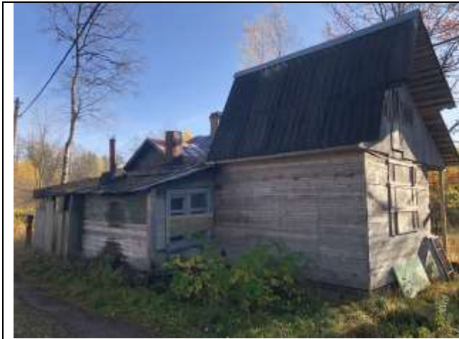
Фото 1. Вид на здание размещения Объекта оценки.