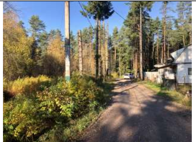
Фото 6. Ближайшее окружение.

Описание состояния Объекта оценки составлено исключительно по результатам визуального осмотра. Инженерного обследования строительных конструкций и внутренних инженерных сетей здания не проводилось. Осмотр внутреннего состояния помещений не проводился в виду опасности для жизни.