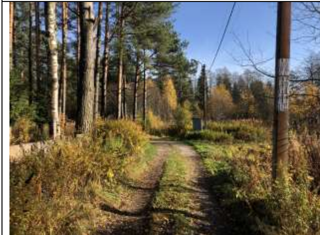
Фото 5. Ближайшее окружение.