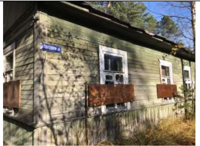
Фото 4. Вид на здание размещения Объекта оценки.