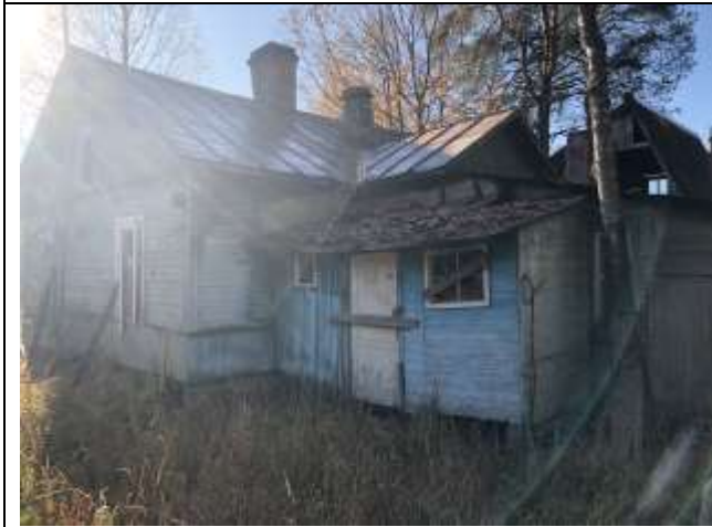
Фото 3. Вид на здание размещения Объекта оценки.