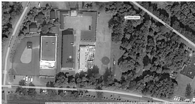
Рисунок 3. Местоположение оцениваемого объекта