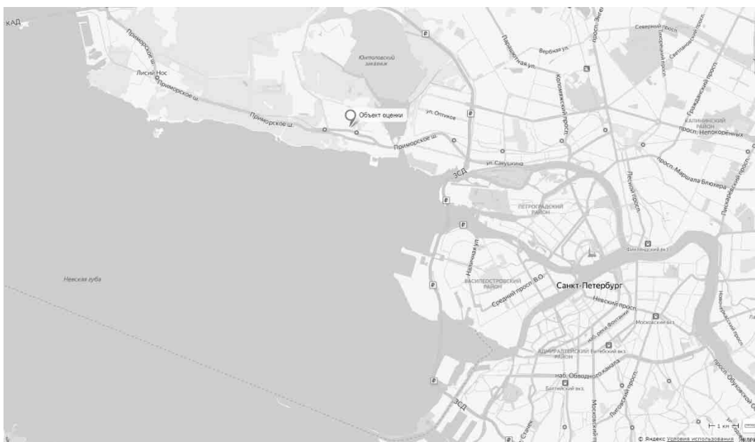
Рисунок 1. Местоположение оцениваемого объекта