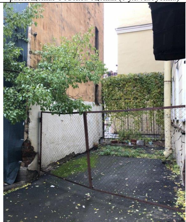
Фото 4. Вид на здание размещения Объекта оценки с торца