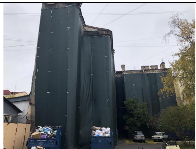
Фото 2. Вид на фасадную часть здания размещения Объекта оценки (с ул. Лабутина)