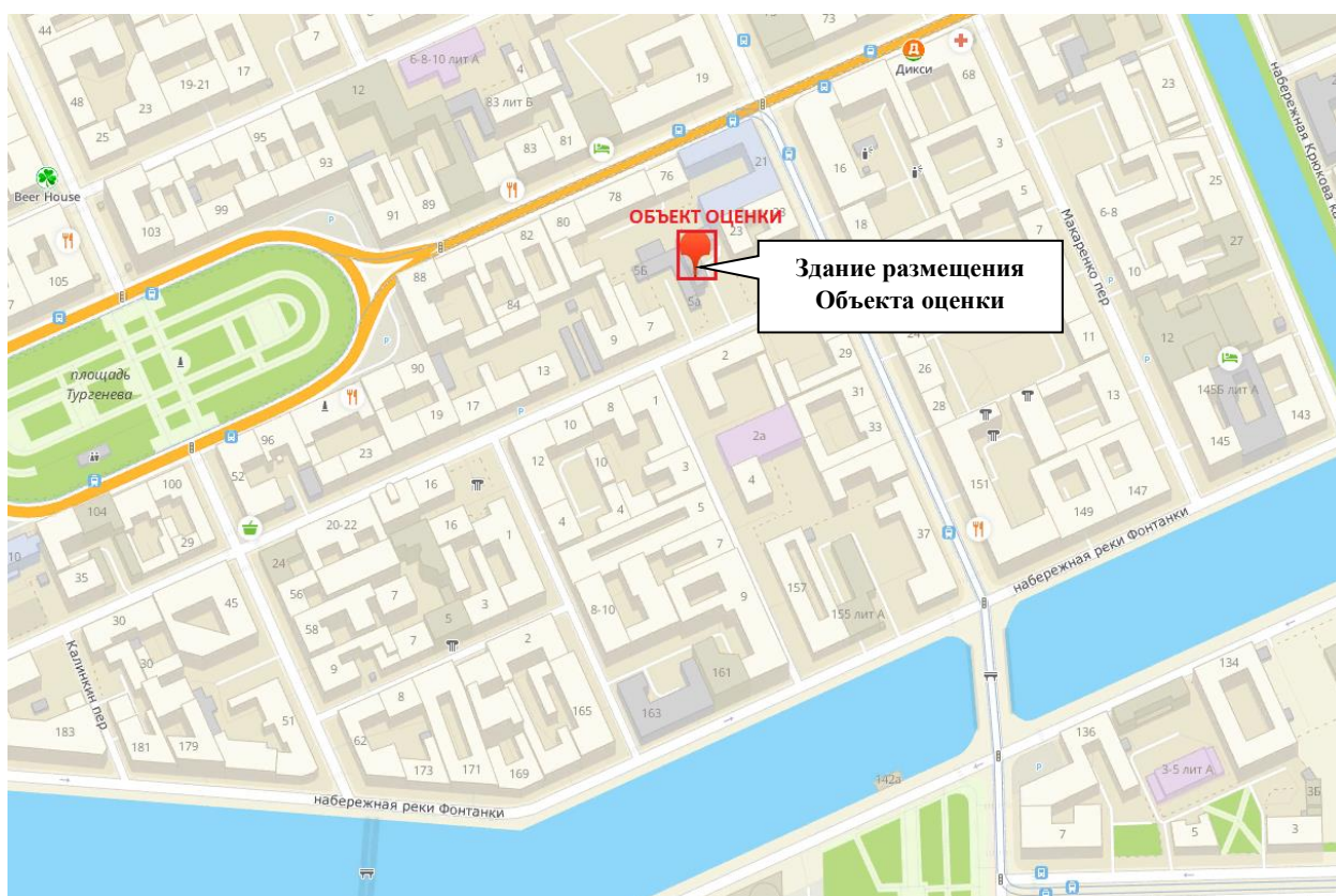
Рисунок 1 - Схема местоположения здания размещения Объекта оценки

Карта местоположения Объект оценки представлена на рис.1.