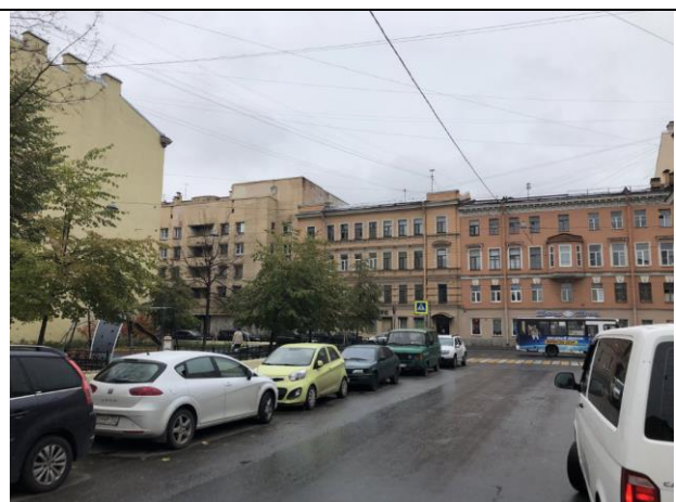
Фото 8. Ближайшее окружение Объекта оценки (ул. Лабутина вид на Лермонтовский пр.)

Все части помещений Объекта оценки находятся в непригодном для использования аварийном здании, требующем проведения реконструкции. Осмотр внутреннего состояния помещений не проводился в виду опасности для жизни.