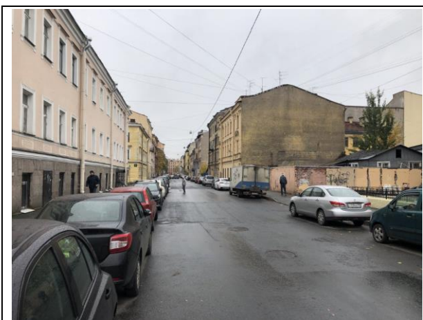
Фото 7. Ближайшее окружение Объекта оценки (ул. Лабутина вид в сторону Климова пер.)