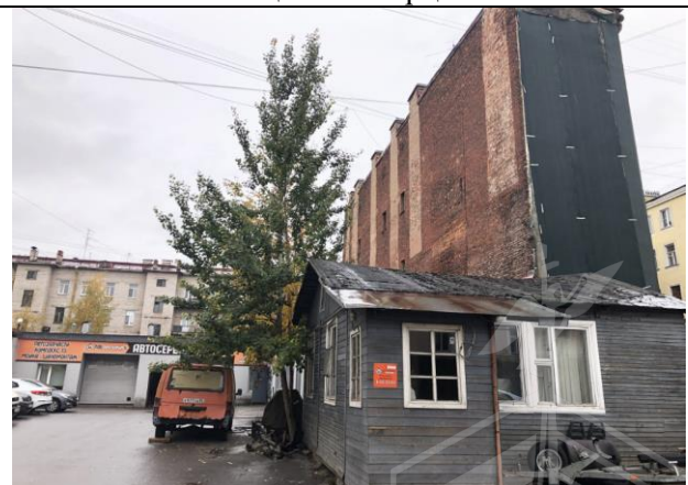
Фото 6. Дворовая территория Объекта оценки