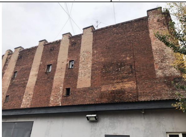
Фото 5. Вид на здание размещения Объекта оценки с дворовой территории