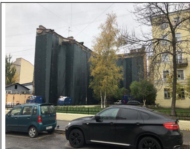
Фото 1. Вид на фасадную часть здания размещения Объекта оценки (с ул. Лабутина)