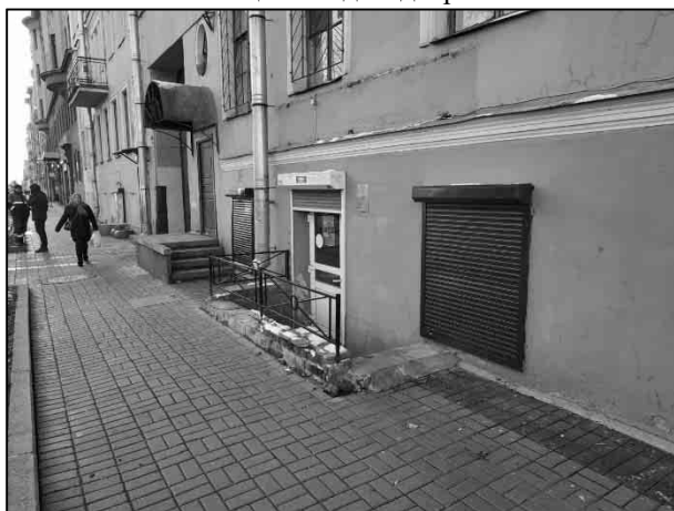
Фото 5. Вид отдельного входа с улицы в Объект оценки, ближайшее окружение