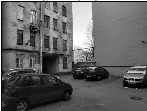
Фото 1. Вид здания, в котором расположен Объект оценки, дворовая территория

Общий вид здания, в котором расположен Объект оценки, придомовой территории и ближайшего окружения; характеристика входной группы в помещение и оконных проемов