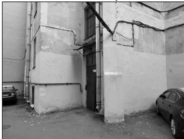
Фото 2. Общий с жилыми помещениями вход в Объект со двора