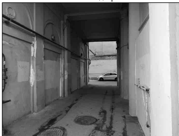
Фото 4. Арка, ведущая во двор дома Объекта оценки