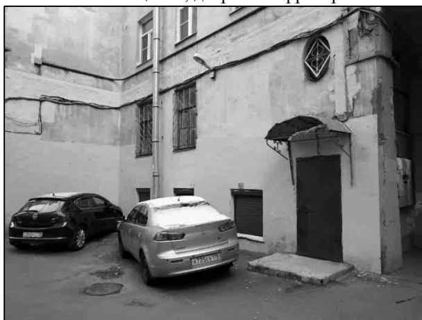
Фото 3. Вид здания, в котором расположен Объект оценки, дворовая территория, общий вход со двора