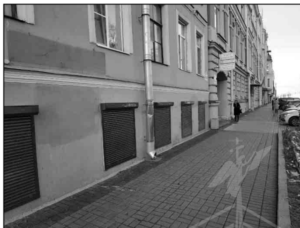
Фото 6. Окна оцениваемого помещения, ориентация – на улицу