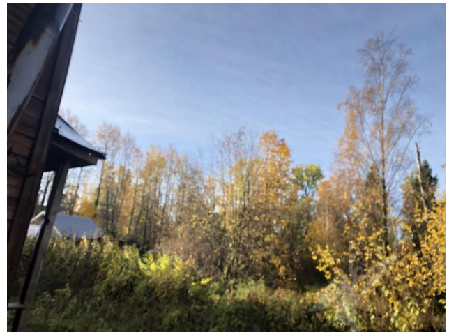
Фото 6. Ближайшее окружение, вид на здание размещения Объекта оценки.