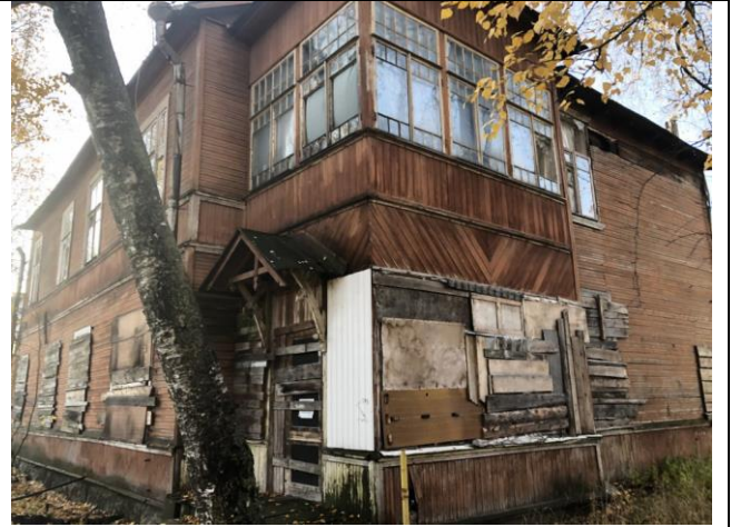
Фото 2. Вид на здание размещения Объекта оценки.