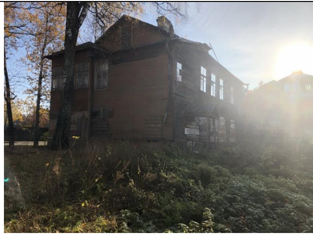
Фото 7. Вид на здание размещения Объекта оценки.

Описание состояния Объекта оценки составлено исключительно по результатам визуального осмотра. Инженерного обследования строительных конструкций и внутренних инженерных сетей здания не проводилось. Осмотр внутреннего состояния помещений не проводился в виду опасности для жизни.