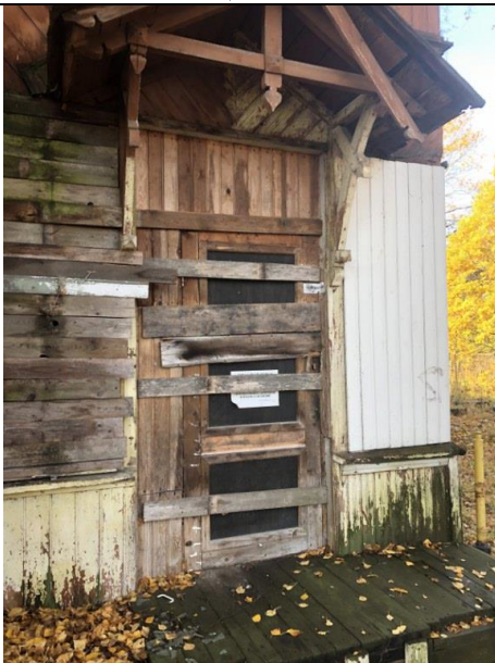
Фото 5. Вид на здание размещения Объекта оценки.