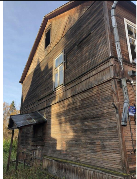
Фото 4. Вид на здание размещения Объекта оценки.