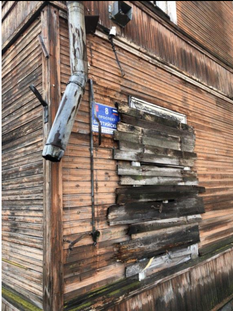
Фото 3. Вид на здание размещения Объекта оценки.