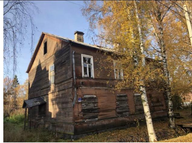
Фото 1. Вид на здание размещения Объекта оценки.