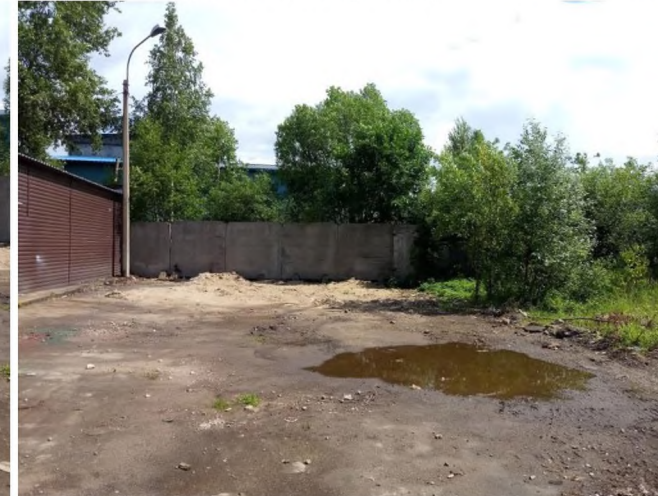
Фото № 5 (грунтовое покрытие)