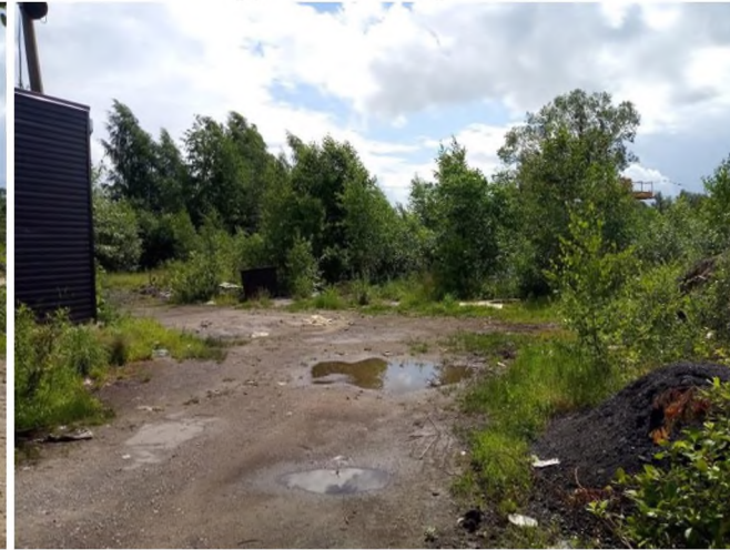
Фото № 2 (древесно-кустарниковая растительность, грунтовое покрытие)