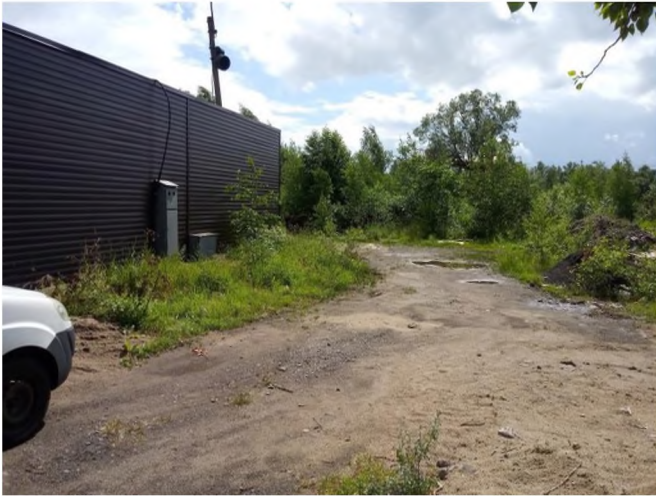
Фото № 1 (грунтовое покрытие)