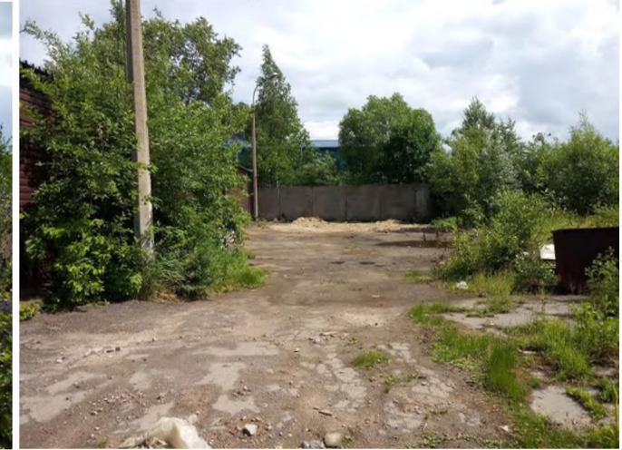
Фото № 3 (древесно-кустарниковая растительность, грунтовое покрытие)