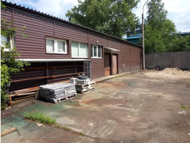
Фото № 4 (грунтовое покрытие)