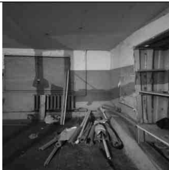
Фото №32 Внутренний вид