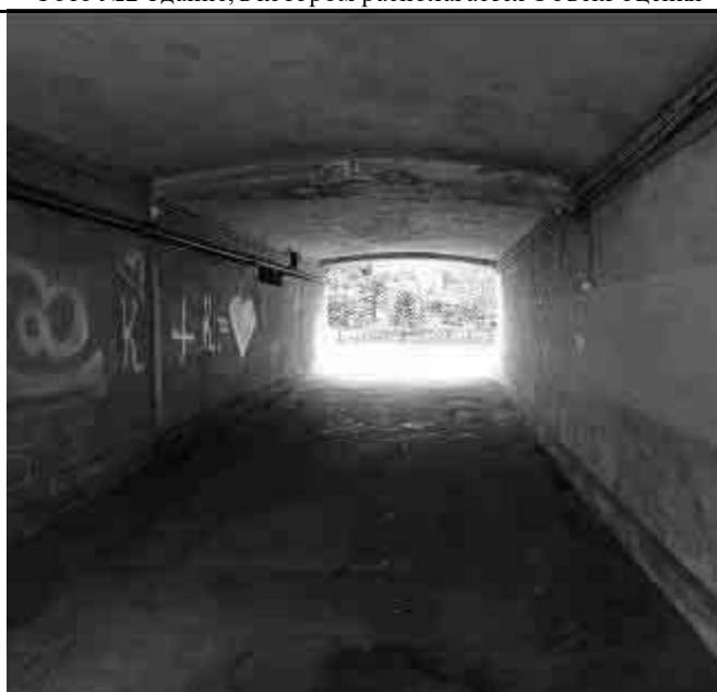
Фото №4. Вход во двор с улицы