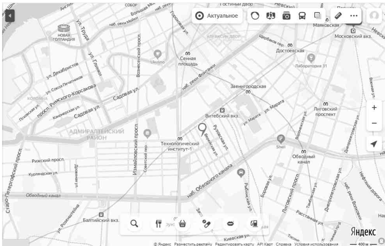
Рисунок 2. Локальное местоположение оцениваемого объекта