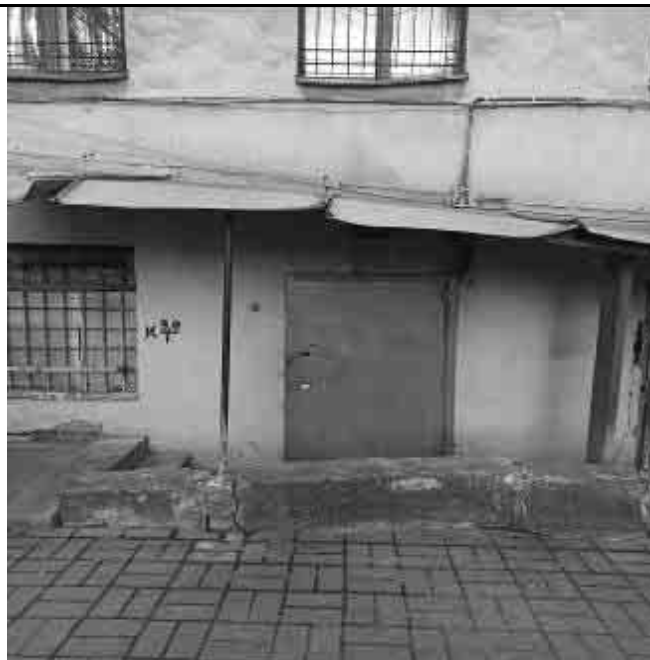
Фото №14 Вход в помещение