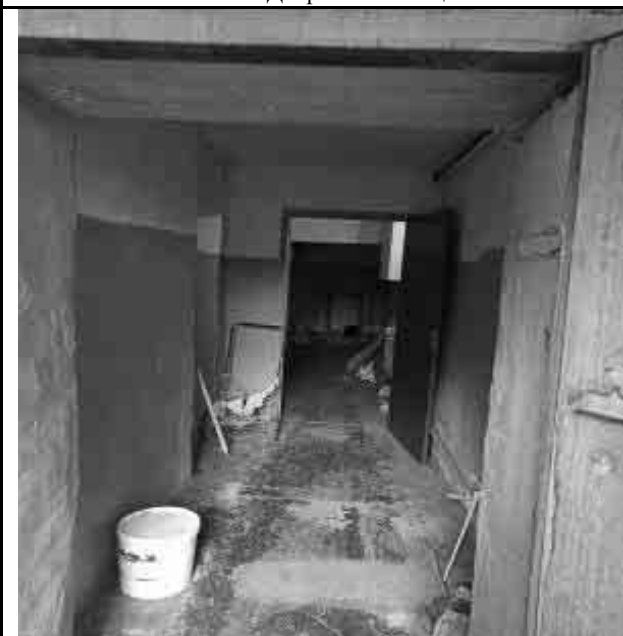
Фото №15 Внутренний вид