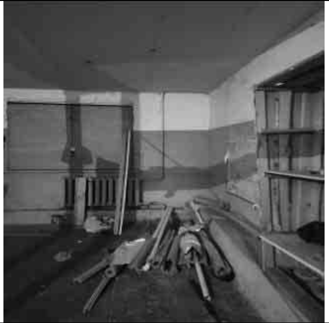
Фото №32 Внутренний вид