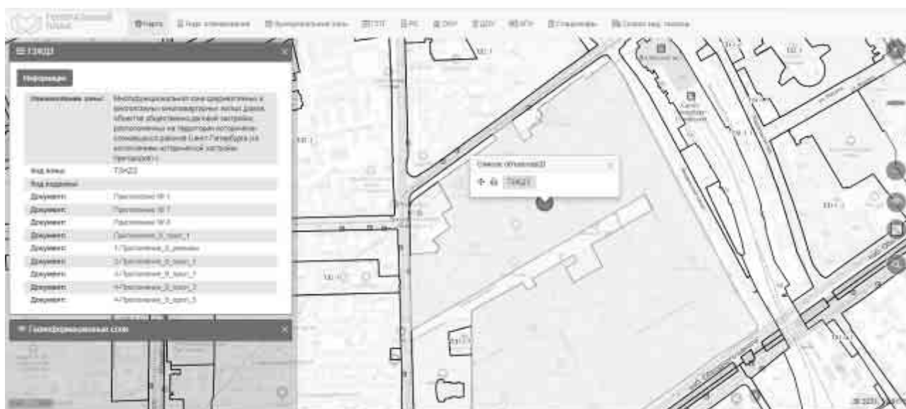
Рисунок 4. Расположение Объекта оценки на карте территориального планирования