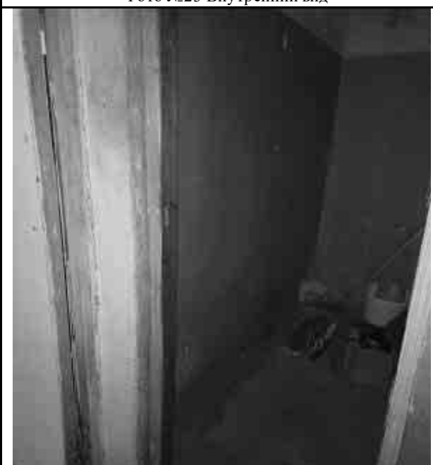
Фото №25 Внутренний вид