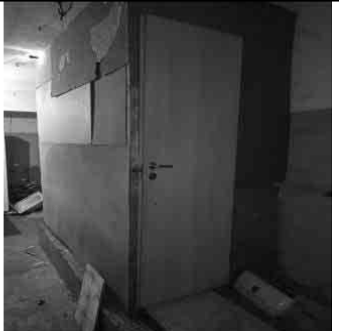
Фото №34 Внутренний вид