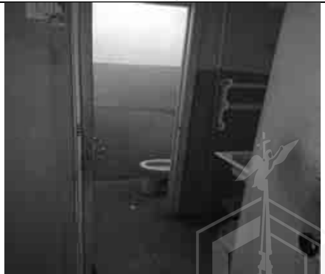
Фото №36 Внутренний вид