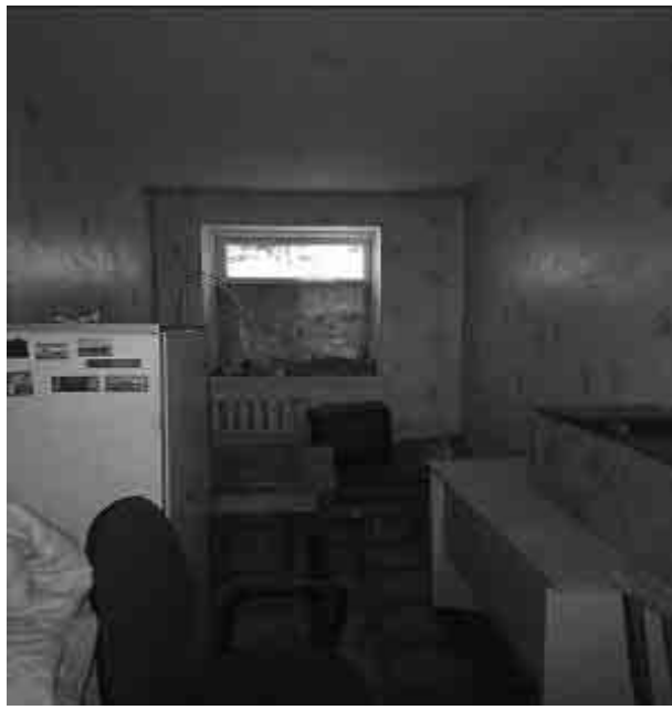
Фото №17 Внутренний вид