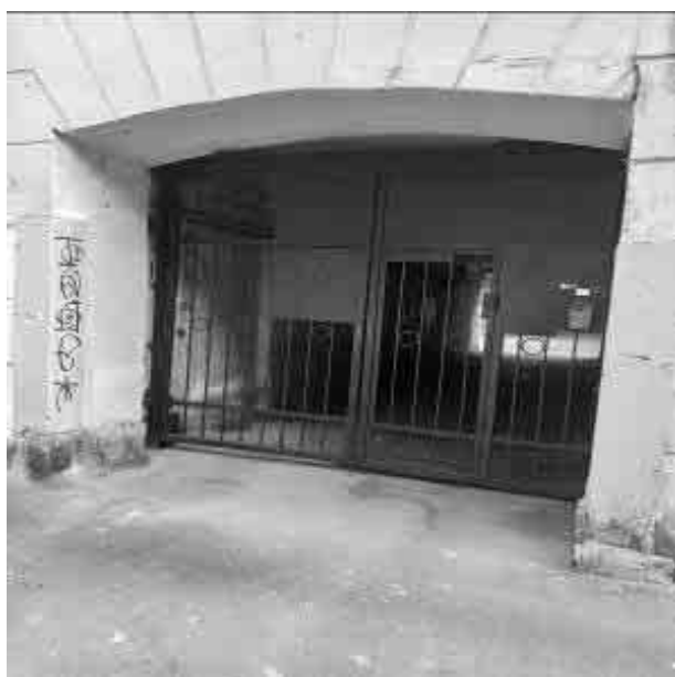
Фото №3 Здание, в котором располагается Объект оценки