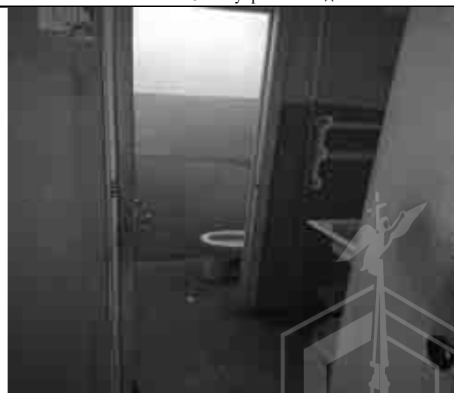
Фото №36 Внутренний вид