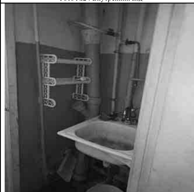
Фото №26 Внутренний вид