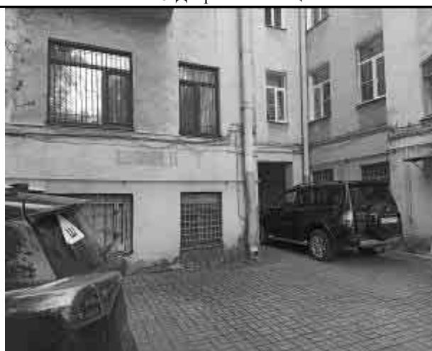
Фото №11 Двор Объекта оценки