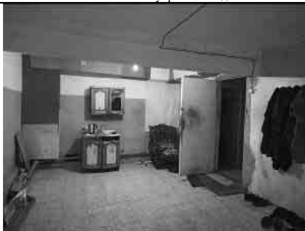
Фото №21. Внутренний вид