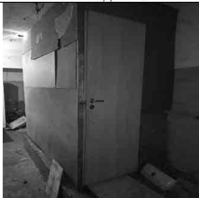
Фото №34 Внутренний вид