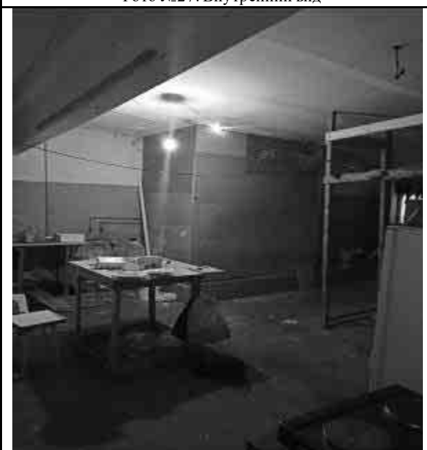
Фото №29 Внутренний вид