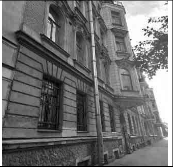
Фото №38 Соседние дома