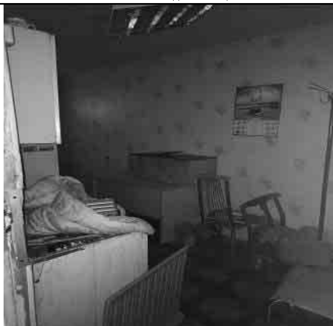
Фото №16 Внутренний вид