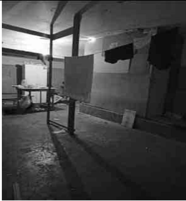
Фото №31 Внутренний вид