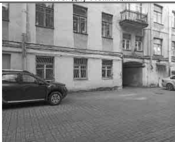
Фото №9 Двор Объекта оценки