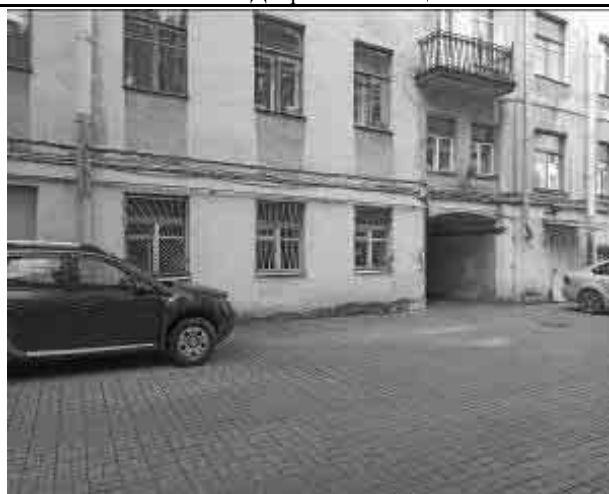
Фото №9 Двор Объекта оценки