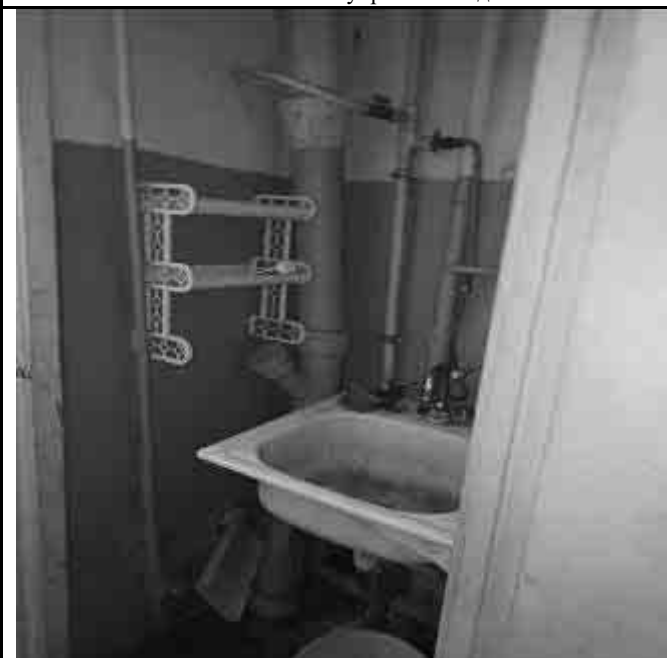
Фото №26 Внутренний вид