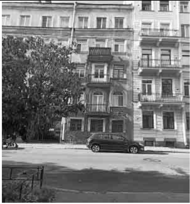
Фото №37 Соседние дома