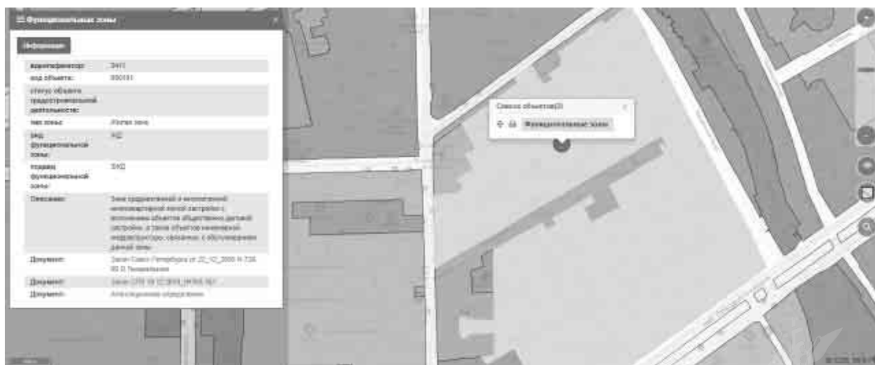
Рисунок 3. Расположение Объекта оценки на карте функционального зонирования

Согласно Закону Санкт-Петербурга от 22.12.2005 №728-99 «О Генеральном плане Санкт-Петербурга» (в ред. Закона Санкт-Петербурга от 19.12.2018 №763-161), объект оценки располагается в зоне «ЗЖД» - зона среднеэтажной и многоэтажной многоквартирной жилой застройки с включением объектов общественно-деловой застройки, а также объектов инженерной инфраструктуры, связанных с обслуживанием данной зоны.