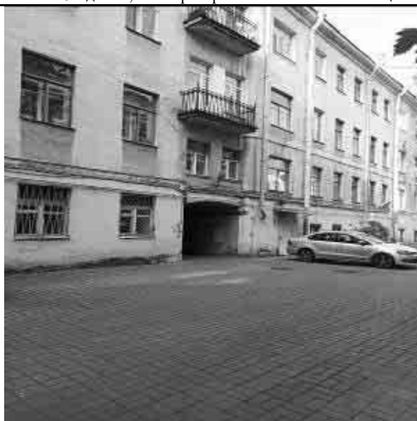
Фото №5 Двор Объекта оценки