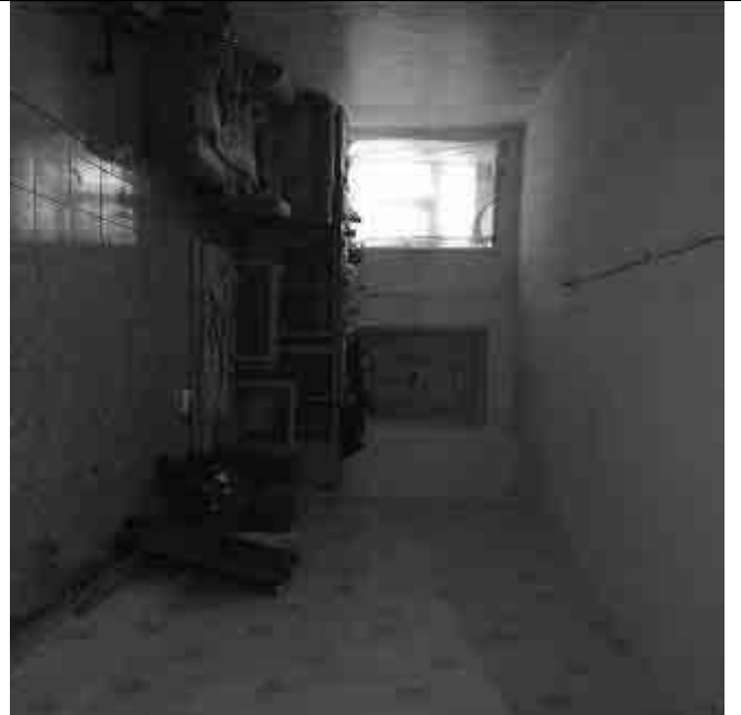
Фото №20 Внутренний вид