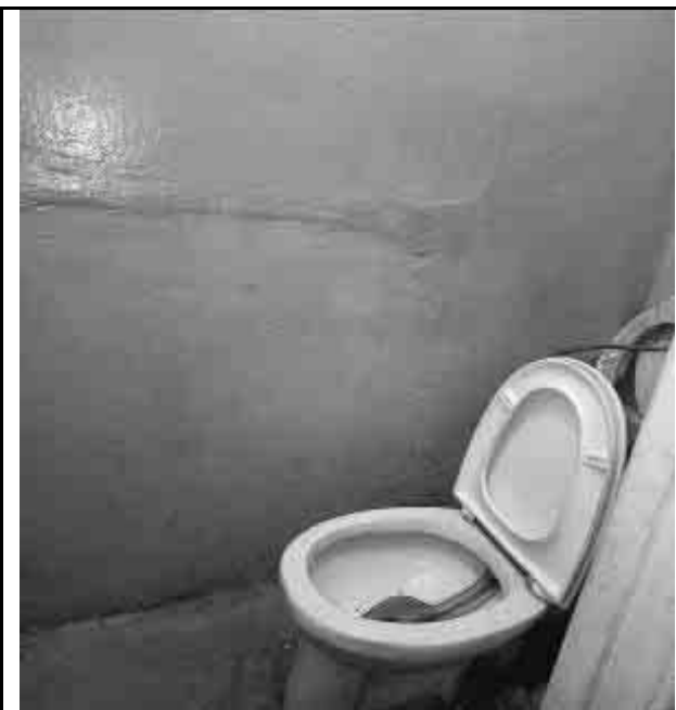
Фото №27. Внутренний вид