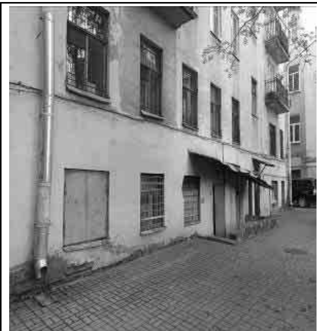
Фото №13 Двор Объекта оценки