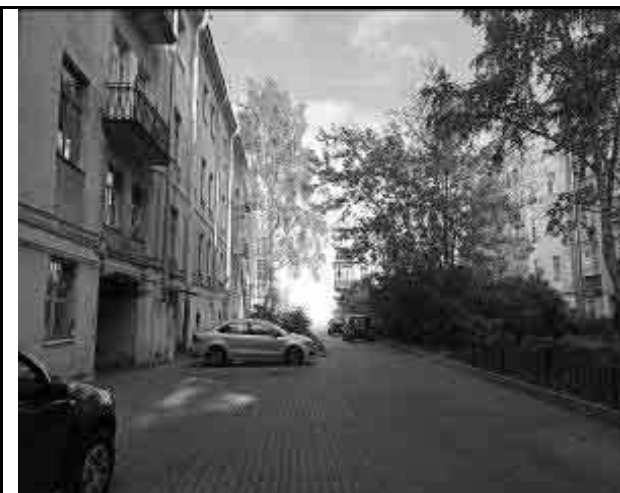
Фото №7. Двор Объекта оценки