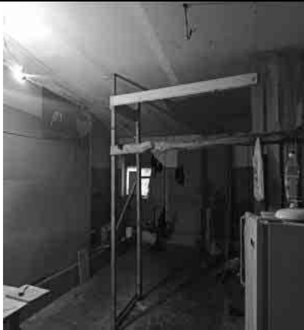
Фото №33 Внутренний вид