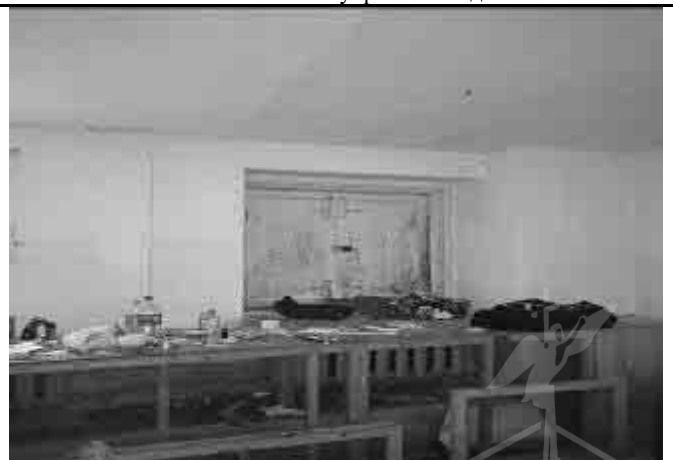
Фото №22 Внутренний вид