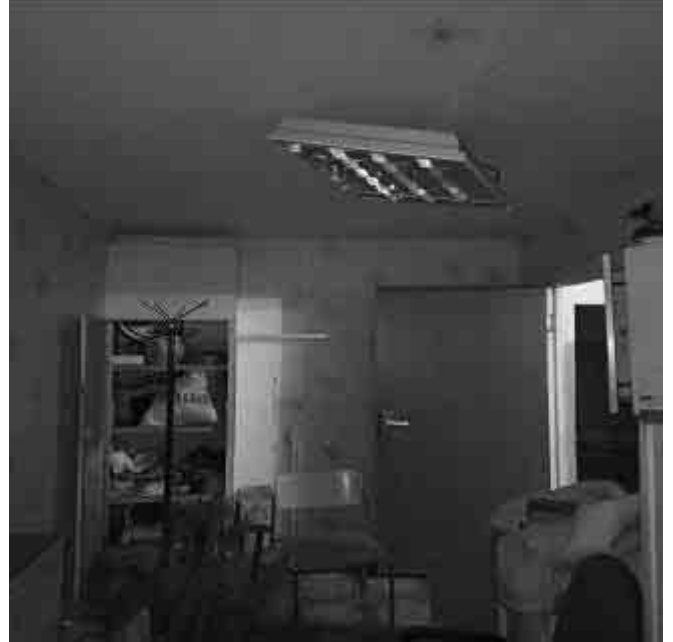
Фото №18 Внутренний вид