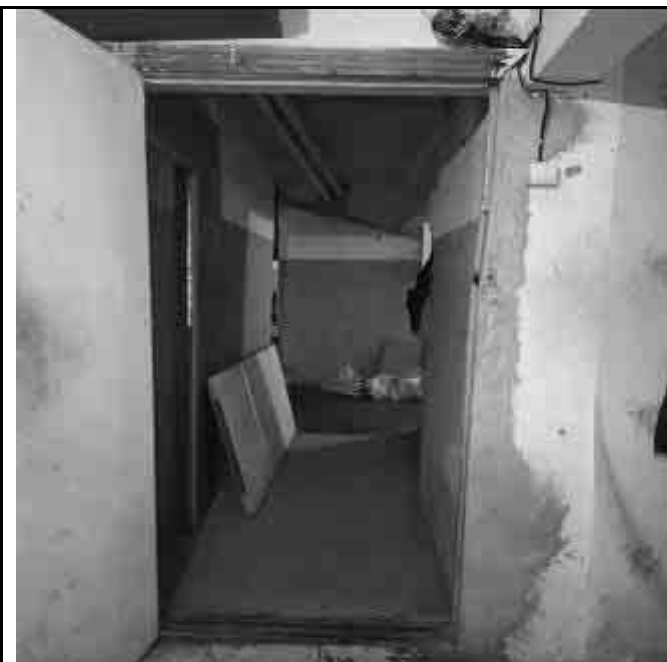
Фото №24 Внутренний вид