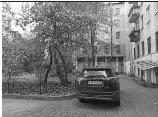
Фото №8 Двор Объекта оценки