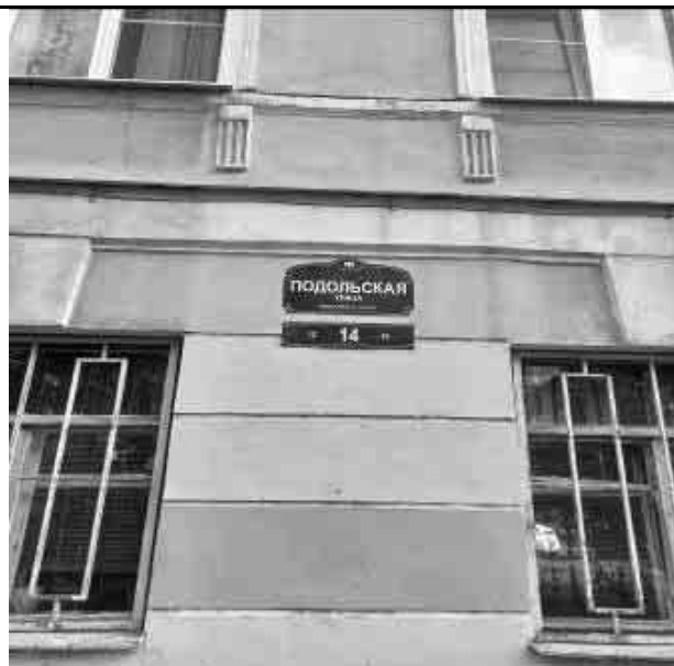
Фото №2 Здание, в котором располагается Объект оценки