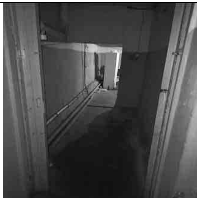
Фото №28. Входы в помещение