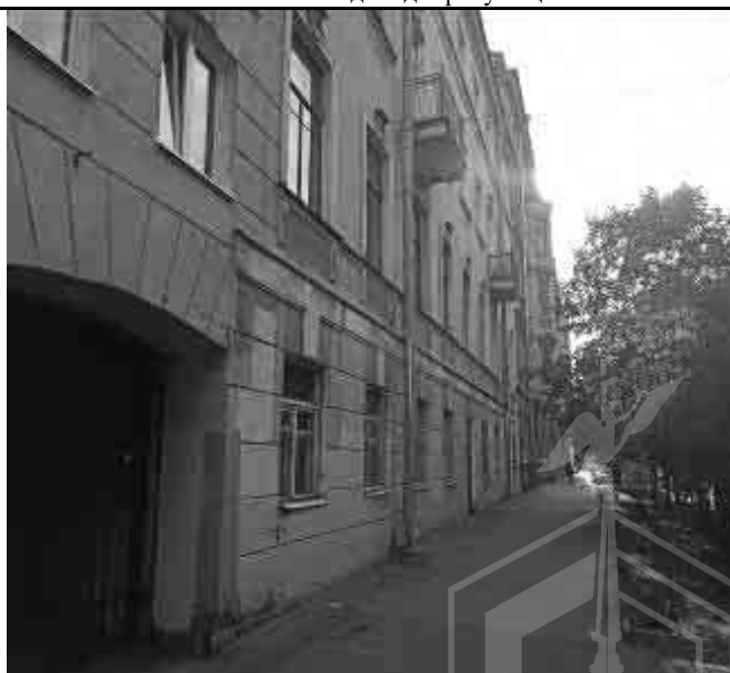
Фото №6. Двор Объекта оценки