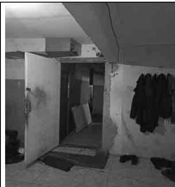
Фото №23 Внутренний вид