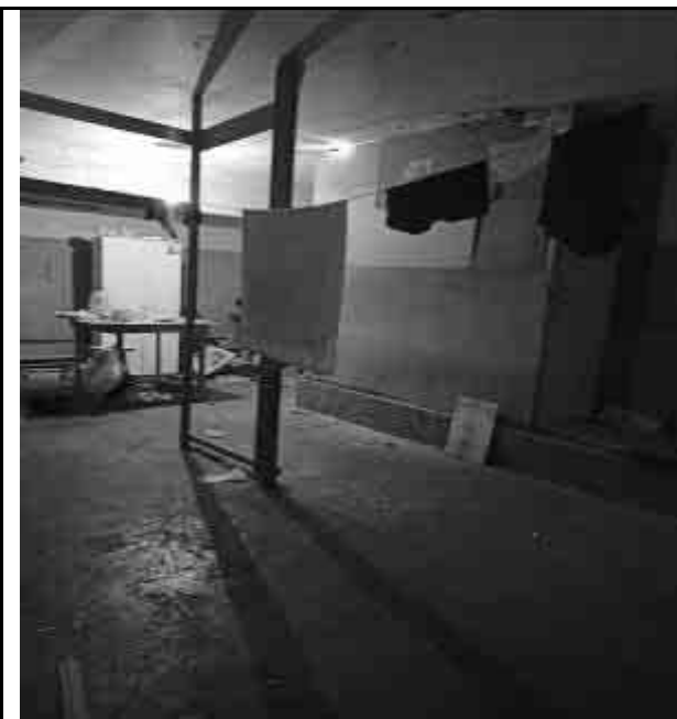
Фото №31 Внутренний вид