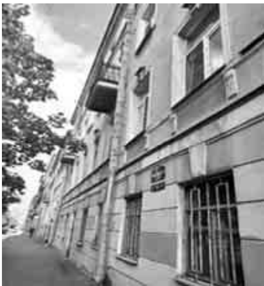
Фото №1 Здание, в котором располагается Объект оценки