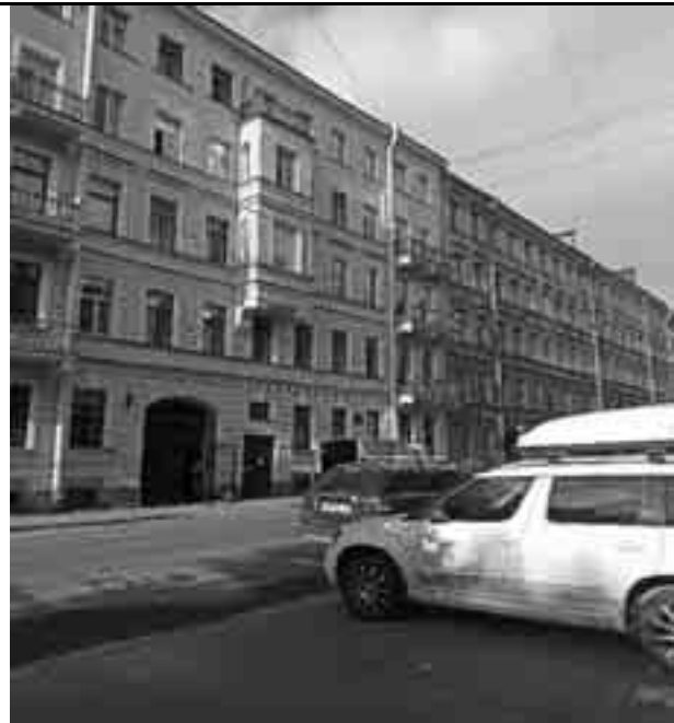
Фото №39 Соседние дома