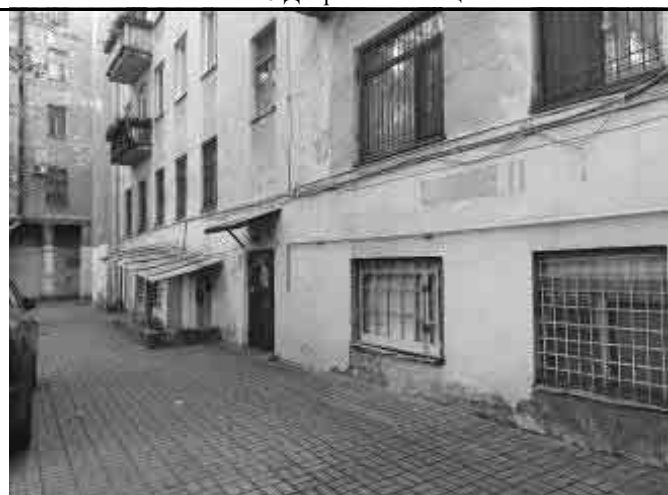
Фото №12 Двор Объекта оценки