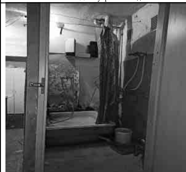
Фото №35 Внутренний вид