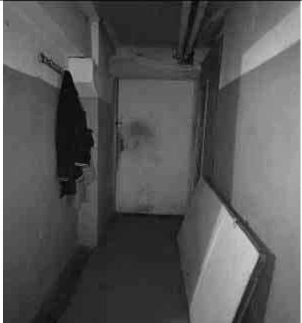
Фото №19 Внутренний вид