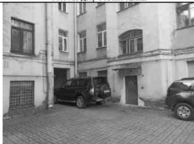
Фото №10 Двор Объекта оценки