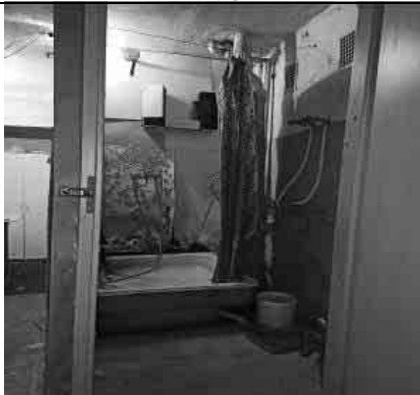
Фото №35 Внутренний вид