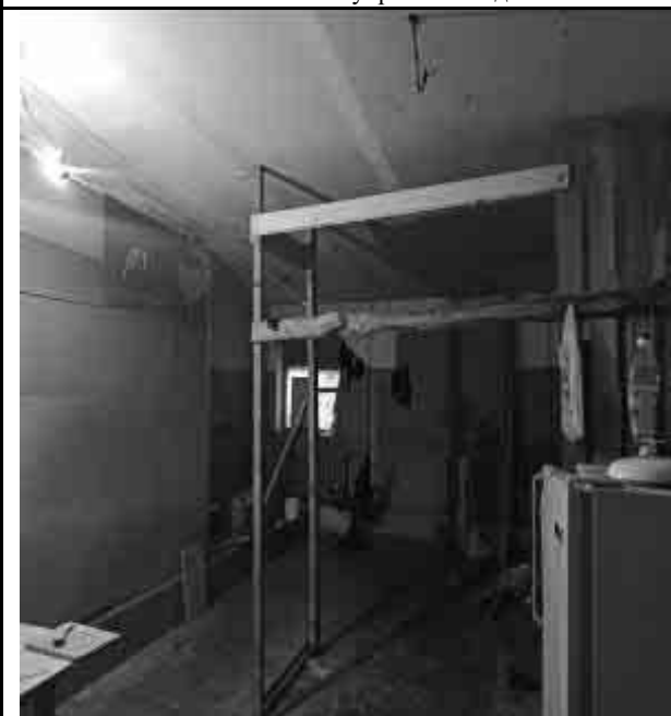
Фото №33 Внутренний вид