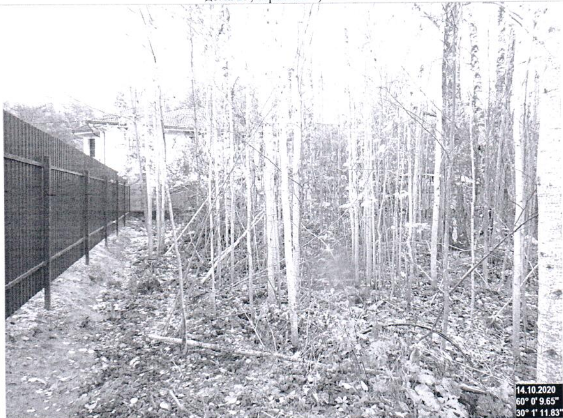
Описание: Вид на Участок. Фото 8