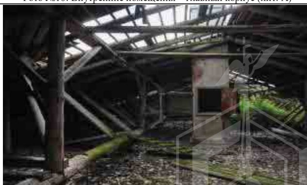
Фото №12: Вид крыши – главный корпус (лит. А)