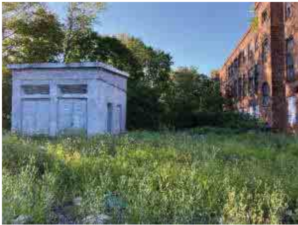
2. Санкт-Петербург, г. Красное Село, ул. Свободы, дом 54, литера Б: