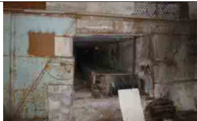
Фото №4: Внутренние помещения – главный корпус (лит. А)