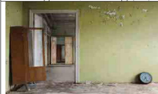
Фото №7: Внутренние помещения – главный корпус (лит. А)