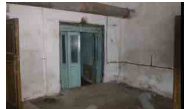
Фото №1: Внутренние помещения – главный корпус

- http://krasnosel.com/2-news/4071-ni-pukha-ni-pera?_cf_chl_jschl_tk_=1ca9a4782573b18dcee6d712d939f952e38046d4-1581495973-0-Aa7FHw4qx464vIryMe09bpAmfgF3VewfgJbQsPYTSPg_L_VLF97hjO8FrNRBOLzKVJ0qslifTDksSwQfMc-h9SMedlgyhyZMSZEqxzY-lwZlZqzmWMy58wCOwHdYR_nFCfoBwkg3oRmFhWK7nq-stfxJepTgxCCPEPh5qbI97sCb7fASjiKZyLYB6SWsapodA5dKo1ujA3g14KxIWNprUEgBK5s1aeFUcq8Pun_LJD8YOYTU1sPlzL7B3Tz4O29BPojJzJe4Jc1b-bOvEKKQbL35Ywk5UpjWK9osAlaEJqvp-9cEUBvgHGFPPhbb7xnZ2Ng