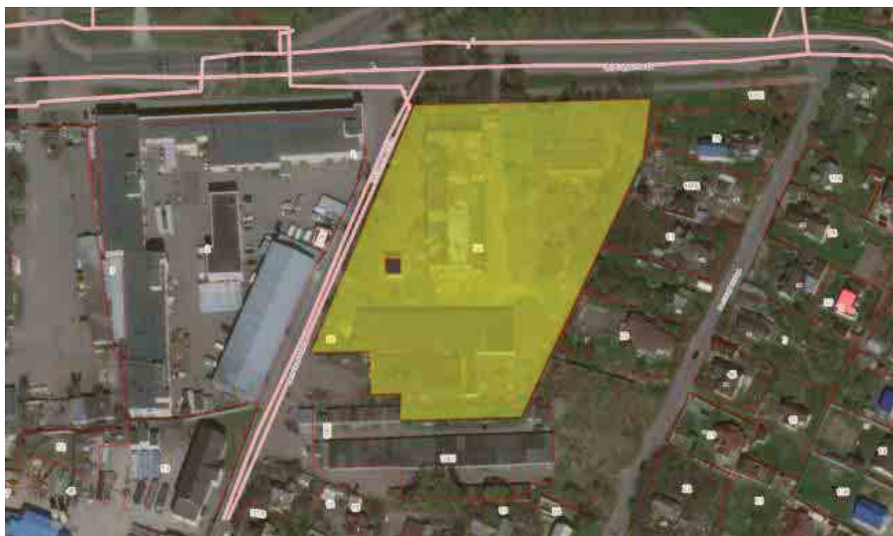
Рисунок 3. Местоположение оцениваемого объекта на карте г. Красное Село. Вид со спутника.