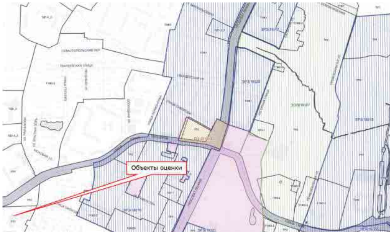
Рисунок 3. Объекты на карте ПЗЗ г. Санкт-Петербурга