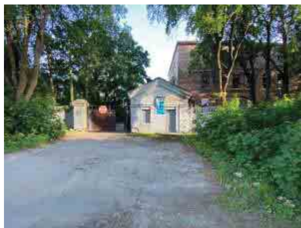
5. Санкт-Петербург, г. Красное Село, ул. Свободы, дом 54, литера Ж: