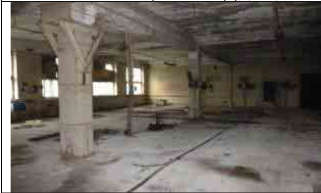
Фото №5: Внутренние помещения – главный корпус (лит. А)