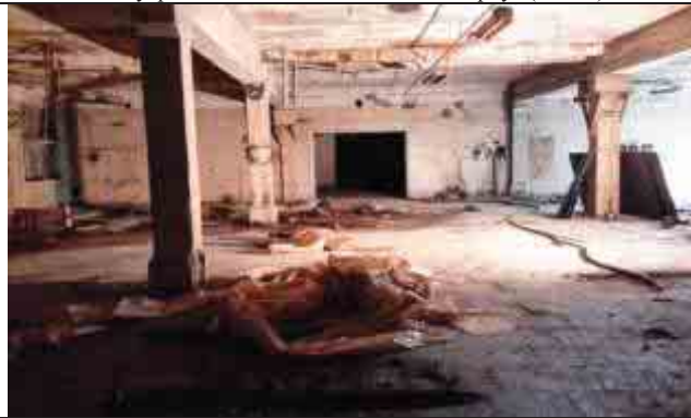
Фото №6: Внутренние помещения – главный корпус (лит. А)