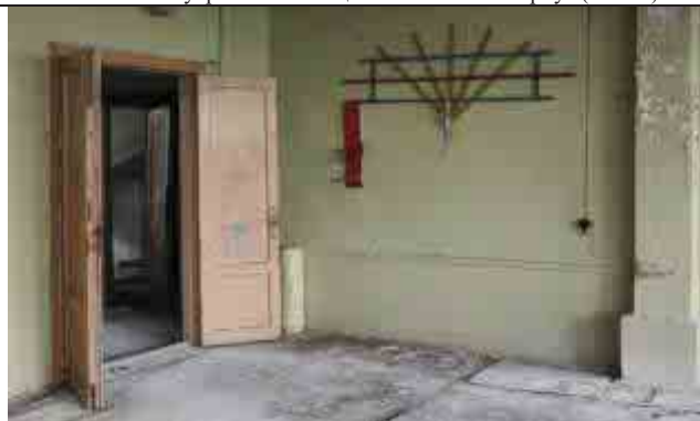
Фото №8: Внутренние помещения – главный корпус (лит. А)