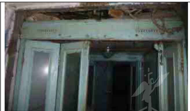
Фото №2: Вид лифта