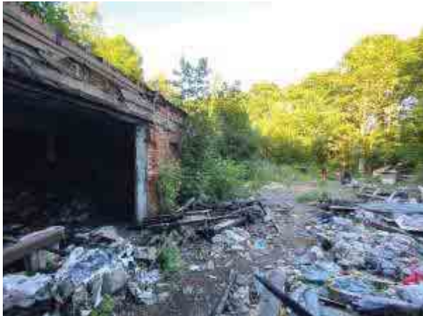
3. Санкт-Петербург, г. Красное Село, ул. Свободы, дом 54, литера В: