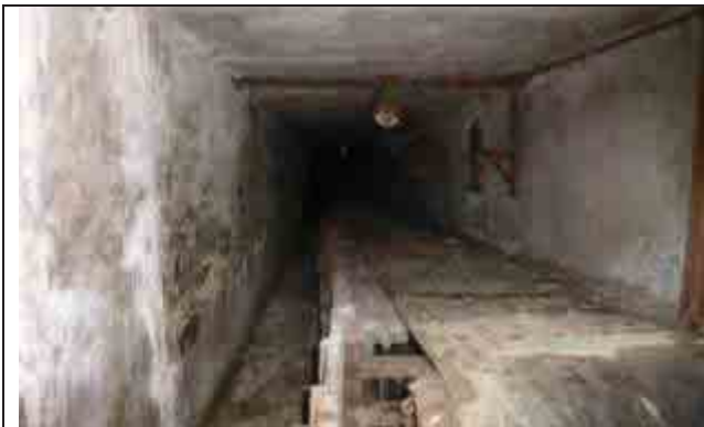
Фото №3: Вид конвейера – главный корпус (лит. А)