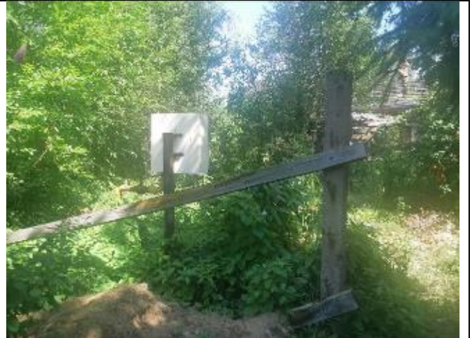
Фото 2. Вид на оцениваемый земельный участок и жилой дом в составе Объекта оценки