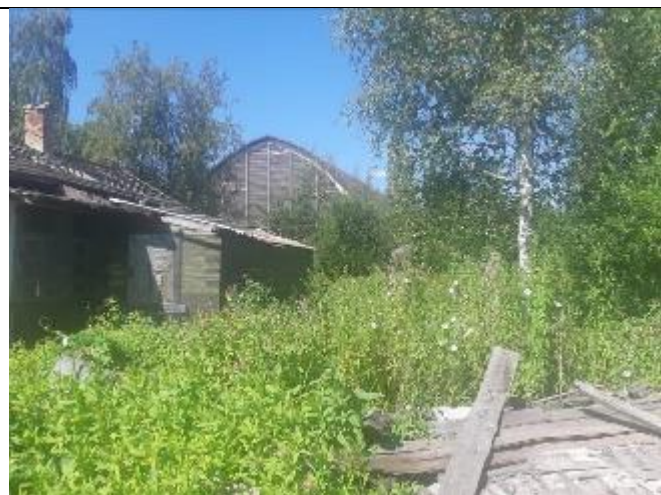
Фото 14. Вид на оцениваемый земельный участок и жилой дом в составе Объекта оценки