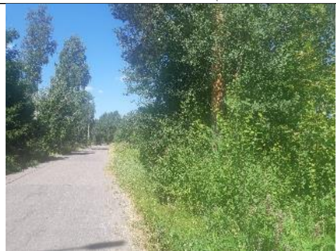
Фото 18. Вид на Госпитальную улицу.