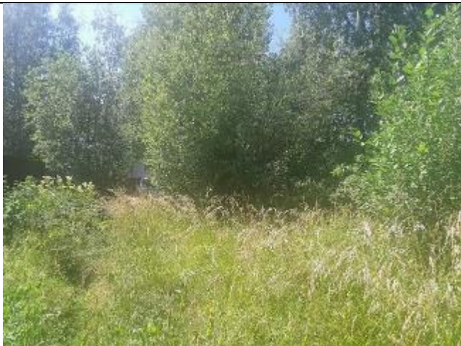
Фото 11. Оцениваемый земельный участок в составе Объекта оценки