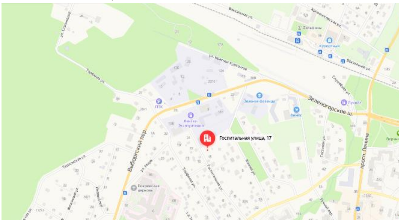
Рисунок 1. Местоположение оцениваемого объекта