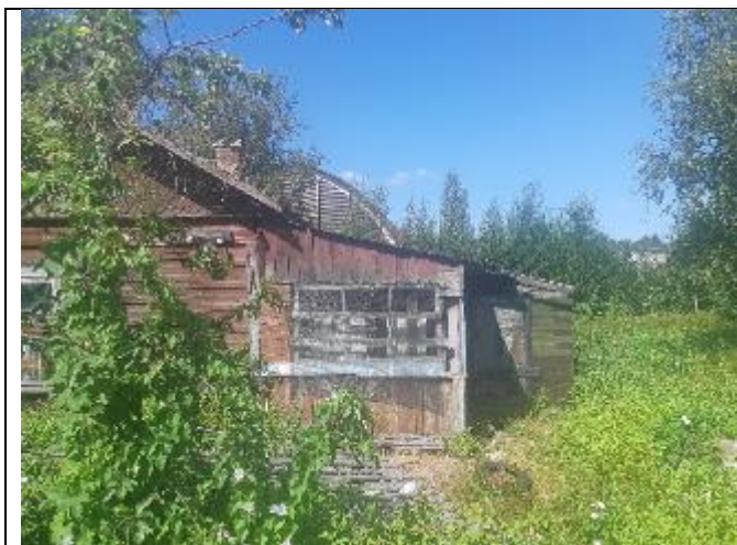
Фото 13. Вид на оцениваемый земельный участок и жилой дом в составе Объекта оценки