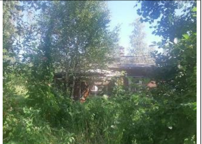
Фото 4. Вид на оцениваемый земельный участок и жилой дом в составе Объекта оценки