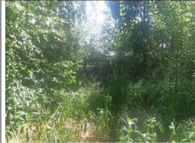
Фото 3. Вид на оцениваемый земельный участок и жилой дом в составе Объекта оценки