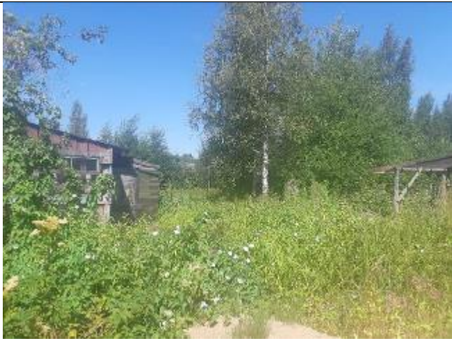
Фото 9. Вид на оцениваемый земельный участок и жилой дом в составе Объекта оценки