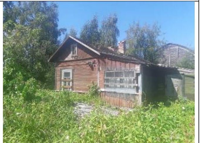
Фото 12. Вид на оцениваемый земельный участок и жилой дом в составе Объекта оценки