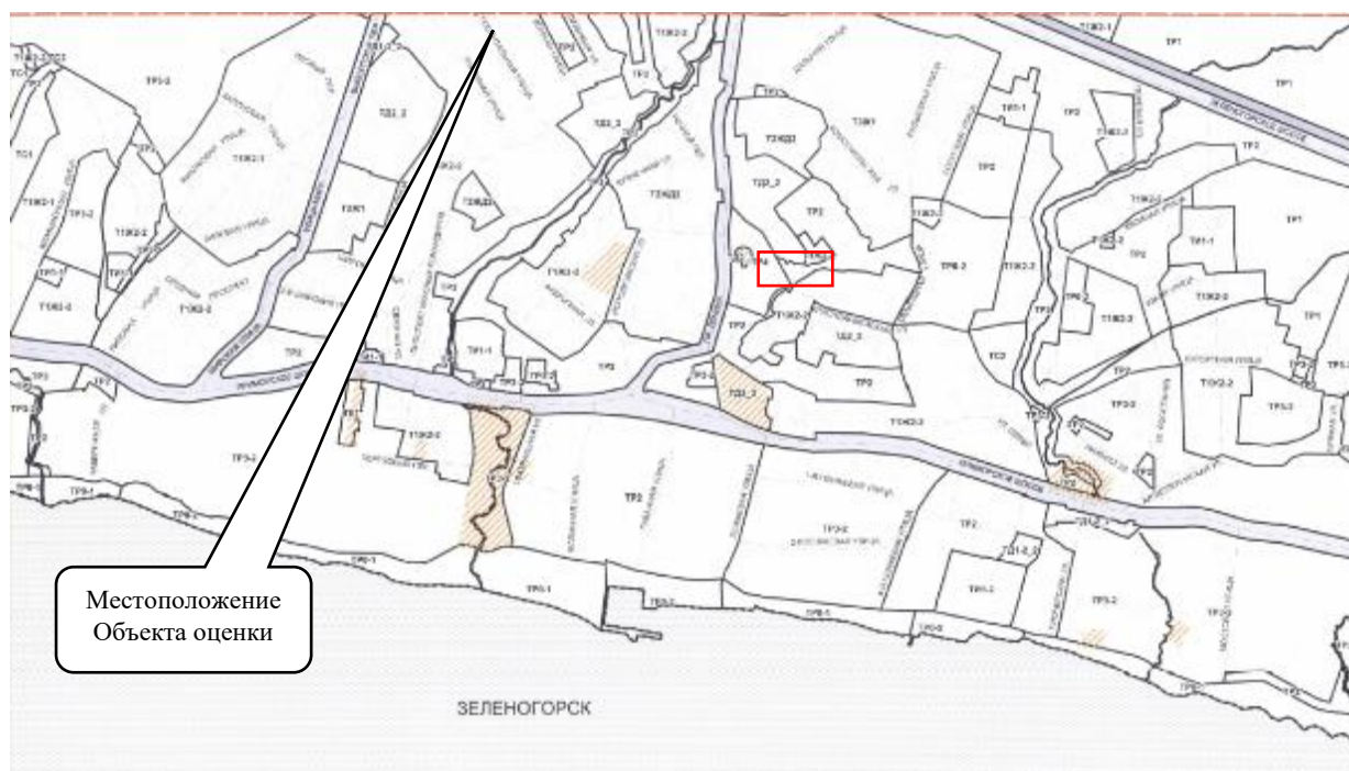
Рисунок 3 Границы территориальных зон и подзон согласно Постановлению Правительства Санкт-Петербурга от 21.06.2016 №524 «О правилах землепользования и застройки Санкт-Петербурга» (ПЗЗ) 4