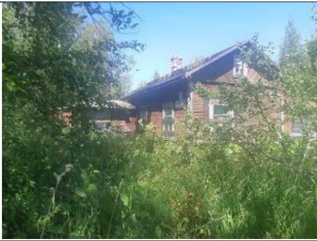
Фото 7. Вид на оцениваемый земельный участок и жилой дом в составе Объекта оценки