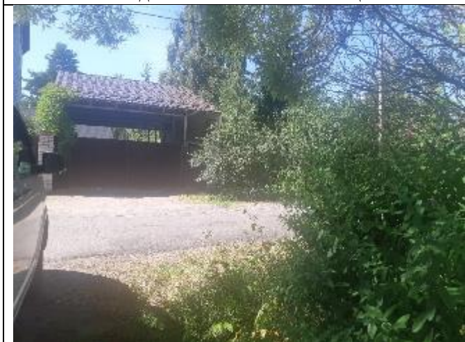
Фото 17. Вид на Госпитальную улицу.