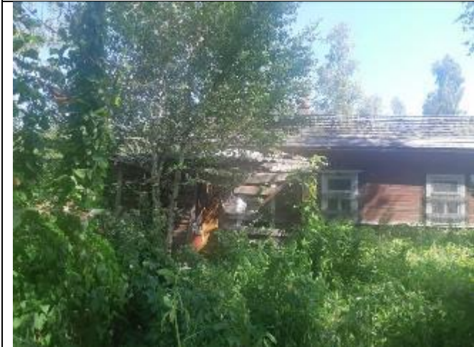
Фото 5. Вид на оцениваемый земельный участок и жилой дом в составе Объекта оценки