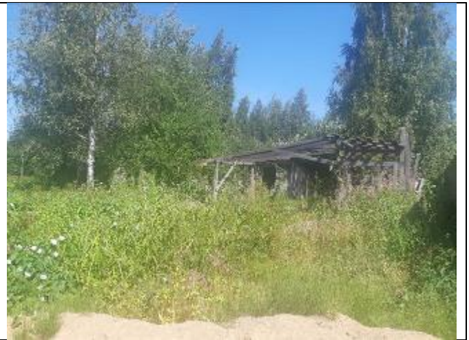
Фото 8. Вид на оцениваемый земельный участок в составе Объекта оценки