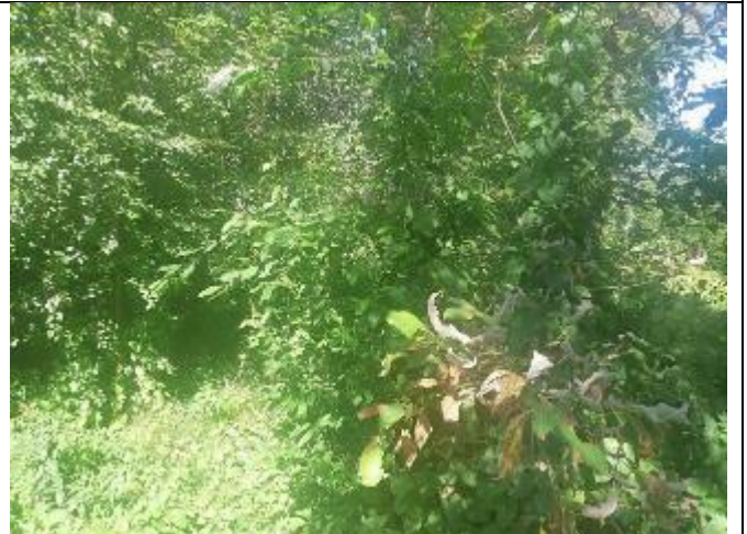
Фото 6. Вид на оцениваемый земельный участок в составе Объекта оценки