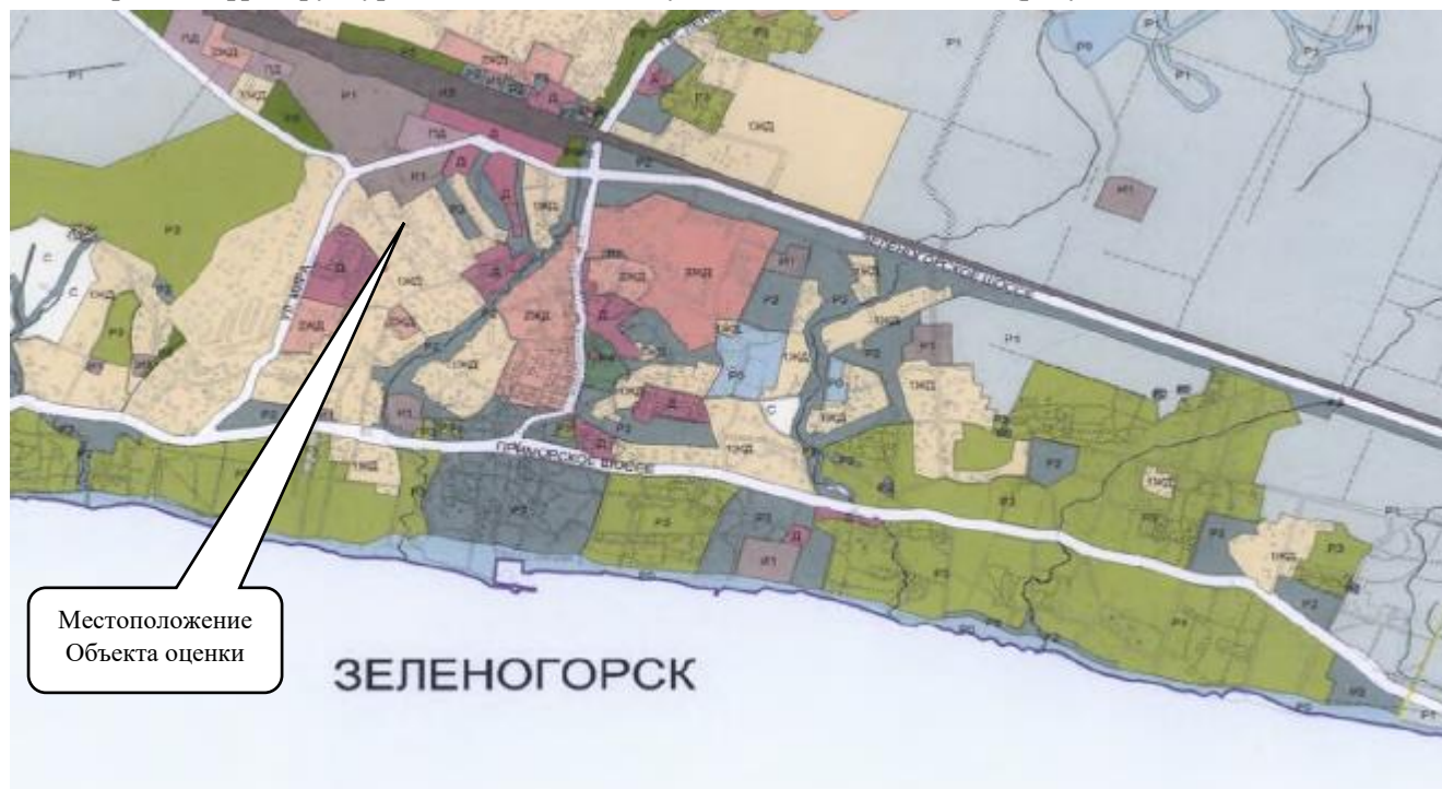
Рисунок 2 Функциональное зонирование по Генеральному плану 3

Согласно Закону Санкт-Петербурга от 22.12.2005 № 728-99 (в действующей редакции) «О Генеральном плане Санкт-Петербурга», Объект оценки располагается в границах зоны «1ЖД» - зона застройки односемейными (индивидуальными) жилыми домами (отдельно стоящими и/или блокированными), коллективных садоводств, с включением объектов общественно-деловой застройки и инженерной инфраструктуры, связанных с обслуживанием данной зоны (рисунок 2).