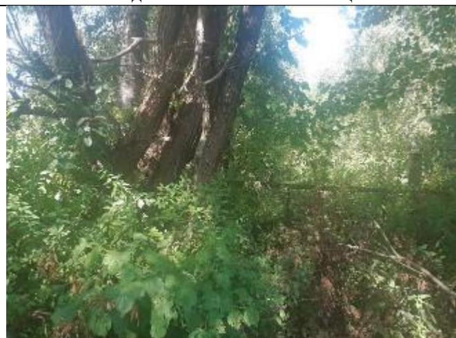
Фото 16. Вид на оцениваемый земельный участок в составе Объекта оценки