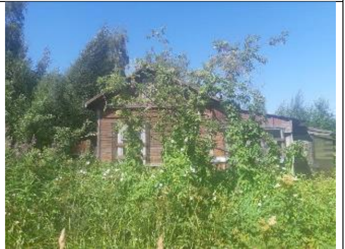
Фото 10. Вид на оцениваемый земельный участок и жилой дом в составе Объекта оценки