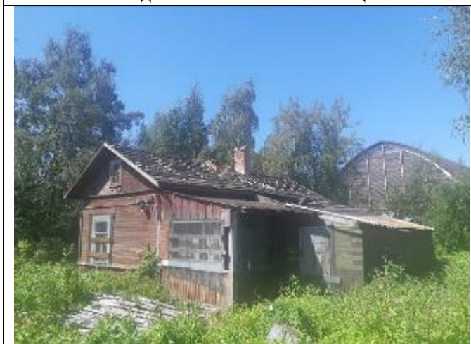
Фото 15. Вид на оцениваемый земельный участок и жилой дом в составе Объекта оценки