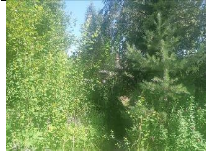
Фото 1. Вид на оцениваемый земельный участок и жилой дом в составе Объекта оценки