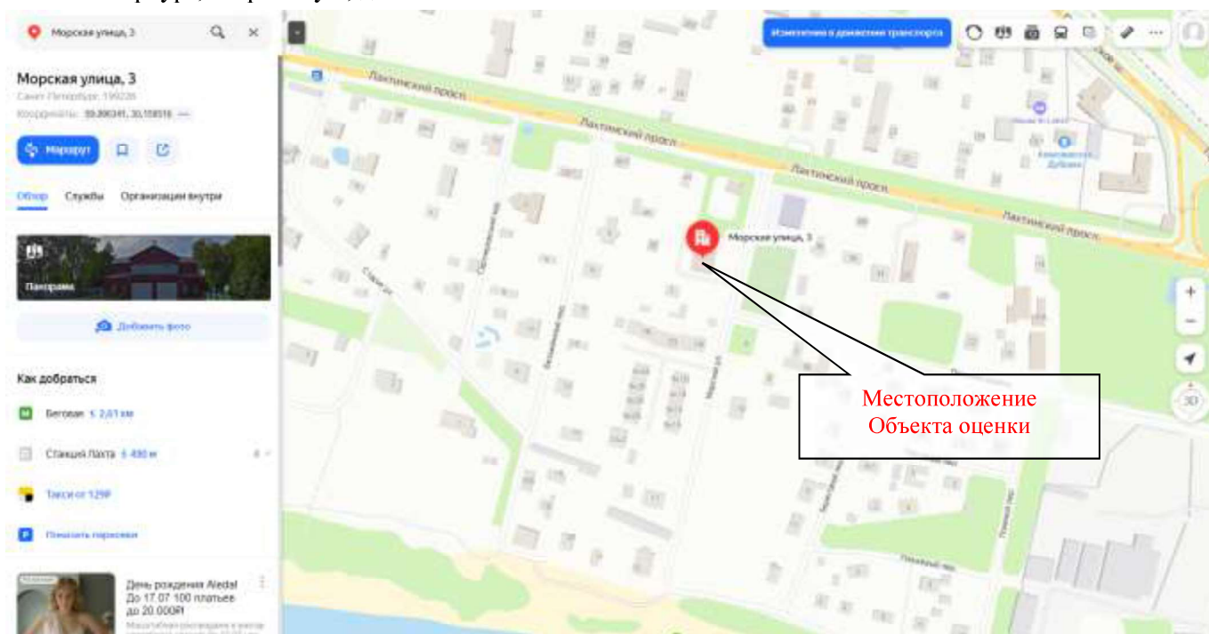
Рисунок 7.1 – локальное местоположение Объекта оценки

Объект оценки расположен на закрытой территории пожарно-спасательного отряда противопожарной службы Санкт-Петербурга по Приморскому району Санкт-Петербурга по адресу: Санкт-Петербург, Морская ул., д. 3.