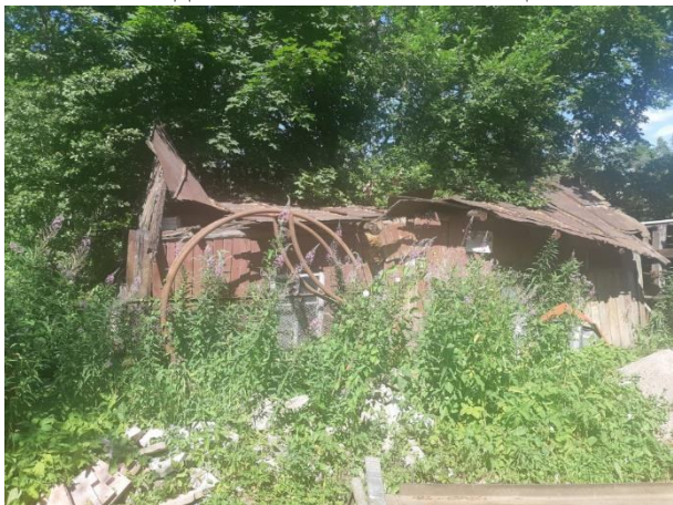
Фото 9. Вид на оцениваемый земельный участок и жилой дом в составе Объекта оценки.