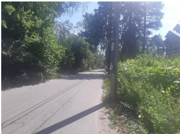
Фото 1. Вид на Торфяную ул.