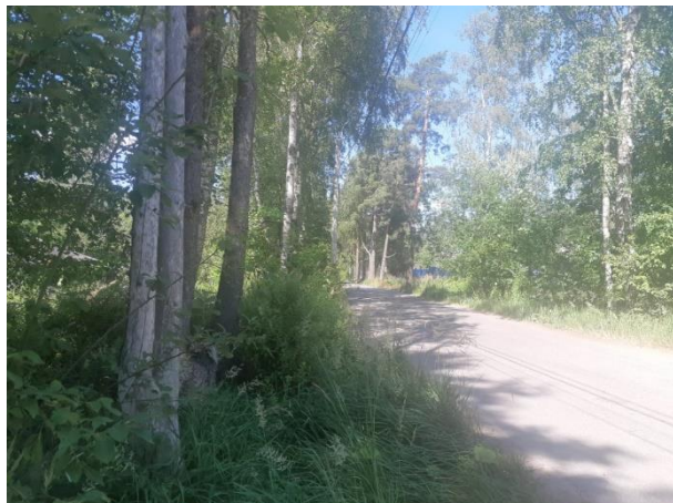
Фото 2. Вид на Торфяную ул.