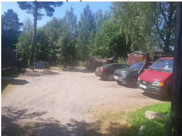
Фото 5. Внутриквартальный проезд от Торфяной ул. в сторону Объекта оценки.