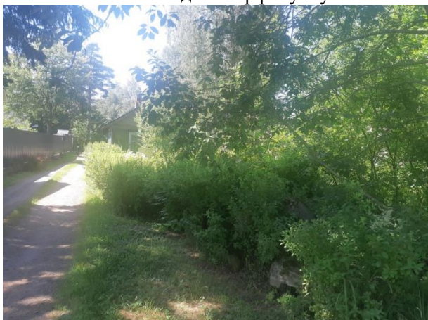
Фото 3. Внутриквартальный проезд от Торфяной ул. в сторону Объекта оценки.