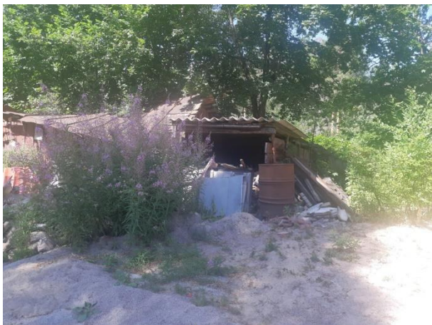
Фото 7. Вид на оцениваемый земельный участок и жилой дом в составе Объекта оценки.