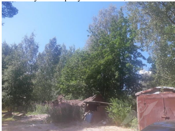
Фото 6. Вид на оцениваемый земельный участок и жилой дом в составе Объекта оценки.