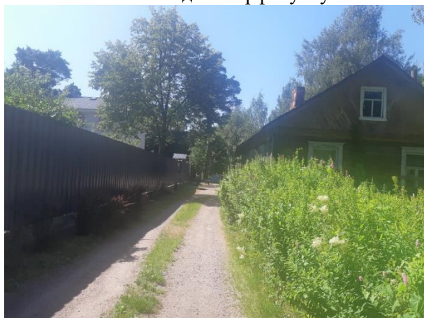
Фото 4. Внутриквартальный проезд от Торфяной ул. в сторону Объекта оценки.