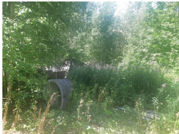
Фото 10. Вид на оцениваемый земельный участок и жилой дом в составе Объекта оценки.