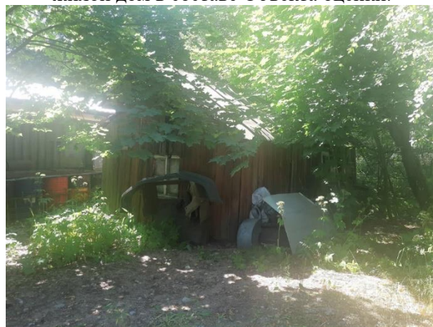
Фото 12. Вид на оцениваемый земельный участок и жилой дом в составе Объекта оценки.

Описание состояния Объекта оценки составлено исключительно по результатам визуального осмотра. Инженерного обследования строительных конструкций и внутренних инженерных сетей здания не проводилось.