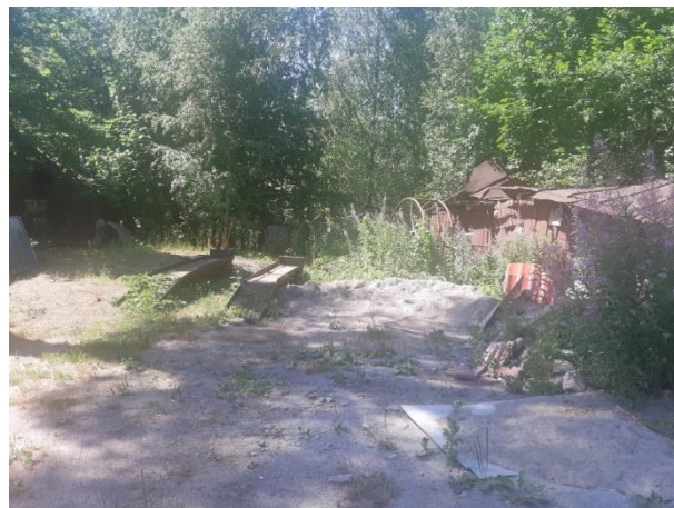
Фото 8. Вид на оцениваемый земельный участок и жилой дом в составе Объекта оценки.