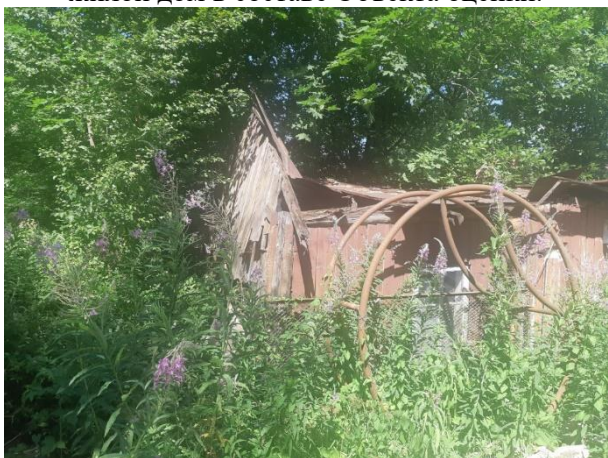
Фото 11. Вид на оцениваемый земельный участок и жилой дом в составе Объекта оценки.