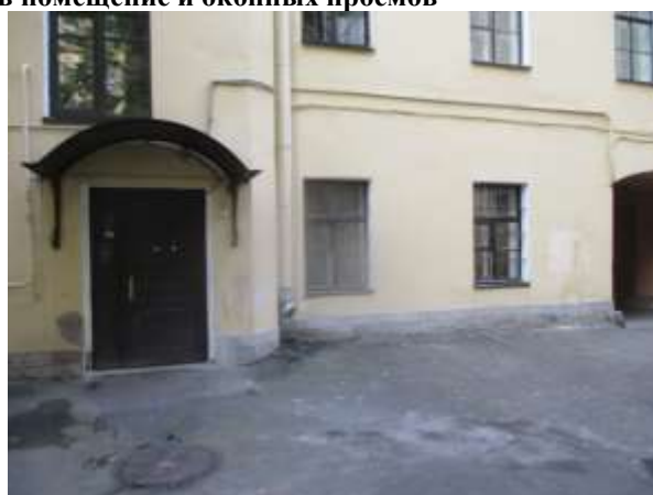
Фото 6. Доступ Объекта оценки