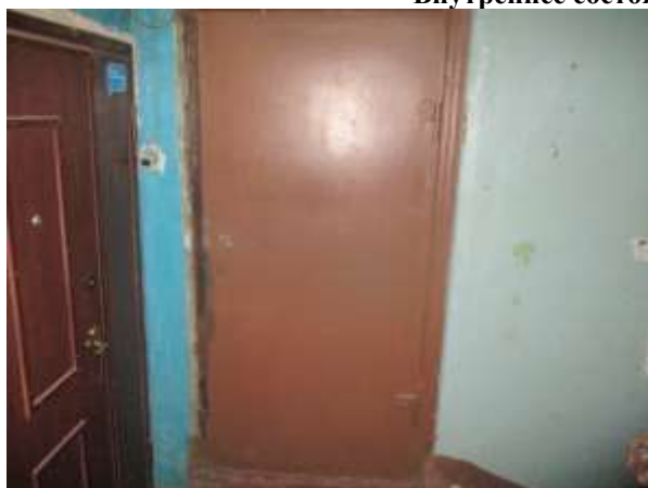
Фото 9. Вход в помещение