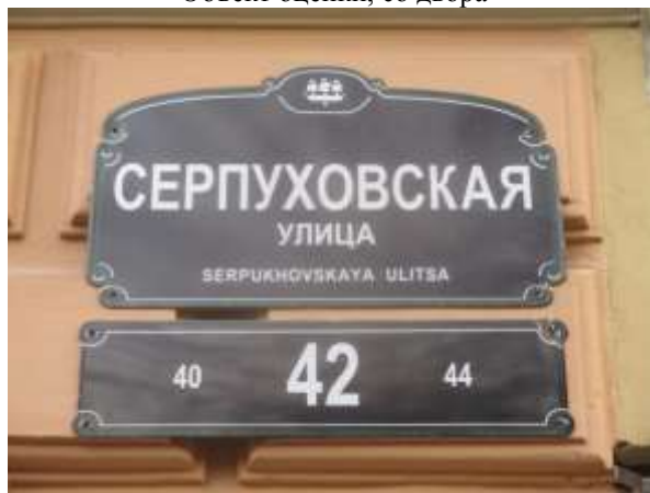
Фото 4. Табличка с номером дома

Характеристика входной группы в помещение и оконных проемов