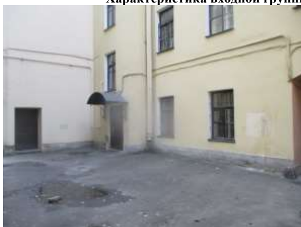
Фото 5. Доступ Объекта оценки

Характеристика входной группы в помещение и оконных проемов