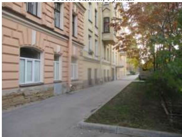
Фото 3. Ближайшее окружение