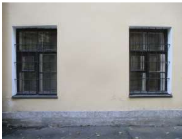
Фото 8. Окна Объекта оценки