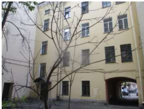
Фото 2. Вид здания, в котором расположен Объект оценки, со двора