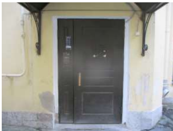
Фото 7. Общий вход со двора