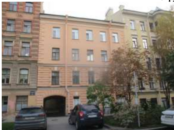
Фото 1. Вид здания, в котором расположен Объект оценки, с улицы

Общий вид здания, в котором расположен Объект оценки, придомовой территории и ближайшего окружения