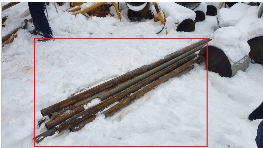
Фото 5