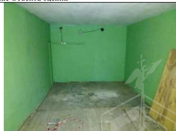
Фото 9. Внутреннее состояние Объекта оценки