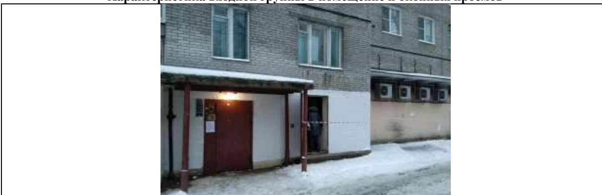
Фото 7. Отдельный вход со двора