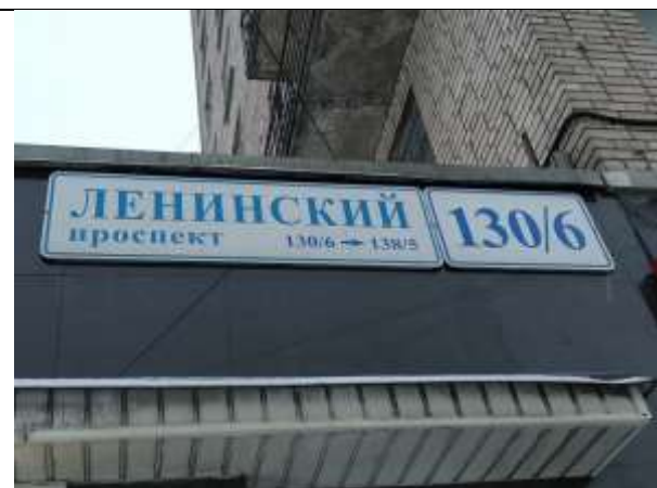
Фото 4. Табличка с номером дома