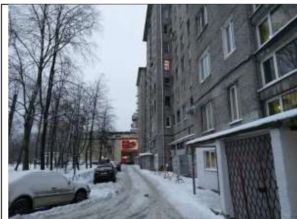
Фото 3. Дворовая территория. Подъезд