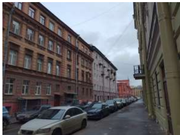
Фото 4. Дворовая территория

Характеристика входной группы в помещение и оконных проемов