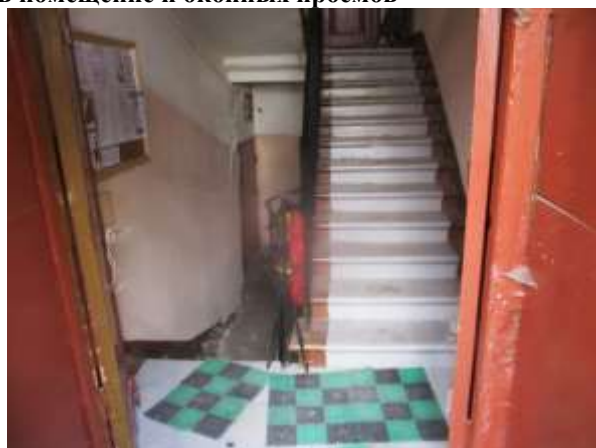
Фото 6. Доступ Объекта оценки