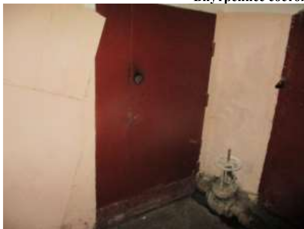
Фото 7. Вход в помещение