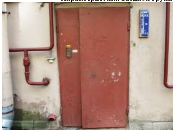
Фото 5. Общий вход со двора

Характеристика входной группы в помещение и оконных проемов