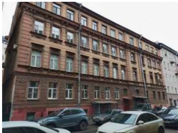
Фото 2. Дворовая территория