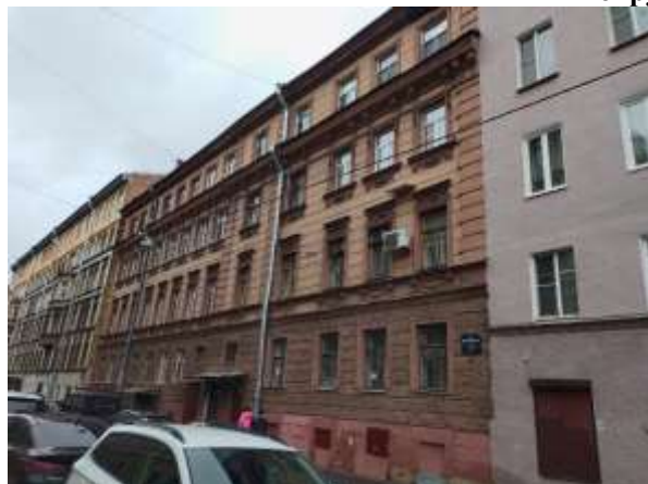
Фото 1. Вид здания, в котором расположен Объект оценки с улицы

Общий вид здания, в котором расположен Объект оценки, придомовой территории и ближайшего окружения