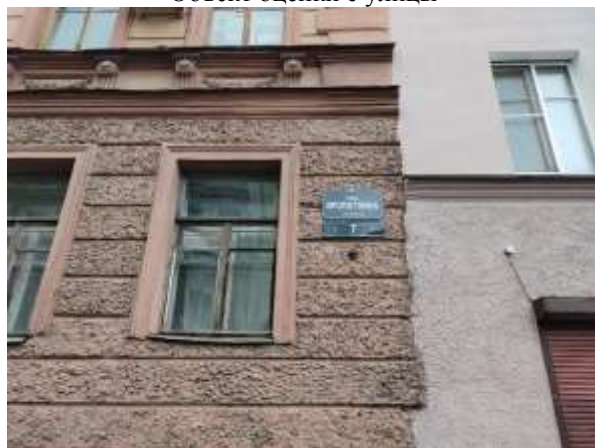
Фото 3. Табличка с номером дома