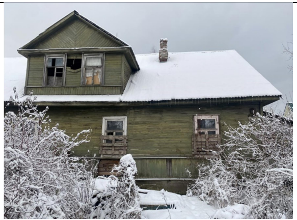
Фото 2. Вид на здание размещения Объекта оценки.