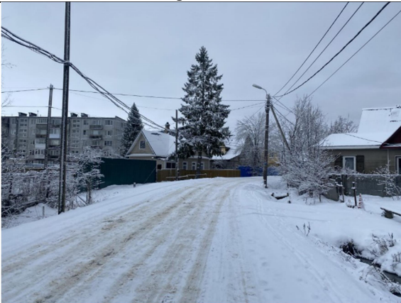
Фото 5. Ближайшее окружение (Новогорская улица).