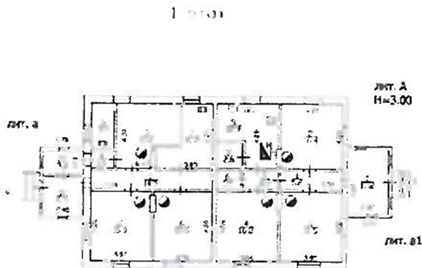
Рисунок 2. План 1-го этажа