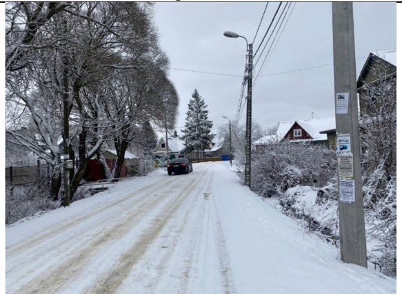
Фото 6. Ближайшее окружение (Новогорская улица).

Описание состояния Объекта оценки составлено исключительно по результатам визуального осмотра. Инженерного обследования строительных конструкций и внутренних инженерных сетей здания не проводилось.