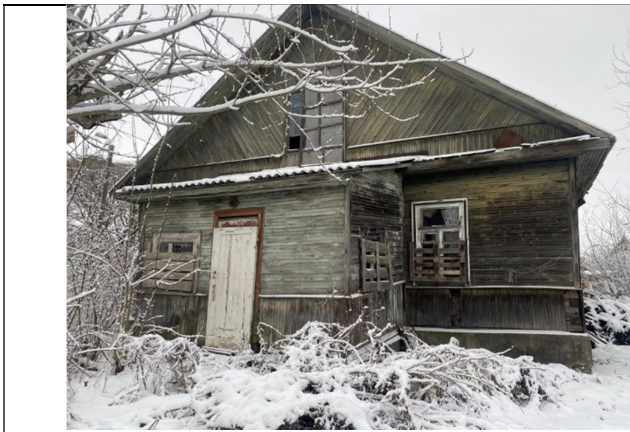
Фото 1. Вид на здание размещения Объекта оценки.

Далее приведены фотографии, выполненные при проведении осмотра Объекта оценки 01.02.2023.