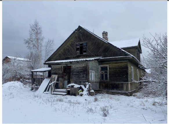
Фото 4. Вид на здание размещения Объекта оценки.