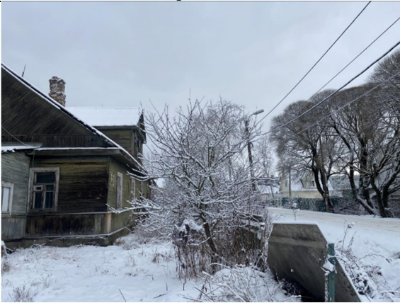
Фото 3. Вид на здание размещения Объекта оценки.