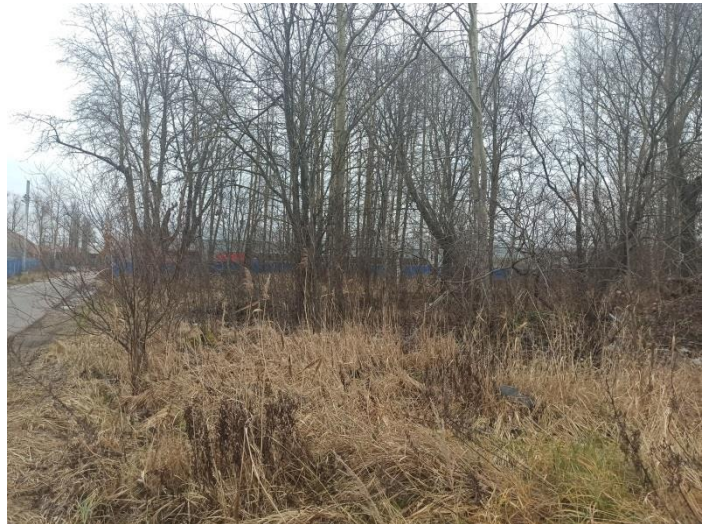
Фото № 2 Высокоствольные деревья