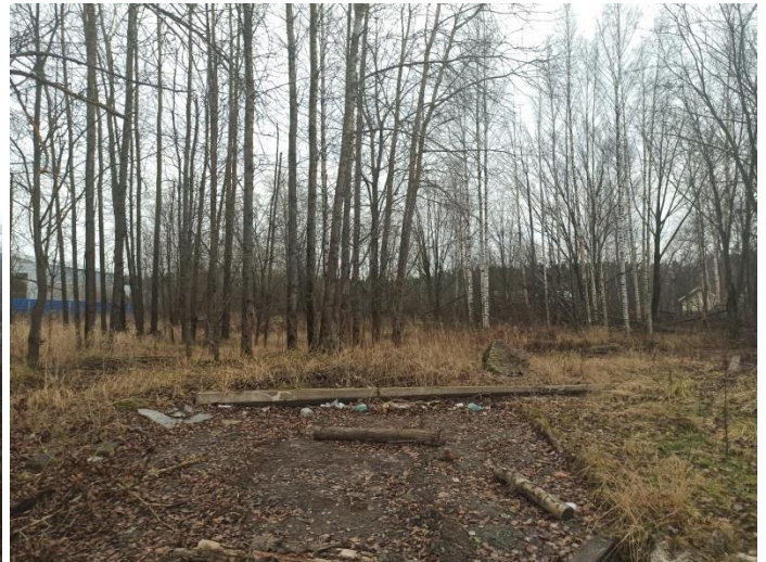
Фото № 4 Древесно-кустарниковая растительность