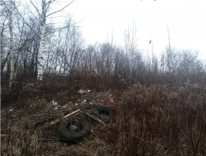
Фото № 3 Строительно-бытовой мусор