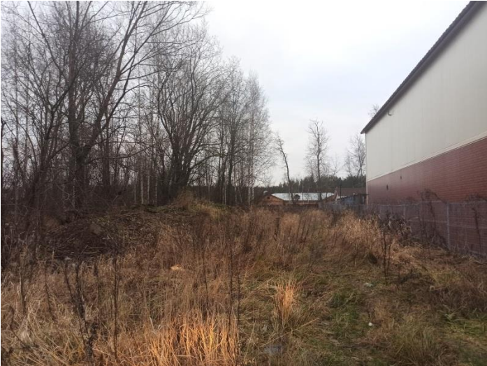
Фото № 1 Грунтовое покрытие