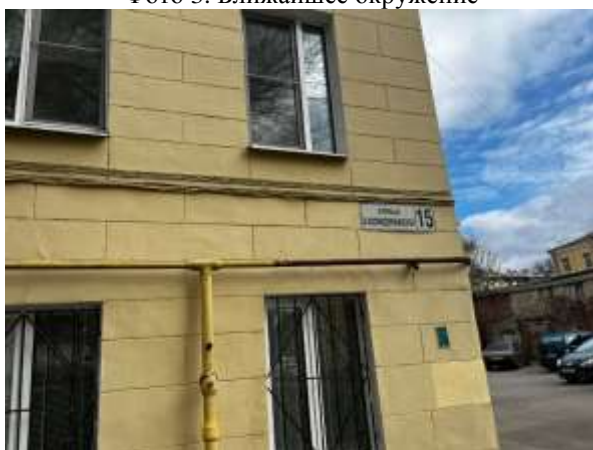
Фото 5. Табличка с номером дома