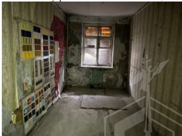
Фото 16. Внутреннее состояние Объекта оценки