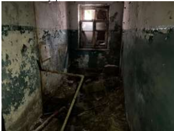
Фото 17. Внутреннее состояние Объекта оценки