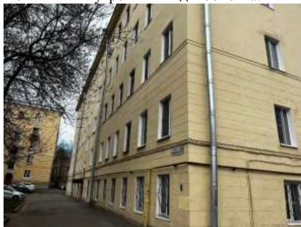
Фото 1. Вид здания Объекта оценки