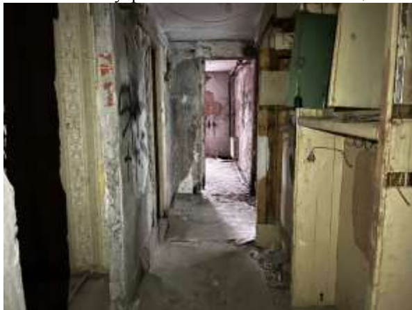
Фото 21. Внутреннее состояние Объекта оценки