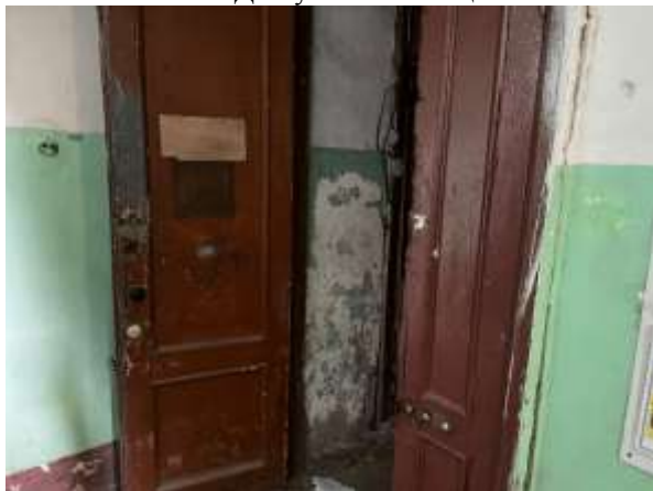
Фото 9. Доступ Объекта оценки