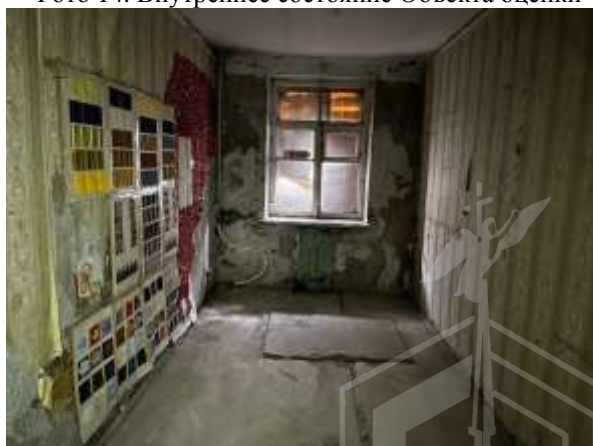
Фото 16. Внутреннее состояние Объекта оценки