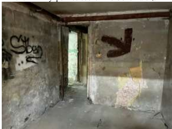
Фото 14. Внутреннее состояние Объекта оценки