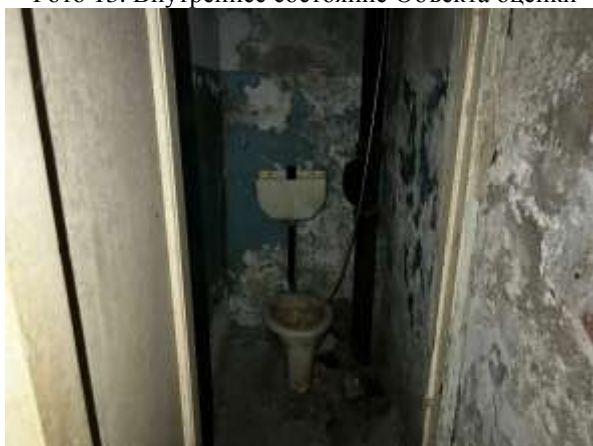
Фото 15. Внутреннее состояние Объекта оценки