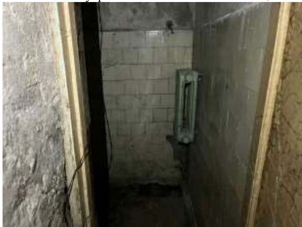
Фото 18. Внутреннее состояние Объекта оценки