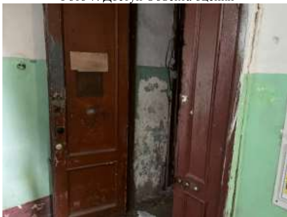
Фото 9. Доступ Объекта оценки