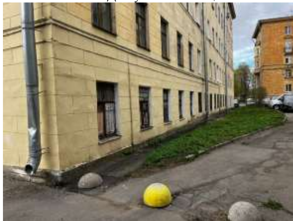
Фото 10. Окна Объекта оценки