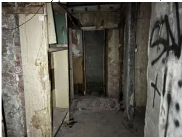
Фото 19. Внутреннее состояние Объекта оценки