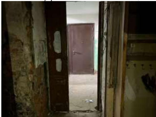
Фото 22. Внутреннее состояние Объекта оценки