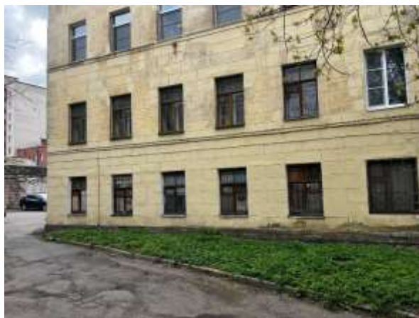
Фото 2. Вид здания Объекта оценки