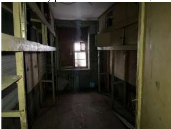
Фото 13. Внутреннее состояние Объекта оценки