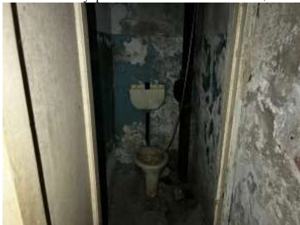
Фото 15. Внутреннее состояние Объекта оценки