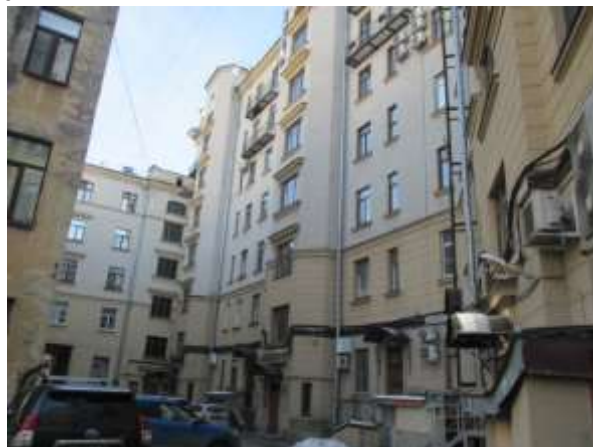
Фото 2. Вид здания, в котором расположен Объект оценки, со двора