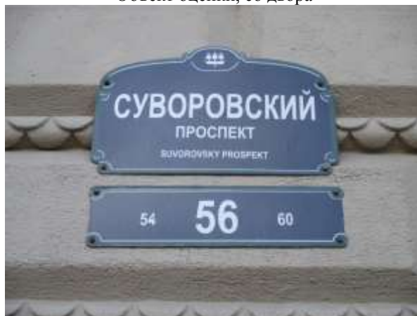
Фото 4. Табличка с номером дома

Характеристика входной группы в помещение и оконных проемов