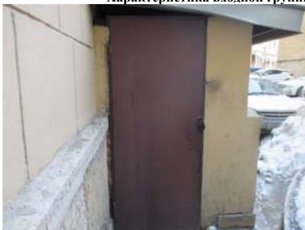
Фото 5. Отдельный вход Объекта оценки

Характеристика входной группы в помещение и оконных проемов