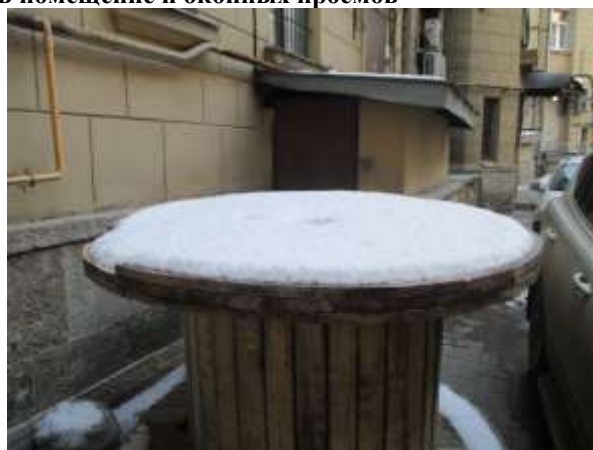
Фото 6. Доступ Объекта оценки