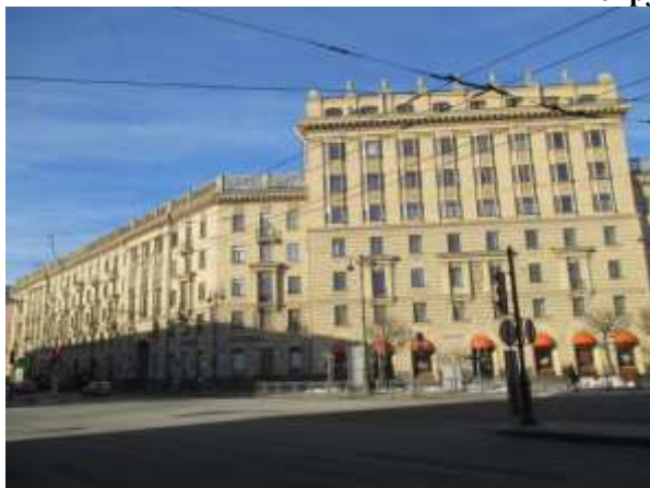
Фото 1. Вид здания, в котором расположен Объект оценки с улицы

Общий вид здания, в котором расположен Объект оценки, придомовой территории и ближайшего окружения