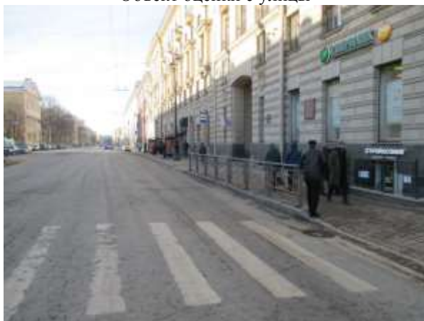
Фото 3. Ближайшее окружение