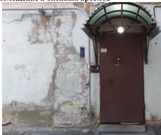
Фото 8. Общий вход со двора