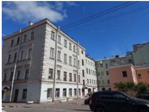
Фото 2. Вид здания, в котором расположен Объект оценки, с улицы