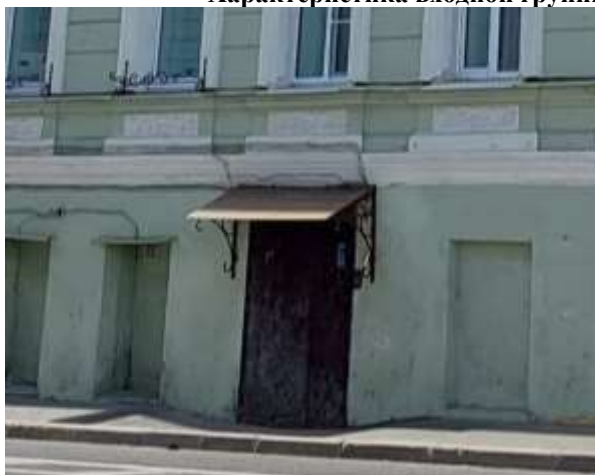
Фото 7. Общий вход с улицы