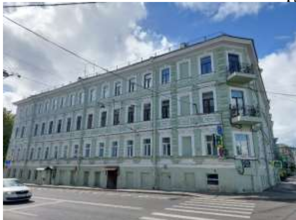
Фото 1. Вид здания, в котором расположен Объект оценки, с улицы

Общий вид здания, в котором расположен Объект оценки, придомовой территории и ближайшего окружения