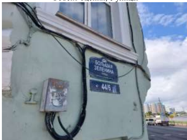
Фото 3. Табличка с номером дома