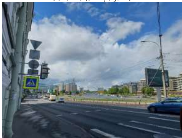
Фото 4. Ближайшее окружение