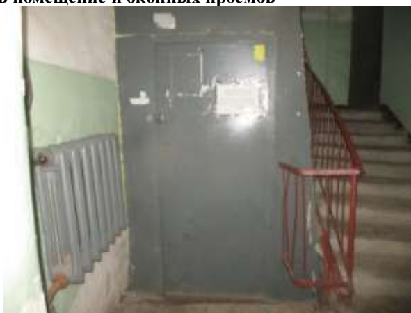
Фото 6. Доступ Объекта оценки