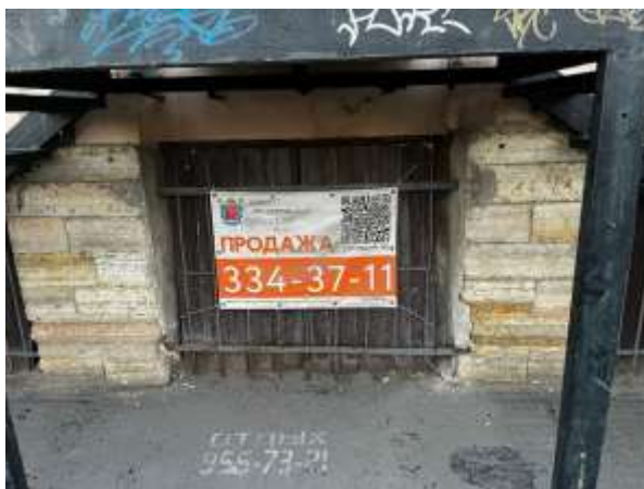
Фото 7. Окна Объекта оценки