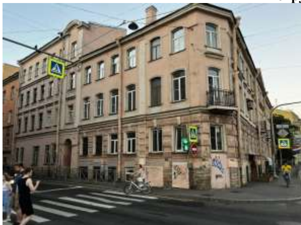
Фото 1. Вид здания, в котором расположен Объект оценки с улицы

Общий вид здания, в котором расположен Объект оценки, придомовой территории и ближайшего окружения