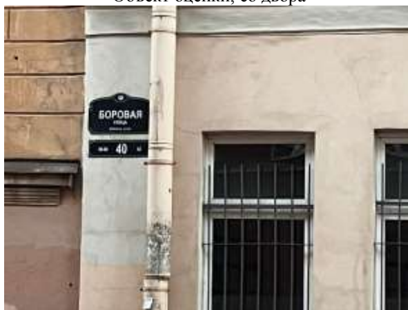
Фото 4. Табличка с номером дома