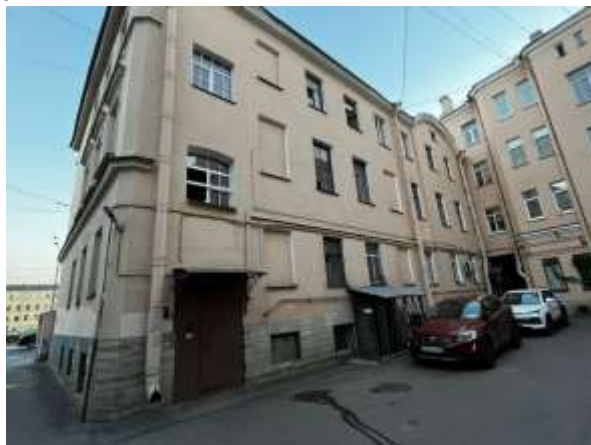
Фото 2. Вид здания, в котором расположен Объект оценки, со двора