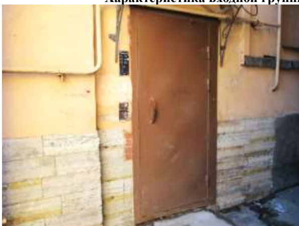
Фото 5. Общий вход Объекта оценки