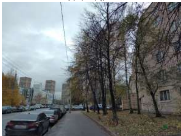
Фото 3. Ближайшее окружение Характеристика входной группы в помещение и оконных проемов