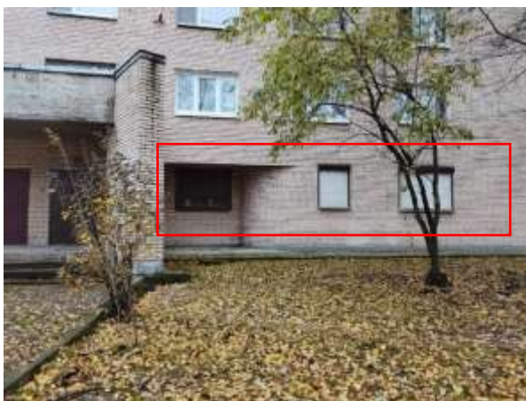
Фото 7. Окна Объекта оценки Внутреннее состояние Объекта оценки