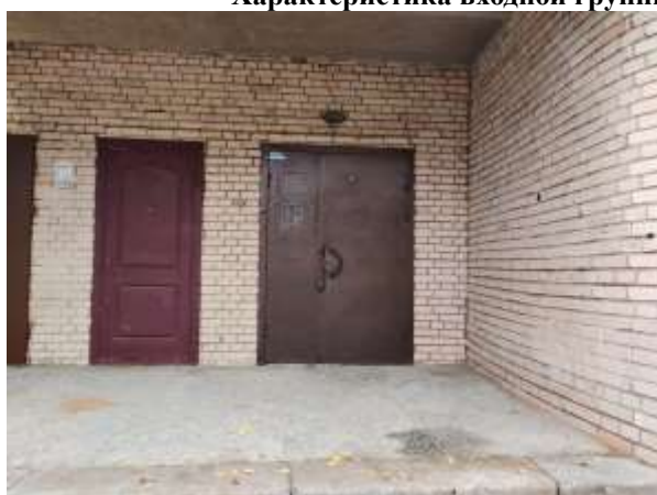
Фото 5. Общий вход с улицы