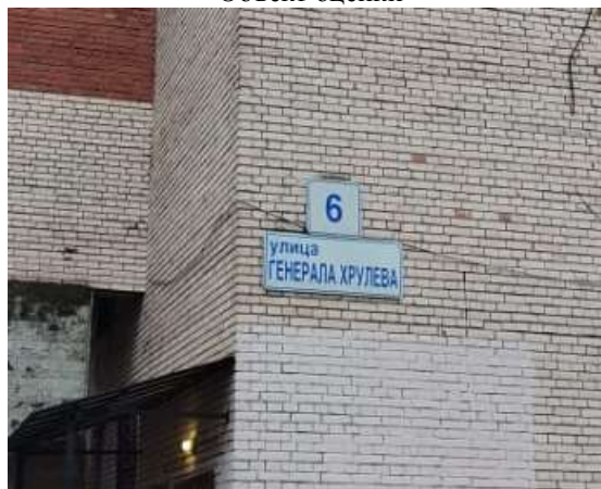
Фото 4. Табличка с номером дома в помещении и оконных проемов