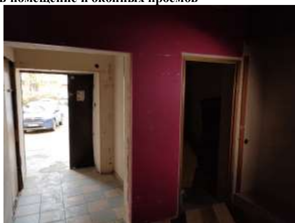
Фото 6. Доступ Объекта оценки