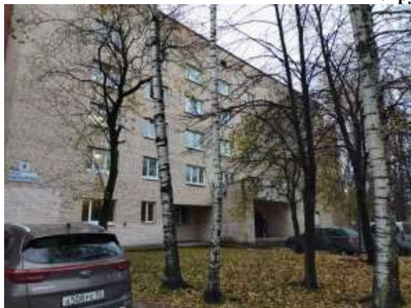
Фото 1. Вид здания, в котором расположен Объект оценки

Общий вид здания, в котором расположен Объект оценки, придомовой территории и ближайшего окружения