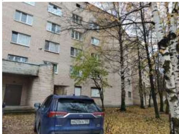
Фото 2. Вид здания, в котором расположен Объект оценки