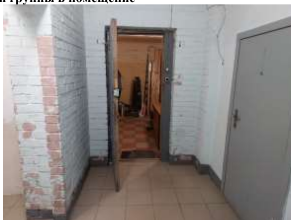
Фото 6. Доступ Объекта оценки