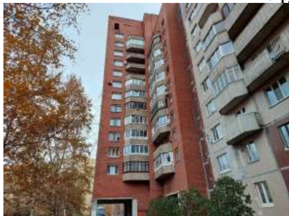
Фото 1. Вид здания, в котором расположен Объект оценки

Общий вид здания, в котором расположен Объект оценки, придомовой территории и ближайшего окружения