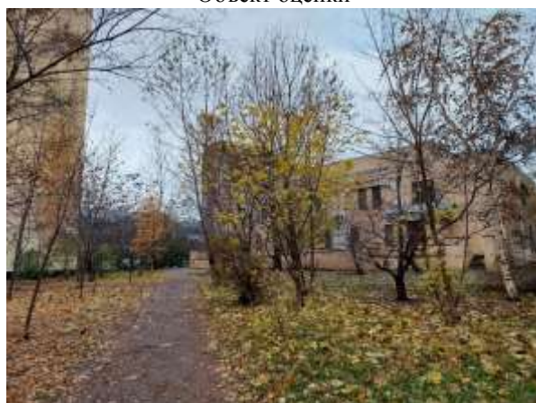
Фото 3. Ближайшее окружение