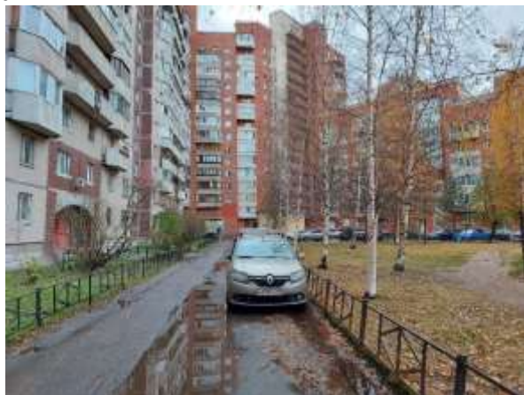
Фото 2. Вид здания, в котором расположен Объект оценки