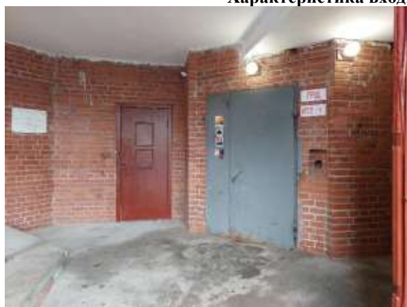
Фото 5. Общий вход со двора