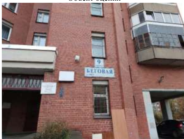
Фото 4. Табличка с номером дома