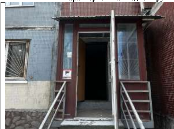
Фото 5 Отдельный вход с улицы и окно