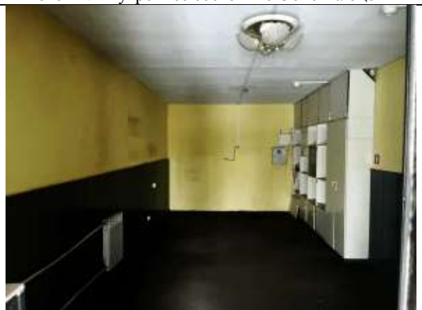
Фото 14. Внутреннее состояние Объекта оценки