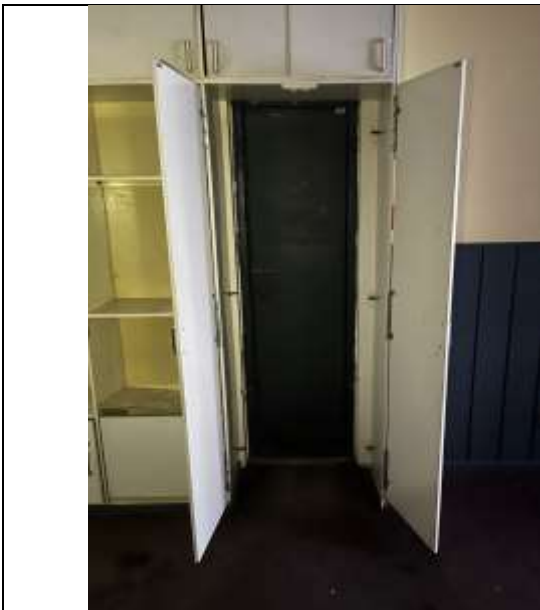
Фото 9. Внутреннее состояние Объекта оценки