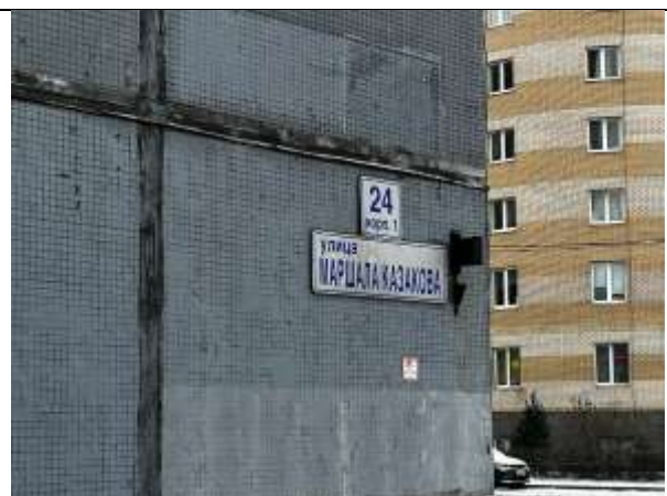
Фото 4. Табличка с номером дома