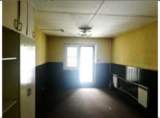
Фото 12. Внутреннее состояние Объекта оценки