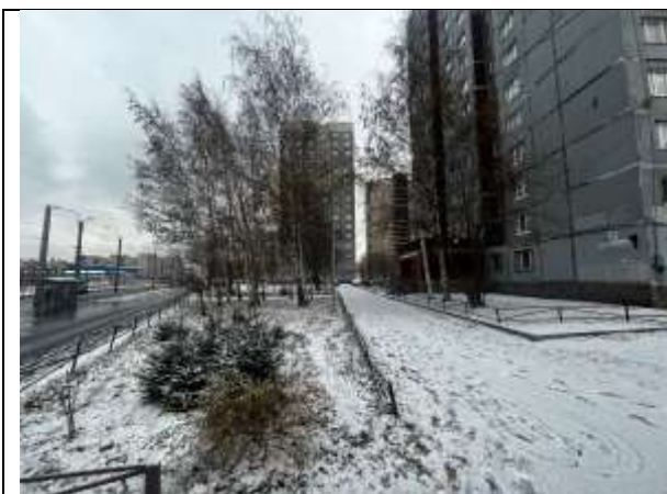
Фото 3. Вид здания, в котором расположен Объект оценки