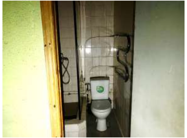
Фото 10. Внутреннее состояние Объекта оценки