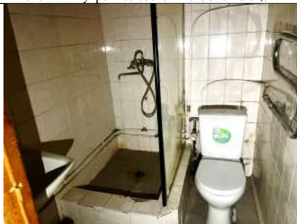
Фото 13. Внутреннее состояние Объекта оценки