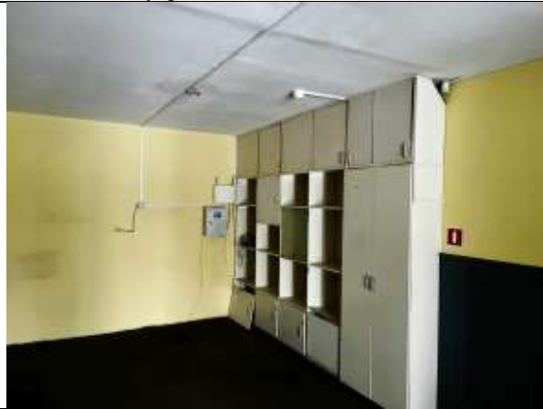
Фото 11. Внутреннее состояние Объекта оценки