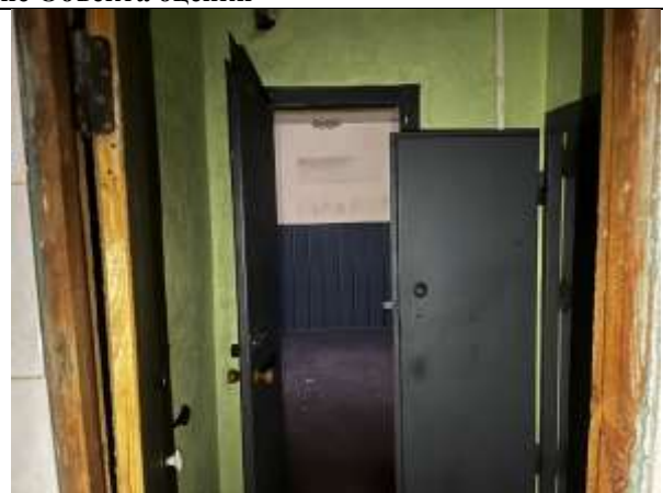
Фото 8. Внутреннее состояние Объекта оценки