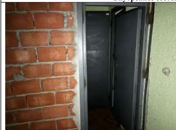
Фото 7. Внутреннее состояние Объекта оценки