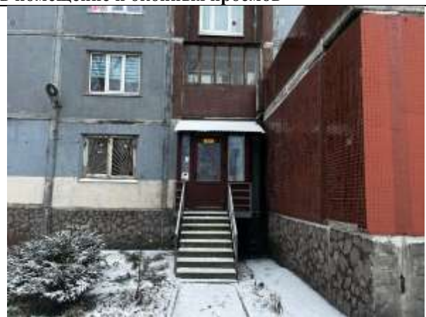
Фото 6. Отдельный вход с улицы и окно