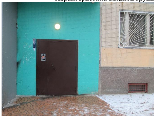
Фото 3. Доступ Объекта оценки, окно

Характеристика входной группы в помещение и оконные проемы