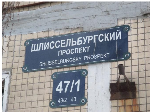
Фото 2. Табличка с номером дома

Характеристика входной группы в помещение и оконные проемы