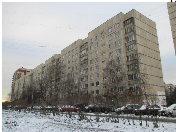
Фото 1. Вид здания, в котором расположен Объект оценки, с улицы

Общий вид здания, в котором расположен Объект оценки, придомовой территории и ближайшего окружения