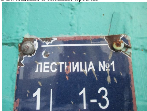
Фото 4. Доступ Объекта оценки,