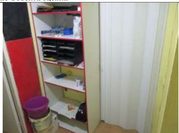
Фото 8. Внутреннее состояние Объекта оценки