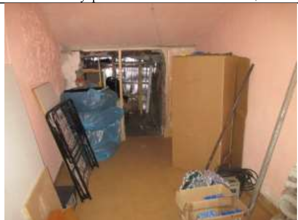
Фото 10. Внутреннее состояние Объекта оценки