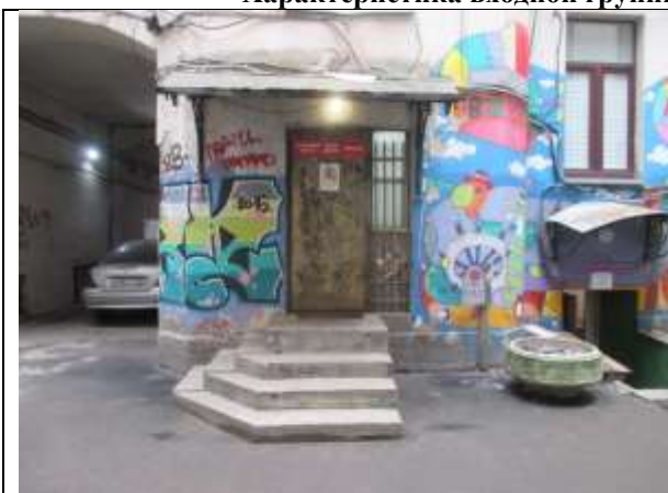
Фото 5. Доступ Объекта оценки