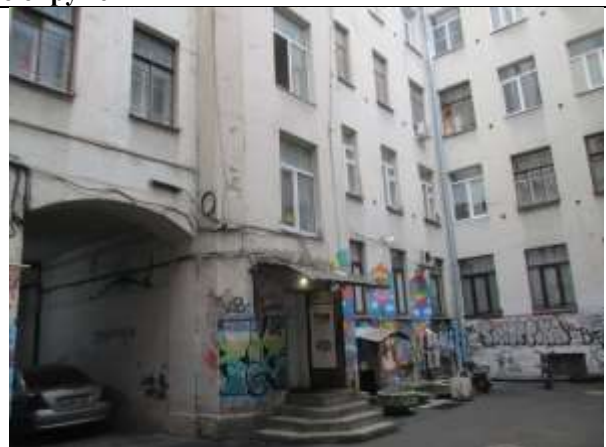
Фото 2. Вид здания, в котором расположен Объект оценки