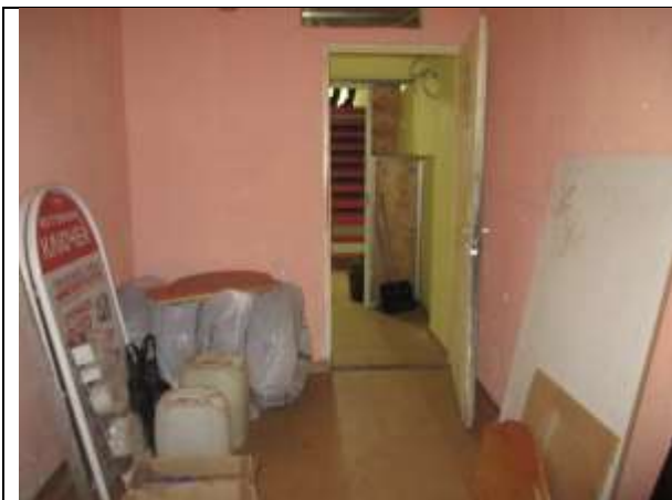
Фото 13. Внутреннее состояние Объекта оценки