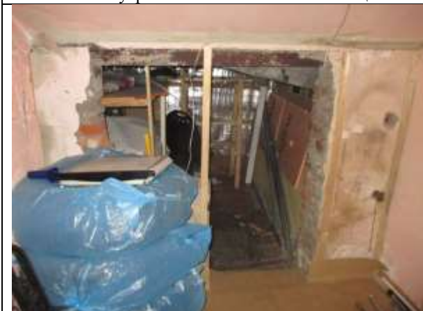
Фото 11. Внутреннее состояние Объекта оценки