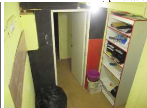
Фото 7. Внутреннее состояние Объекта оценки