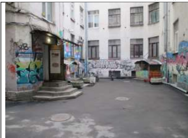
Фото 1. Вид здания, в котором расположен Объект оценки

Общий вид здания, в котором расположен Объект оценки, придомовой территории и ближайшего окружения