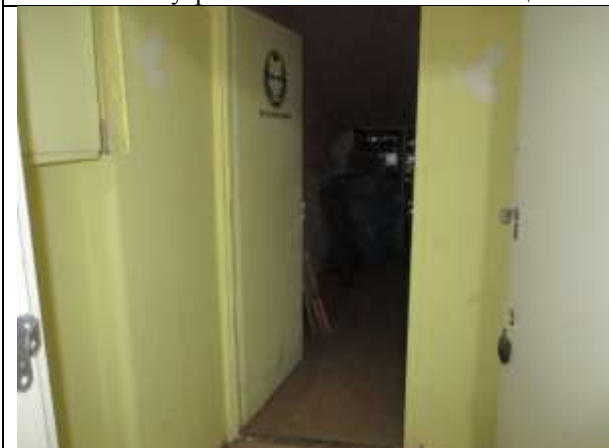
Фото 9. Внутреннее состояние Объекта оценки