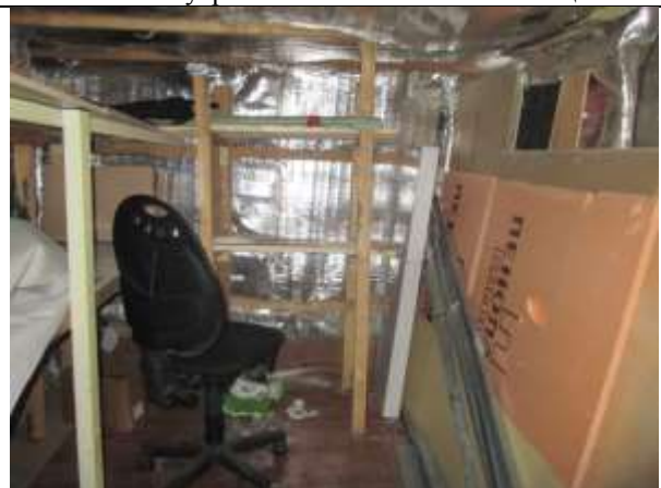
Фото 12. Внутреннее состояние Объекта оценки