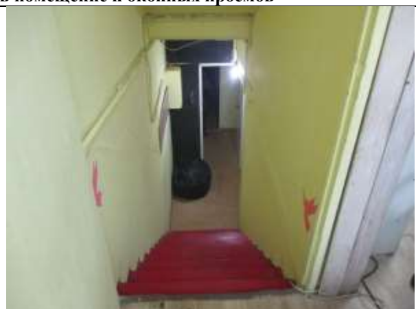
Фото 6. Общий вход со двора Объекта оценки