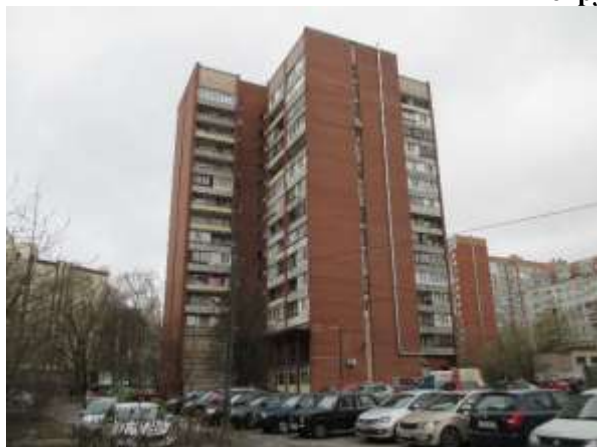
Фото 1. Вид здания, в котором расположен Объект оценки

Общий вид здания, в котором расположен Объект оценки, придомовой территории и ближайшего окружения