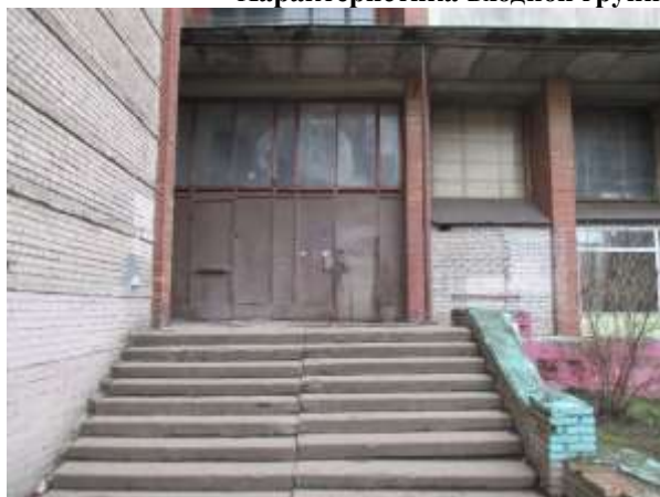
Фото 3. Доступ Объекта оценки

Характеристика входной группы в помещение и оконные проемы