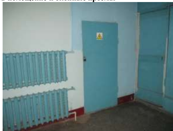
Фото 4. Доступ Объекта оценки