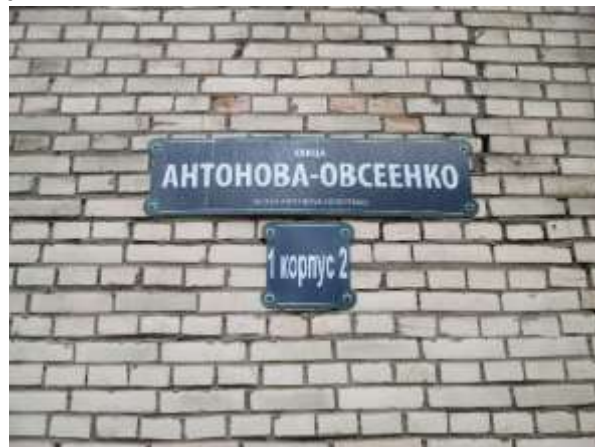
Фото 2. Табличка с номером дома

Характеристика входной группы в помещение и оконные проемы