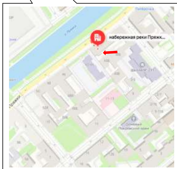
Рисунок 1. Локальное местоположение