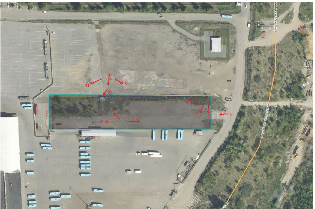
Рисунок 4 – Локальное расположение оцениваемого земельного участка