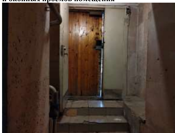
Фото 6. Доступ Объекта оценки