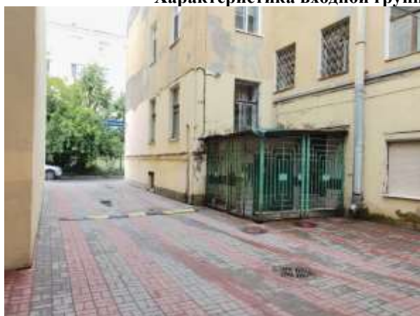
Фото 5. Общий вход со двора

Характеристика входной группы и оконных проемов помещения