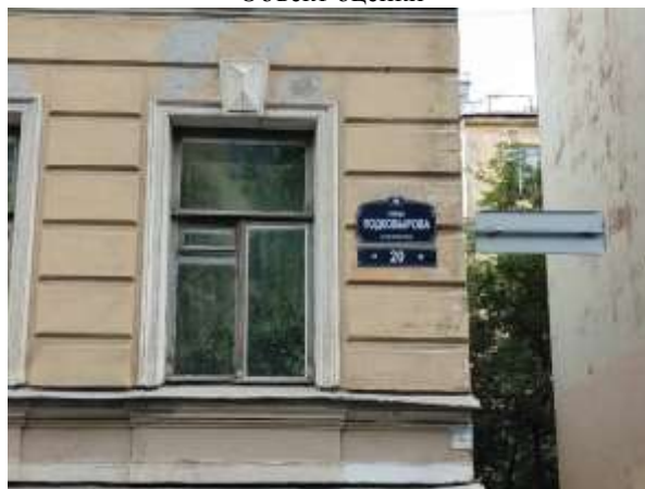
Фото 4. Табличка с номером дома

Характеристика входной группы и оконных проемов помещения