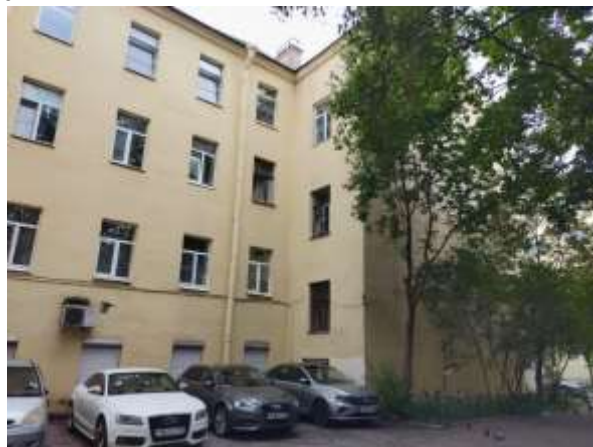
Фото 2. Вид здания, в котором расположен Объект оценки