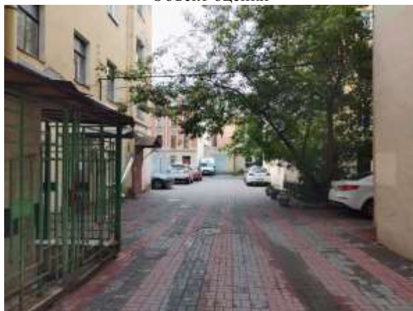
Фото 3. Дворовая территория. Ближайшее окружение