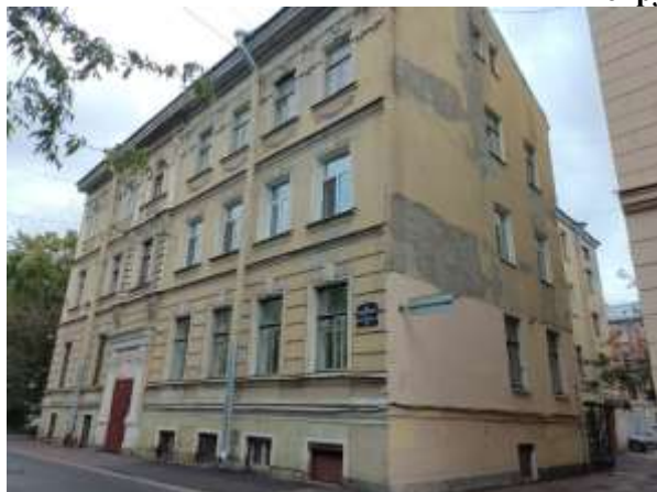
Фото 1. Вид здания, в котором расположен Объект оценки

Общий вид здания, в котором расположен Объект оценки, придомовой территории и ближайшего окружения