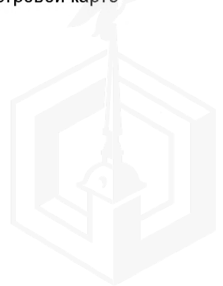
Рисунок 3 – Местоположение оцениваемого земельного участка на кадастровой карте