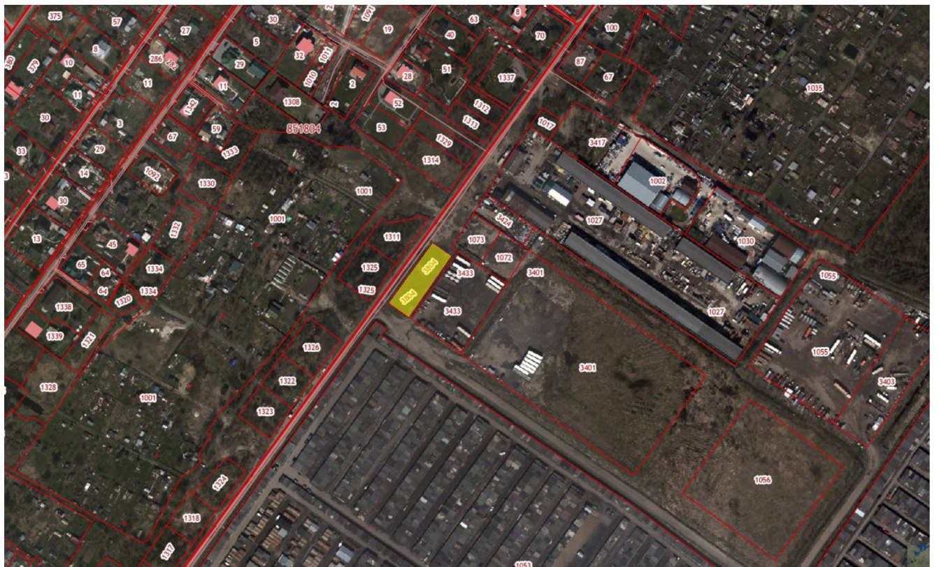
Рисунок 2 – Местоположение оцениваемого земельного участка на кадастровой карте