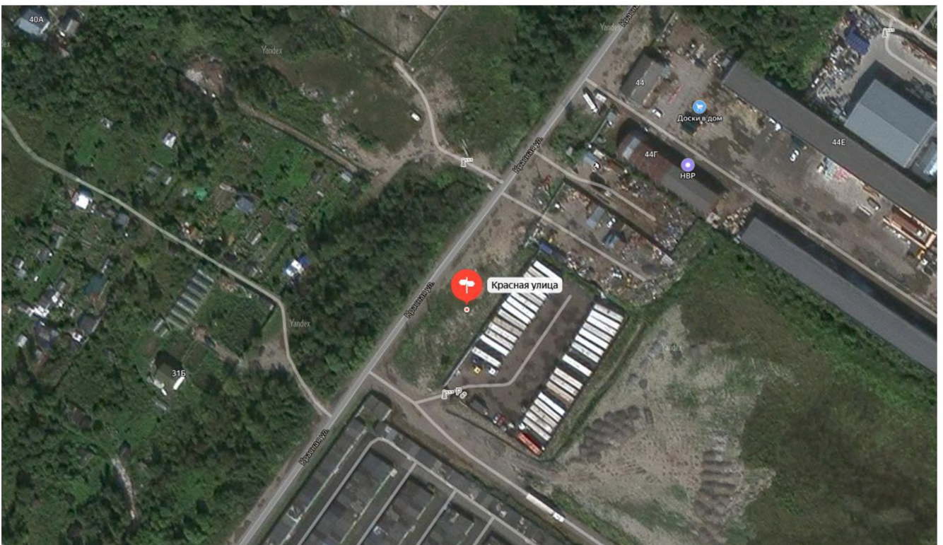
Рисунок 4 – Местоположение оцениваемого земельного участка на карте города