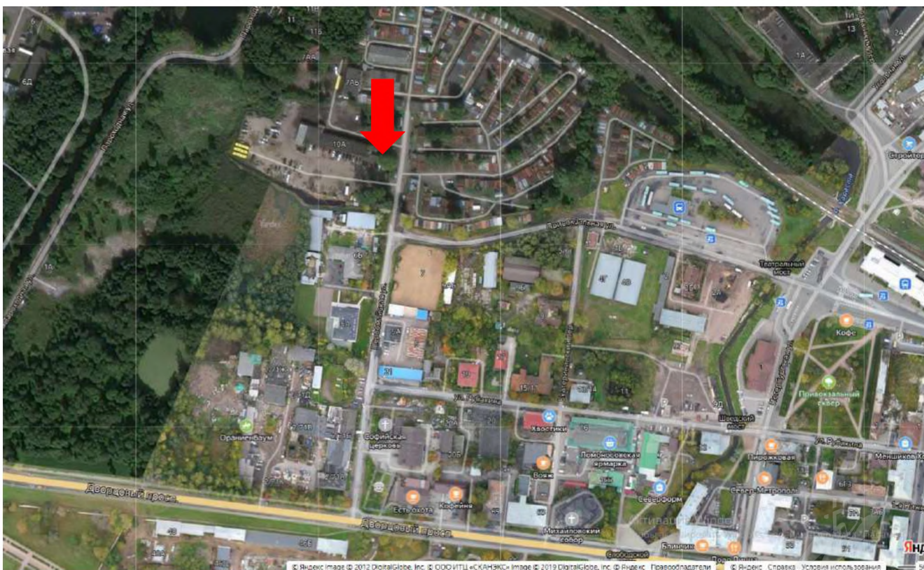
Рисунок 2 – Местоположение оцениваемого земельного участка на карте города