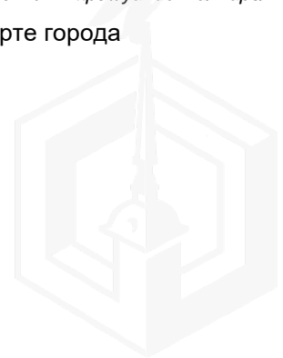
Рисунок 3 – Местоположение оцениваемого земельного участка на карте города