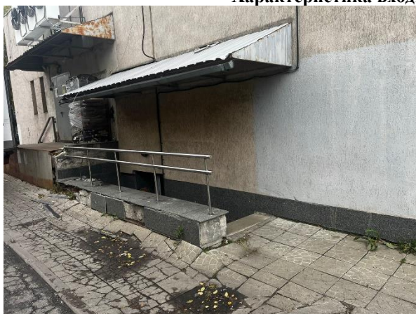
Фото 3. Общий вход с улицы