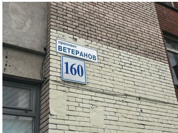
Фото 2. Табличка с номером дома