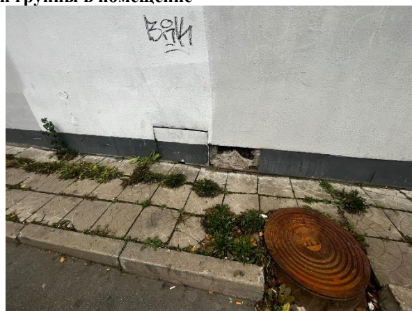
Фото 4. Окно Объекта оценки