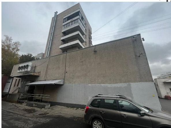
Фото 1. Вид здания Объекта оценки

Общий вид здания, в котором расположен Объект оценки, придомовой территории и ближайшего окружения