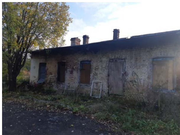
Фото 1. Вид на здание размещения Объекта оценки.