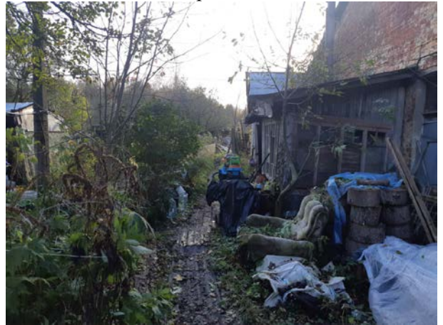
Фото 8. Вид на здание размещения Объекта оценки.