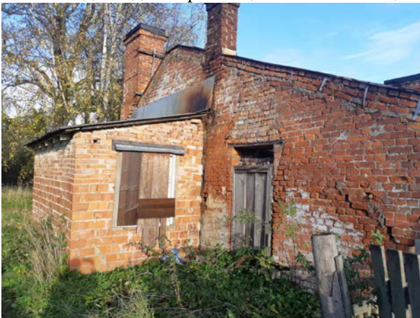
Фото 5. Вид на здание размещения Объекта оценки.