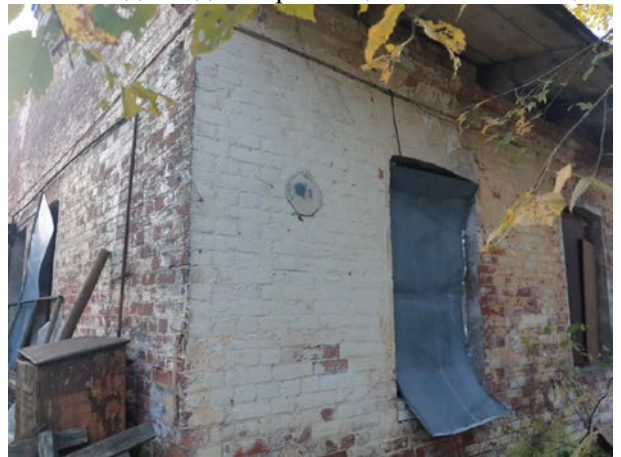
Фото 6. Вид на здание размещения Объекта оценки.