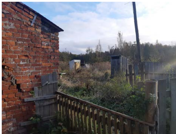
Фото 12. Вид на здание размещения Объекта оценки, ближайшее окружение.