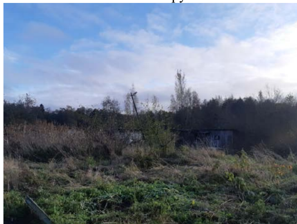
Фото 14. Ближайшее окружение.

Описание состояния Объекта оценки составлено на основании документов, полученных от Заказчика, а также по результатам визуального осмотра. Инженерного обследования строительных конструкций и внутренних инженерных сетей здания не проводилось.