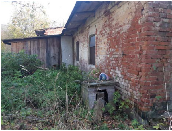
Фото 3. Вид на здание размещения Объекта оценки.