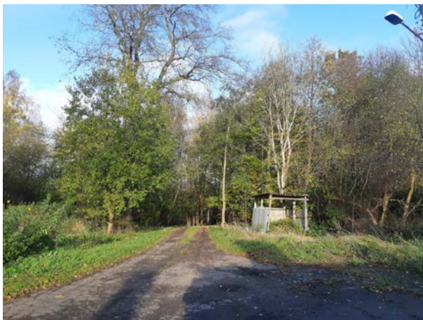
Фото 11. Ближайшее окружение.