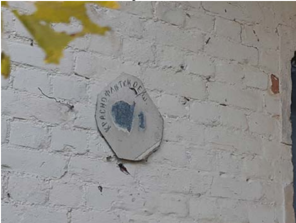
Фото 7. Адресная табличка