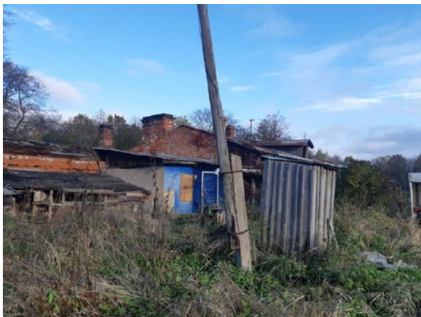
Фото 13. Вид на здание размещения Объекта оценки, ближайшее окружение.