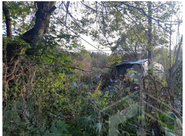
Фото 10. Ближайшее окружение.