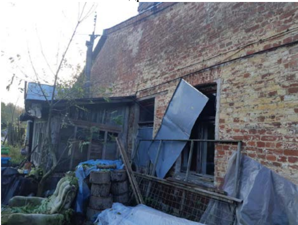
Фото 9. Вид на здание размещения Объекта оценки.