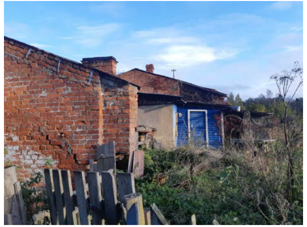
Фото 4. Вид на здание размещения Объекта оценки.