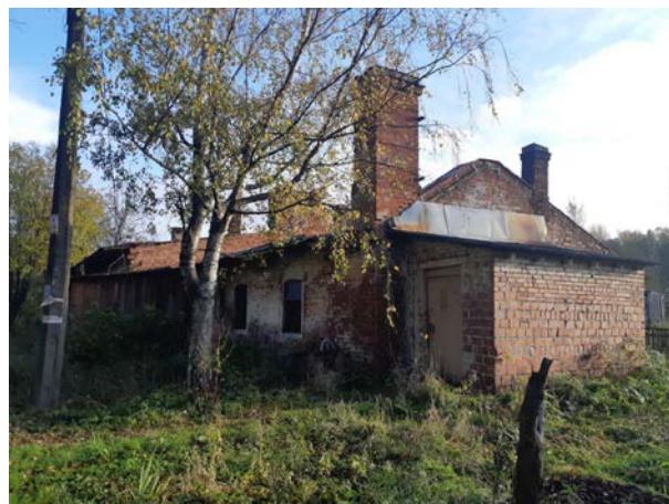
Фото 2. Вид на здание размещения Объекта оценки.