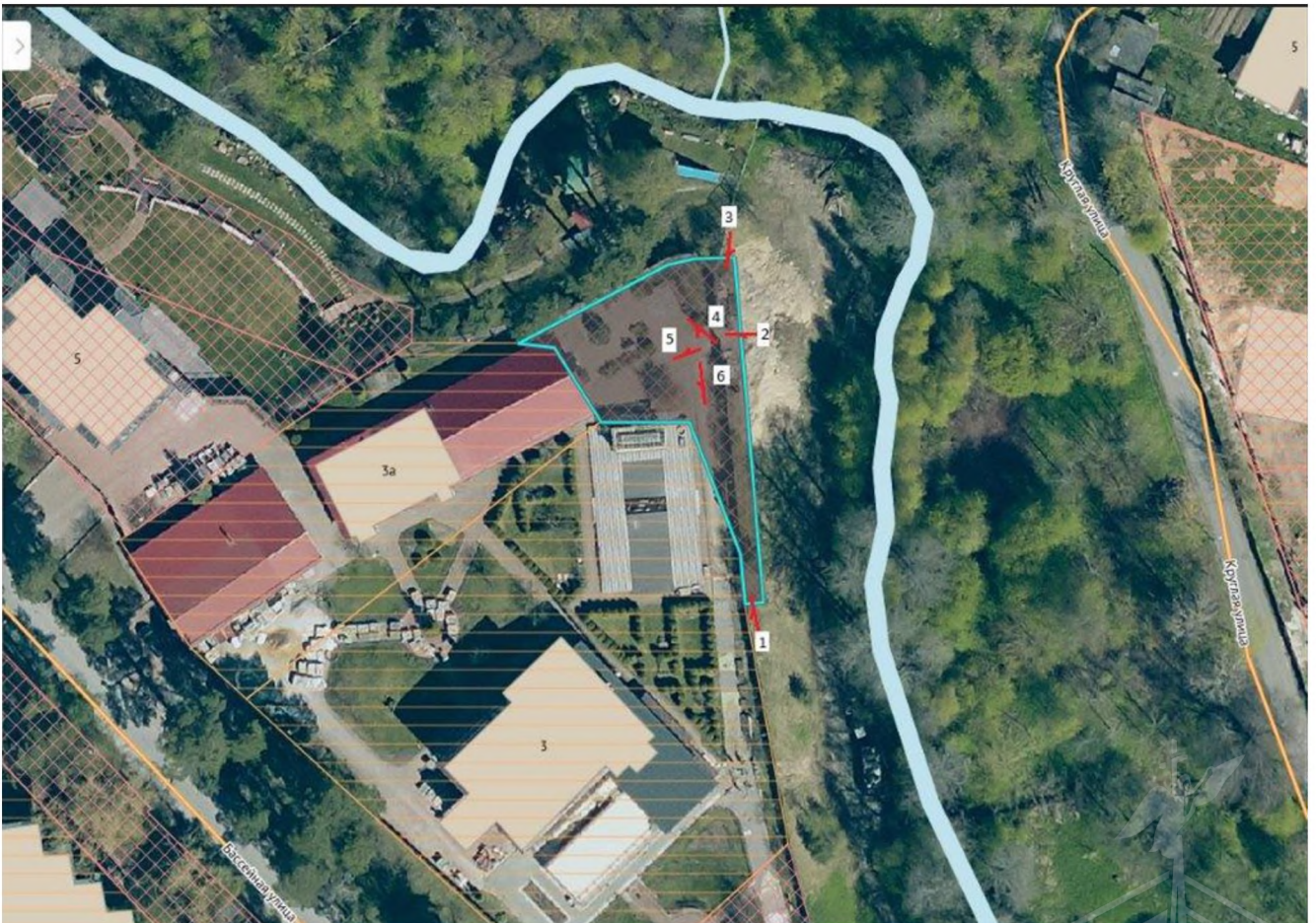
Рисунок 3 – Локальное расположение оцениваемого земельного участка