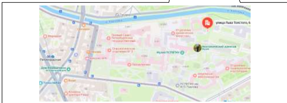
Рисунок 1. Локальное местоположение