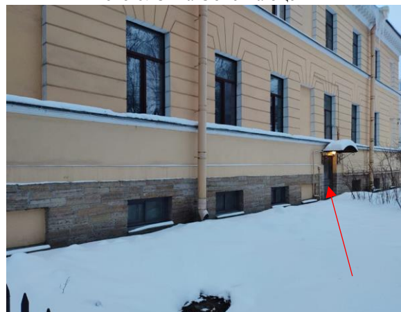
Фото 8. Общий вход с улицы Объекта оценки