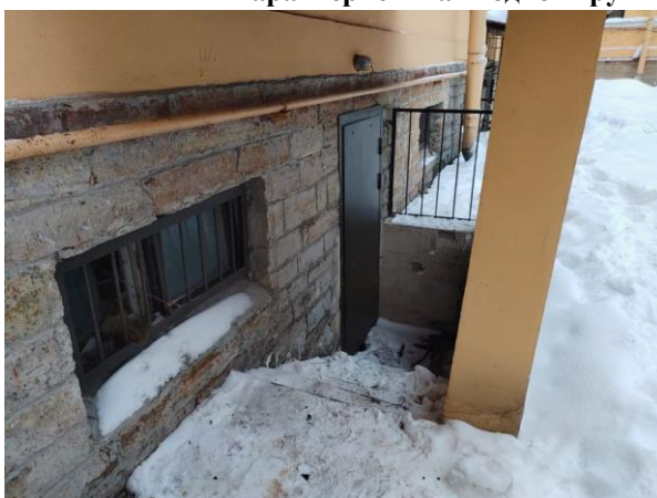
Фото 5. Общий вход со двора Объекта оценки