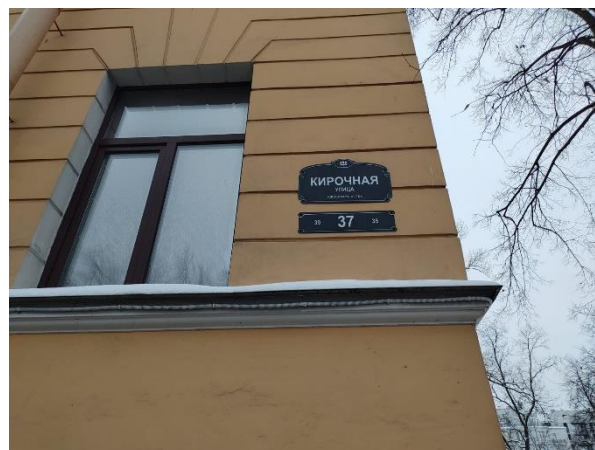
Фото 4. Табличка с номером дома