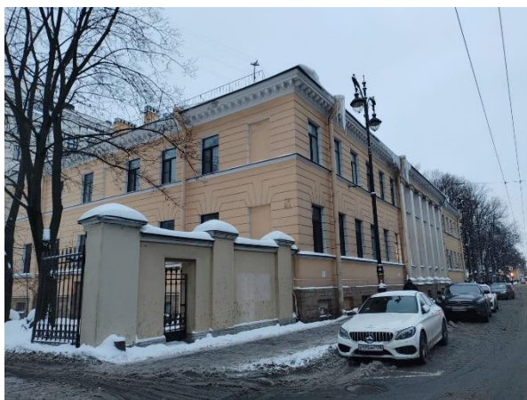
Фото 3. Вид здания Объекта оценки