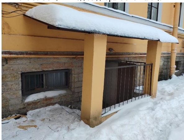
Фото 7. Общий вход со двора Объекта оценки