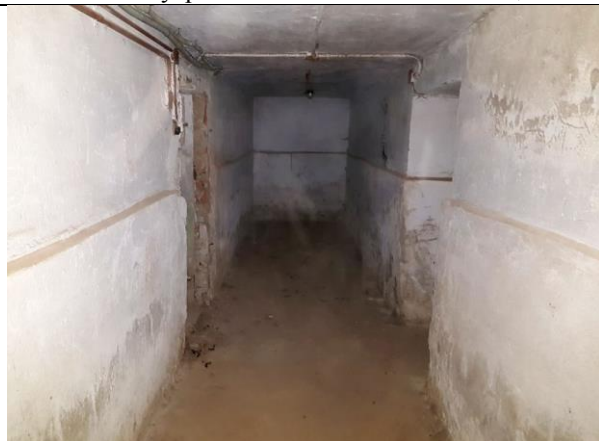
Фото 11. Внутреннее состояние Объекта оценки