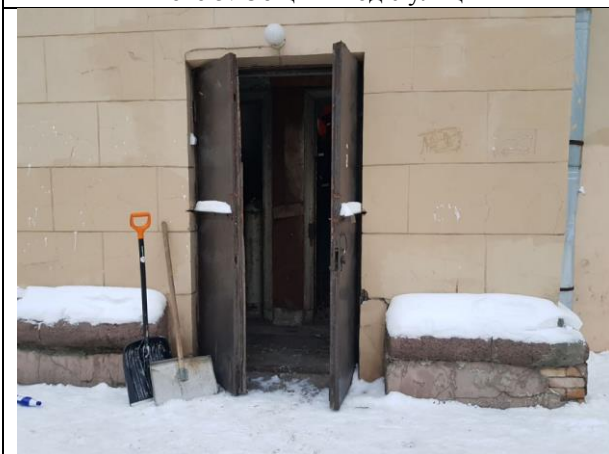
Фото 7. Общий вход с улицы