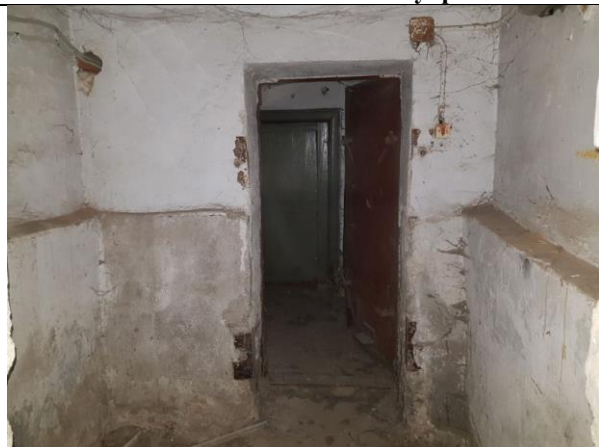
Фото 9. Внутреннее состояние Объекта оценки