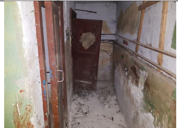
Фото 15. Внутреннее состояние Объекта оценки