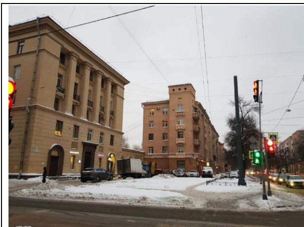
Фото 3. Ближайшее окружение