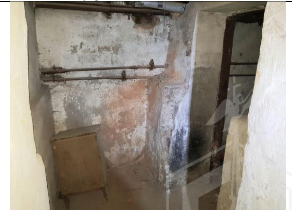
Фото 16. Внутреннее состояние Объекта оценки