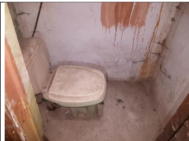
Фото 17. Внутреннее состояние Объекта оценки