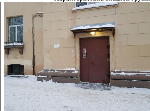
Фото 5. Общий вход с улицы