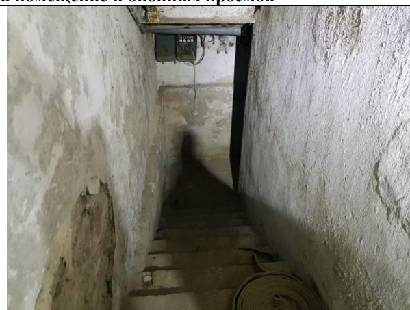
Фото 6. Доступ