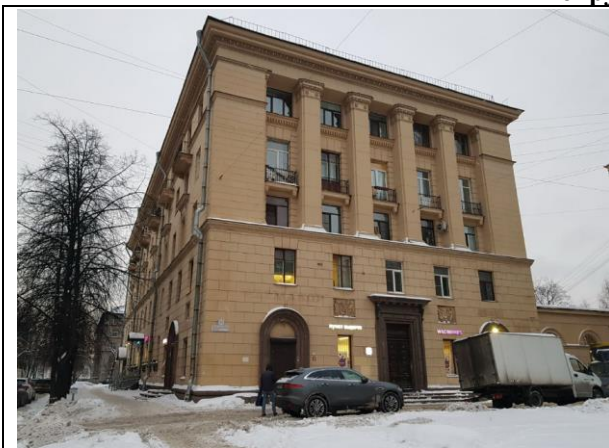
Фото 1. Вид здания, в котором расположен Объект оценки, с улицы

Общий вид здания, в котором расположен Объект оценки, придомовой территории и ближайшего окружения