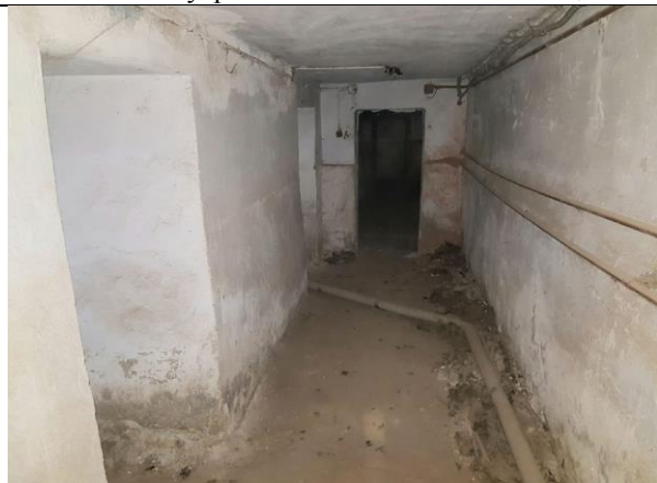
Фото 12. Внутреннее состояние Объекта оценки