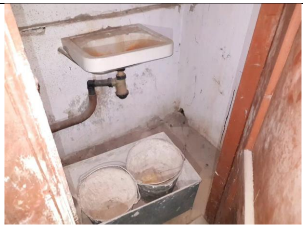
Фото 18. Внутреннее состояние Объекта оценки