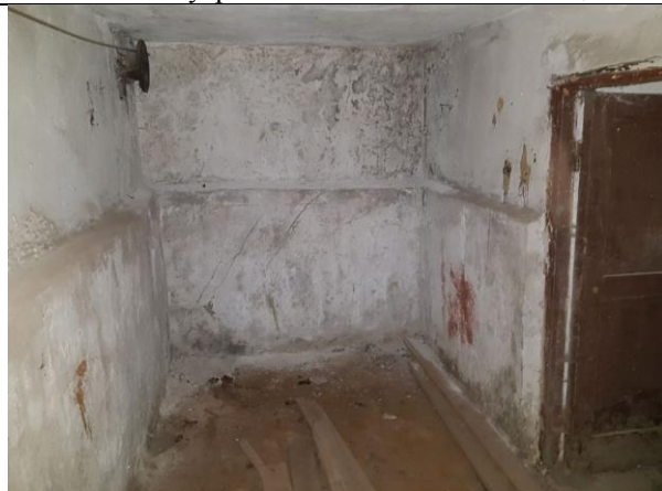
Фото 14. Внутреннее состояние Объекта оценки