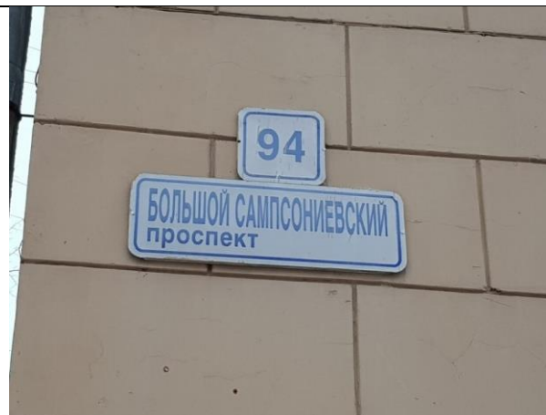
Фото 4. Табличка с номером дома