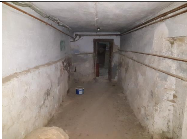
Фото 10. Внутреннее состояние Объекта оценки