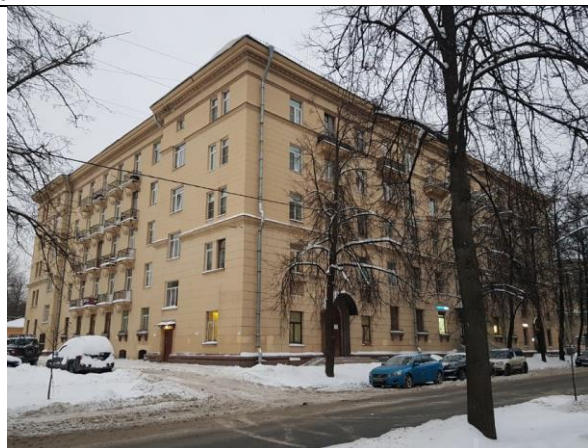
Фото 2. Вид здания, в котором расположен Объект оценки