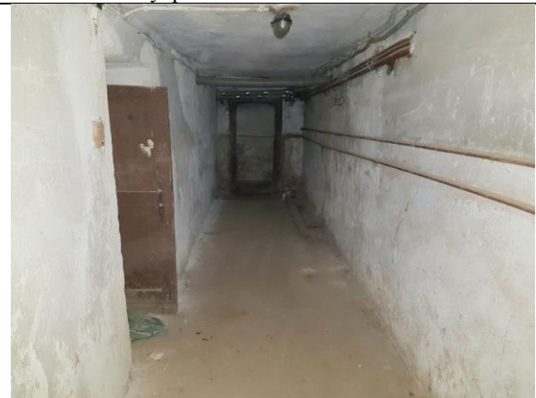
Фото 13. Внутреннее состояние Объекта оценки